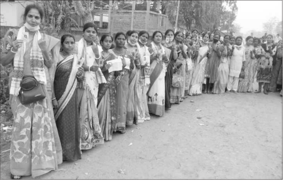
মৰিয়নিত বিধানসভা নিৰ্বাচনৰ প্ৰথম পৰ্যায়ৰ ভোটদানৰ বাবে ভোট কেন্দ্ৰত দীঘলীয়া শাৰী, শনিবাৰে।