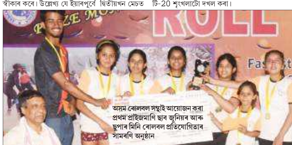
অসম বোলবল সন্থাই আয়োজন কৰা প্ৰথম প্ৰাইজমনি ছাব জুনিয়ৰ আৰু ছুপাৰ মিনি বোলবল প্রতিযোগিতাৰ সামৰণি অনুষ্ঠান

নিউজিলেণ্ডে পাঁচ উইকেটত জয়লাভ কৰিছিল। পোনতে বোটিং কৰা বাংলাদেশে ছয় উইকেটত সংগ্ৰহ কৰে 271 ৰাণ। প্ৰত্যুত্তৰত নিউজিলেণ্ডে 48.2 অভাৱত পাঁচ উইকেট হেৰুৱাই 275 ৰাণ কৰি জয়লাভ অৰ্জন কৰে। ইফালে, নিউজিলেণ্ডে প্ৰথমখন এদিনীয়া মেচত বাংলাদেশৰ বিৰুদ্ধে আঠ উইকেটত জয়লাভ কৰিছিল। পোনতে বোটিং কৰা বাংলাদেশে 41.5 অভাৱত 131 ৰাণত ইনিংছ সামৰে। প্ৰত্যুত্তৰত, নিউজিলেণ্ডে 21.2 অভাৱতে দুই উইকেট হেৰুৱাই 132 ৰাণ কৰি সহজে বিজয়লক্ষ্যত উপনীত হয়। এতিয়া কিৰি বাহিনীৰ লক্ষ্য টি-20 শৃংখলাটো দখল কৰা।