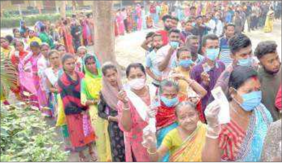
প্ৰথম পৰ্যায়ৰ ভোটদানৰ বাবে দীঘলীয়া শাৰি, ঢেকিয়াজুলিত শনিবাৰে।

গোলাঘাট সমষ্টিত ২৮৮ আৰু খুমটাই সমষ্টিত ১৯৮টা কেন্দ্ৰত পূৰ্বৰে পৰাই ভোটদাতাই ভিৰ কৰে। এইবাৰ গোলাঘাট সমষ্টিত অতিৰিক্ত ২৭টা আৰু খুমটাই সমষ্টিত অতিৰিক্ত ১০টা অৰ্থাৎ মুঠ ৩৭টা ভোট গ্ৰহণ কেন্দ্ৰৰ সংযোজন ঘটাৰ হয়। উল্লেখ্য যে গোলাঘাট সমষ্টিত ১৯টা আৰু খুমটাই সমষ্টিত দুটা ভোটগ্ৰহণ কেন্দ্ৰ সম্পূৰ্ণ ৰূপে মহিলাৰ দ্বাৰা পৰিচালিত হয়। আদৰ্শ ভোটগ্ৰহণ কেন্দ্ৰ ৰূপে প্ৰতিষ্ঠা কৰা গোলাঘাট সমষ্টিৰ হিন্দী হাইস্কুল কেন্দ্ৰ আৰু খুমটাইৰ কুৰালগুৰি হাইস্কুলত স্থাপন কৰা কেন্দ্ৰসমূহত গৰ্ভৱতী আৰু প্ৰসূতি মাতৃৰ বাবে বিশেষ সা-সুবিধা, শিশুৰ ওমলা ঘৰ, প্ৰদৰ্শনী, ছেল্ফ জ'ন, নিয়ন্ত্ৰণ আঠ পৃষ্ঠাত চাওক