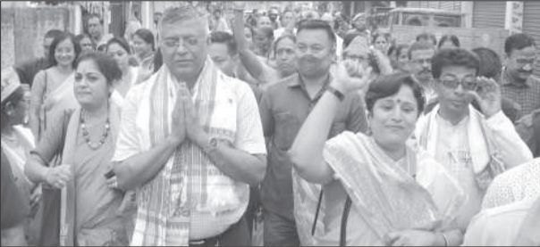
নিৰ্বাচনী প্ৰচাৰত ব্যস্ত মন্ত্ৰী সিদ্ধাৰ্থ ভট্টাচাৰ্য, মঙলদাৰে।