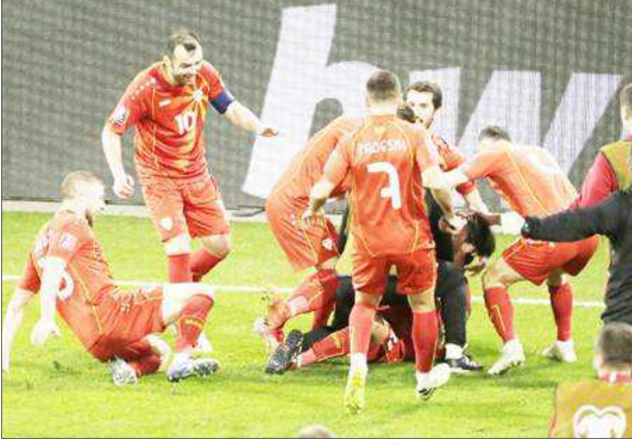
ফিফা বিশ্বকাপৰ যোগ্যতা অৰ্জনকাৰী মেচত জাৰ্মানীৰ বিৰুদ্ধে ঐতিহাসিক জয় উত্তৰ মেচিড নিয়া।

গুৱাহাটী, ১ এপ্রিল : অসম ক্ৰিকেট সন্থাই আয়োজন কৰা তৃতীয় অসম প্ৰিমিয়াৰ ক্লাব চেম্পিয়নশ্বিপৰ ফাইনেল বাউণ্ডৰ মেচ আজিৰ পৰা আৰম্ভ হৈছে। উল্লেখ্য যে দুটা স্থানত অনুষ্ঠিত হৈছে অসম প্ৰিমিয়াৰ ক্লাব চেম্পিয়নশ্বিপৰ ফাইনেল বাউণ্ডৰ মেচ। তিনিচুকীয়াৰ লগতে ডিব্ৰুগড়তো হৈছে খেলা। কাইলৈ তিনিচুকীয়াত অনুষ্ঠিত হ'বলগা মেচত গুৱাহাটীৰ বাড ক্ৰিকেট ক্লাব মুখামুখি হ'ব উত্তৰ লখিমপুৰৰ ৰংমন ক্লাবৰ বিৰুদ্ধে। ইতিমধ্যে প্ৰথম মেচত গুৱাহাটীৰ বাড ক্ৰিকেট ক্লাবে ৪৭ ৰাণত পৰাজিত কৰে উত্তৰ নলবাৰী স্প'ৰ্টছ ক্লাবক। উল্লেখ্য যে তৃতীয় অসম প্ৰিমিয়াৰ ক্লাব চেম্পিয়নশ্বিপ তিনিটা পৰ্যায়ত আয়োজন কৰিছে অসম ক্ৰিকেট সন্থাই। প্ৰথমে অনুষ্ঠিত হৈছে জিলা, বিশ্ববিদ্যালয় আৰু ছাৰ জুনিয়ৰ পৰ্যায়ৰ মেচ। তাৰপাছত দ্বিতীয় স্তৰত মণ্ডলিক পৰ্যায়ত অনুষ্ঠিত হৈছে জিলা, বিশ্ববিদ্যালয় আৰু ছাৰ জুনিয়ৰ পৰ্যায়ৰ মেচ। তাৰপাছত দ্বিতীয় স্তৰত মণ্ডলিক পৰ্যায়ত অনুষ্ঠিত হৈছে জিলা, বিশ্ববিদ্যালয় আৰু ছাৰ জুনিয়ৰ পৰ্যায়ৰ মেচ। তাৰপাছত দ্বিতীয় স্তৰত মণ্ডলিক পৰ্যায়ত অনুষ্ঠিত হৈছে জিলা, বিশ্ববিদ্যালয় আৰু ছাৰ জুনিয়ৰ পৰ্যায়ৰ মেচ। তাৰপাছত দ্বিতীয় স্তৰত মণ্ডলিক পৰ্যায়ত অনুষ্ঠিত হৈছে জিলা, বিশ্ববিদ্যালয় আৰু ছাৰ জুনিয়ৰ পৰ্যায়ৰ মেচ। তাৰপাছত দ্বিতীয় স্তৰত মণ্ডলিক পৰ্যায়ত অনুষ্ঠিত হৈছে জিলা, বিশ্ববিদ্যালয় আৰু ছাৰ জুনিয়ৰ পৰ্যায়ৰ মেচ।