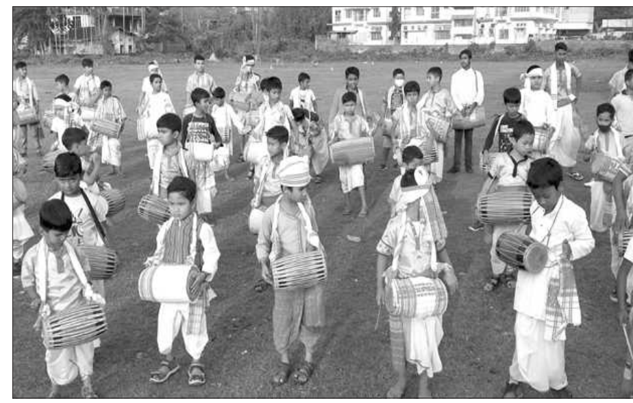
গোলাঘাটত বিহুৰ কৰ্মপালাত অংশগ্ৰহণ কৰা একাংশ প্ৰশিক্ষাৰ্থী, বৃহস্পতিবাৰে।