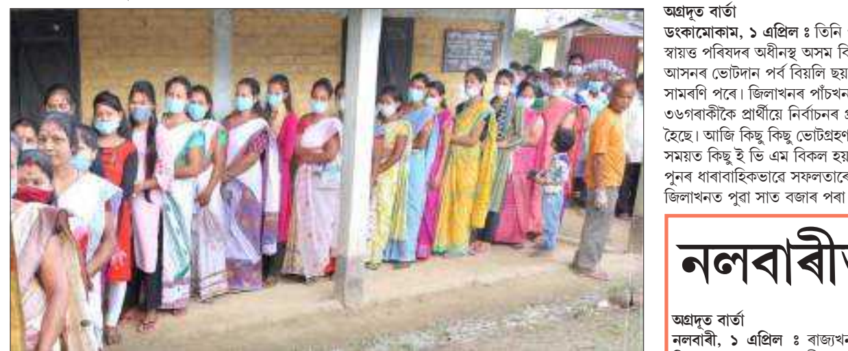
নলবাৰীৰ এটা ভোটকেন্দ্ৰত ভোটাৰ দীঘলীয়া শাৰী, বৃহস্পতিবাৰে।