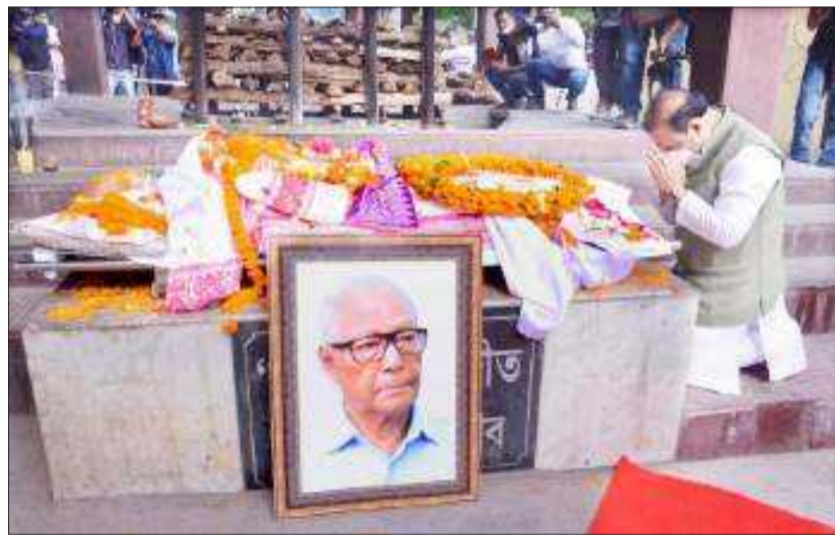
হোমেন বৰগোহাঞিৰ অস্তিম শ্ৰদ্ধাঞ্জলি জ্ঞাপন মুখ্যমন্ত্ৰী ড° হিমন্ত বিশ্ব শৰ্মাৰ, নৱগ্ৰহ শ্মশানত বুধবাৰে।

শেষকৃত্য অনুষ্ঠানত উপস্থিত থাকি মুখ্যমন্ত্ৰীয়ে জনালে শ্ৰদ্ধাঞ্জলি স্তম্ভ বিপৰ্চাৰ