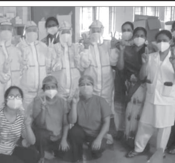
ডিব্ৰুগড়ৰ অসম চিকিৎসা মহাবিদ্যালয় হাস্পতালত আন্তঃজাতিক নাৰ্ছ দিৱস পালন, বুধবাৰে।

বিশেষ সংবাদদাতা নগাৰাট, ১২ মে' : এফালে, কৰ'না সংক্ৰমণৰ ভয় আনফালে এটা ক'ভিড প্ৰতিষেধক বিচাৰি চিকিৎসালয়সমূহত হাহাকাৰ কৰিবলগীয়া পৰিস্থিতিৰ সৃষ্টি হৈছে।