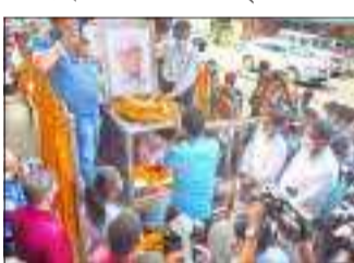
বিশেষ সংবাদদাতা লখিমপুৰ, ১২ মে' ৪ লখিমপুৰ

বাপুৰণৰ বিয়োগত শোকস্তম্ভ চকুৰাখনা-লখিমপুৰ