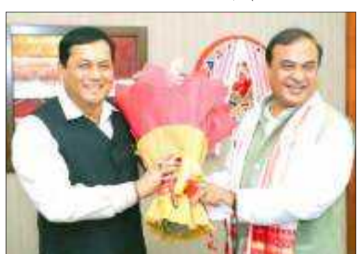
সোণোৱালক সাক্ষাৎ কেবিনেটৰ

অসমত গ্ৰামোদয় সম্ভৱ কৰি তুলিম, দায়িত্ব লৈ ঘোষণা মন্ত্ৰী ৰঞ্জিৎ দাসৰ