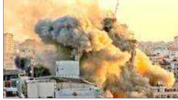
বৃহৎপৰিমাণে ইজৰাইলে গাজাত বকেটৰে আক্ৰমণ অব্যাহত ৰাখে। হামাছৰ ঘাটত বায়ুসেনাৰ ব্যাপক বোমাবৰ্ষণৰ পাছত এইবাৰ ইজৰাইলী সেনাই অঞ্চলটোত স্থলসেনাৰে বৃহৎ আক্ৰমণ সংঘটিত কৰিবলৈ যো-জা চলাইছে। ইহুদী আৰু ইছলামধৰ্মীৰ মাজত হোৱা শেহতীয়া সংঘাতৰ

নিউজ যুবা' জেকজালেম, ১৪ মে' ৪ ইজৰাইলে অচিৰে হামাছৰ ঘাটত স্থলসেনাৰে বৃহৎ আক্ৰমণ সংঘটিত কৰাৰ সম্ভাৱনা আছে। দেশখনে প্ৰকাশ কৰা মতে, গাজা সীমান্তলৈ বৃহৎ পৰিমাণত ইজৰাইলী সেনাক প্ৰেৰণ কৰা হৈছে আৰু হামাছ শাসিত বিতৰ্কিত অঞ্চলটোত ভূমিৰে আক্ৰমণ সংঘটিত কৰাৰ বাবে ৯,০০০ সৈনিকক ইতিমধ্যে সাজু কৰি ৰাখিছে।