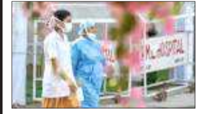
নিউজ যুবা', নতুন দিল্লী, ১৪ মে' ৪ কৰ'না ভাইৰাছৰ ব্যাপক সংক্ৰমণৰ মাজতে স্বাস্থ্য বিশেষজ্ঞৰ দেশবাসীক এক সুখবৰ দিলে। বিশেষজ্ঞসকলৰ মতে, উত্তৰ প্ৰদেশ, মধ্য প্ৰদেশ, দিল্লী, গুজৰাট, চণ্ডিছগড় আৰু মহাৰাষ্ট্ৰত ইতিমধ্যে ক'ভিড-১৯ৰ সংক্ৰমণৰ দ্বিতীয়টো ঢৌৰে শীৰ্ষত আৰোহণ কৰিলে। অৰ্থাৎ এতিয়াৰে পৰা এই ছয় ৰাজ্যত ক'ভিডৰ দৈনিক সংক্ৰমণ কমে হুস পোৱাৰ সম্ভাৱনা আছে।

বিশেষজ্ঞৰ দাবী : উত্তৰ প্ৰদেশ, মধ্য প্ৰদেশ, দিল্লীত শীৰ্ষত আৰোহণ কৰ'নাৰ