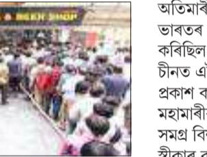
লৈছিল। কৰ'না কালত ৬৬ শতাংশ ভাৰতীয়ই প্ৰকাশ কৰা মতে, তেওঁলোকে স্বাস্থ্যসম্মত আহাৰ গ্ৰহণত গুৰুত্ব আৰোপ কৰিলে।

নিউজ যুবা', নতুন দিল্লী, ১৪ মে' ৪ কৰ'না ভাইৰাছৰ সংক্ৰমণৰ পাছৰে পৰা বিশ্বত বৃহৎ পৰিৱৰ্তন দেখা দিলে। বিশ্ববাসীৰ খাদ্যাভ্যাস, জীৱনশৈলী, বজাৰ-সমাৰ কৰা পদ্ধতি আদি বহু দিশৰ ব্যাপক সলনি হ'ল।