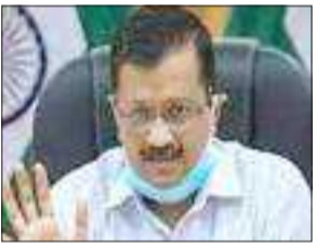
ভাইৰাছৰ বিৰুদ্ধে যুঁজ এতিয়াই সমাপ্ত হোৱা নাই আৰু সেয়েহে কৰ'না প্ৰতিৰোধৰ ক্ষেত্ৰত চৰকাৰে এই মুহূৰ্তত কোনো শিথিলতা দিব বিচৰা নাই।

নিউজ যুবা' নতুন দিল্লী, ১৪ মে' ৪ দিল্লীৰ মুখ্যমন্ত্ৰী অৰবিন্দ কেজৰিৰালে আজি ঘোষণা কৰি কয় যে ক'ভিড-১৯ত সংক্ৰমিত হৈ পৰিয়ালৰ একমাত্ৰ উপাৰ্জনকাৰী ব্যক্তিৰ মৃত্যু হ'লে সেই পৰিয়ালক চৰকাৰে আৰ্থিক সাহায্য প্ৰদান কৰাৰ লগতে মহামাৰীত আনধা হোৱা সন্তানক অধ্যয়ন আৰু প্ৰতিপালনৰ ব্যয় বহন কৰিব।