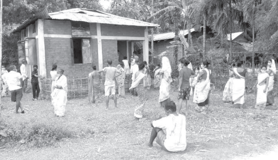
গৃহপুত্ৰ ক'ভিড প্ৰতিৰোধকৰ বাবে অপেক্ষা, গুৰুবাৰে।