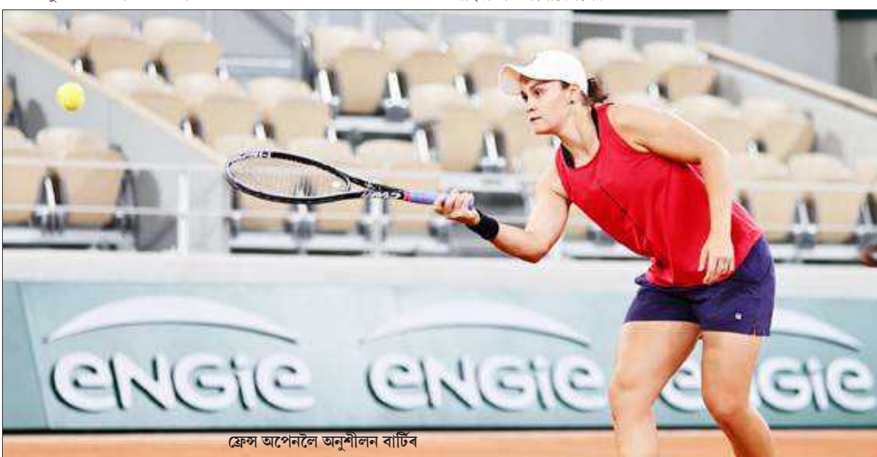
ফ্ৰেন্স অপেনলৈ অনুশীলন বাটৰ

লিছবন, ২৮ মে' : চেম্পিয়নছ লীগ ফুটবলৰ ফাইনেল মেচখন কাইলৈ পূৰ্ণগালৰ লিছবনত অনুষ্ঠিত হ'ব। এই মেচত উপস্থিত থাকিব ৫০ শতাংশ দৰ্শক। উল্লেখ্য যে চেম্পিয়নছ লীগৰ ফাইনেলৰ দিন নিশ্চিত হৈছিল যদিও মেচৰ স্থান নিশ্চিত হোৱা নাছিল। প্ৰথমে এই মেচখন ইষ্টনবুলত অনুষ্ঠিত হোৱাৰ কথা আছিল। কিন্তু পাছত সেয়া বাতিল কৰা হৈছে। কৰ'নাৰ বাবে ইষ্টনবুলত অনুষ্ঠিত নহয় চেম্পিয়নছ লীগ ফুটবলৰ ফাইনেল। তাৰপাছত ফাইনেল মেচখন লণ্ডনৰ বেছলি ষ্টেডিয়ামত আয়োজন কৰাৰ বিষয়ে ভবা হৈছিল যদিও সেয়াও বাতিল কৰা হয়। কাৰণ এইবাৰ চেম্পিয়নছ লীগ ফুটবলৰ ফাইনেল মেচখন দুটা ইংলণ্ডৰ ক্লাবৰ মাজত অনুষ্ঠিত হ'ব। চেম্পিয়নছ লীগৰ খিতাপৰ বাবে চেলছিয়ে খেলিব মানচেষ্টাৰ চিটাৰ বিৰুদ্ধে। সকলো আলোচনাৰ পাছত পূৰ্ণগালৰ লিছবনত অনুষ্ঠিত হ'ব চেম্পিয়নছ লীগ ফুটবলৰ ফাইনেল। ইফালে, ফাইনেল মেচৰ বাবে লিছবন আদৰ্শ জনাইছে ইংলিছ ফুটবলপ্ৰেমীক। যিহেতু দুটা ইংলিছ ক্লাবে ফাইনেল খেলিব সেয়ে ষ্টেডিয়ামৰ গেলেৰী ইংলণ্ডৰ ফুটবলপ্ৰেমীৰ বাবে মুকলি কৰা হ'ব বুলি জনায়। ষ্টেডিয়ামত ইংলণ্ডৰ যোৱা হেজাৰ পাঁচশ দৰ্শকৰ প্ৰবেশৰ অনুমতি দিয়া হৈছে। উল্লেখ্য যে ইয়াৰপূৰ্বে দুবাৰ দুটা ইংলণ্ডৰ দলে চেম্পিয়নছ লীগ ফুটবলৰ ফাইনেলত পৰস্পৰে পৰস্পৰ বিৰুদ্ধে খেলিছিল। ২০০৮ ত চেম্পিয়নছ লীগ ফুটবলৰ ফাইনেলত চেলছিয়ে খেলিছিল মানচেষ্টাৰ ইউনাইটেডৰ বিৰুদ্ধে। আনহাতে, ২০১২ ত চেম্পিয়নছ লীগ ফুটবলৰ ফাইনেলত লিভাৰপুলে খেলিছিল ট'টেনহামৰ বিৰুদ্ধে।