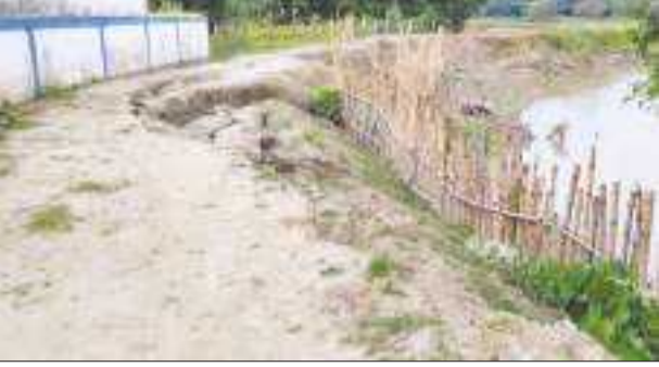
পাটাতছাৰকুছি, ২৯ জুন : কালদিয়াৰ দেখাটাত অঞ্চলত ভয়াবহ ৰূপ নেৰে খহনীয়াই বজালী জিলাৰ টিহু-ধাৰণা কৰিছে। হেলনাৰ দুহাইত