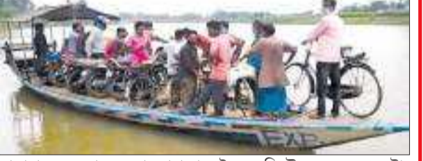
যাতায়াতৰ একমাত্ৰ ভৰসা। সাধাৰণ নদী এখনত দলং নথকা বাবেই অঞ্চলটোৰ ৰাইজে এশ্বুলেপ, অগ্নিনিৰ্বাপক আদি জৰুৰীকালীন সেৱাৰ পৰাও বঞ্চিত হ'বলগীয়া