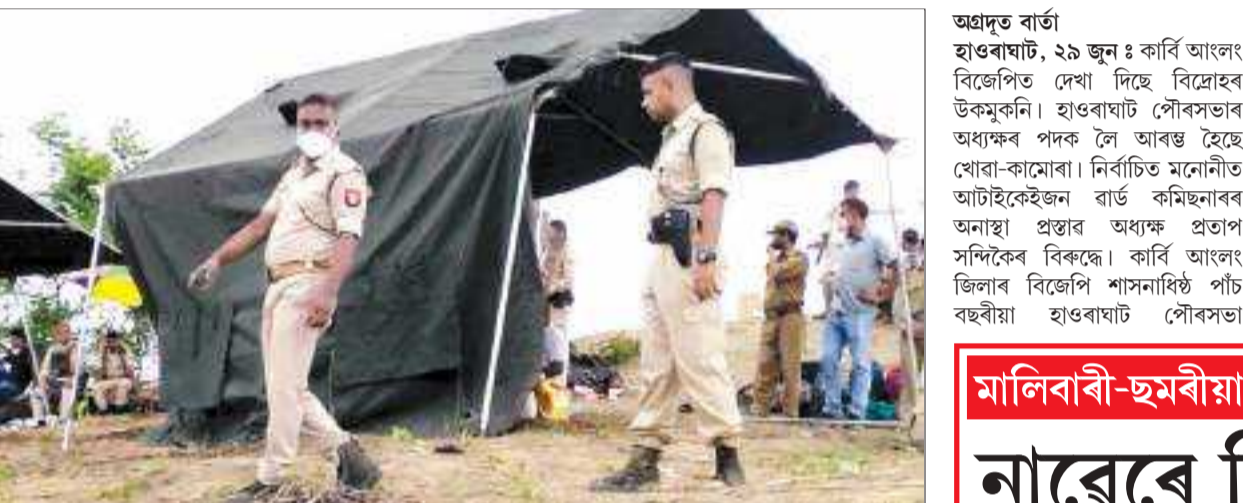
ফেপেৰি পাতি নগাই বেদখল কৰা দিটে ভেঙী সংৰক্ষিত বনাঞ্চলত অসম আৰক্ষীৰ বেটেলিয়ান শিবিৰ স্থাপন, মঙলবাৰে।