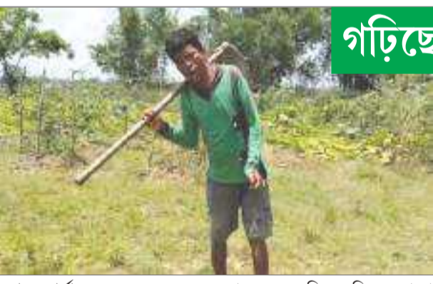
অগ্ৰদূত বাৰ্তা শৈল্যমাৰ, ২৯ জুন : মনত প্ৰবল ইচ্ছা শক্তি আৰু কিবা এটা কৰাৰ বাবে লক্ষ্য স্থিৰ কৰিলে কোনো সমস্যাই বাধাৰ প্ৰাটীৰ হৈ থিয় হ'ব নোৱাৰে। শাৰীৰিক বাধাক নেওচি বিশেষভাৱে