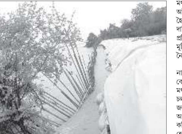
বাৰে টিকাদাৰে। উক্ত অভিযোগ মতে, জিঅ'বেগ আঁচনিৰ কাম কৰাৰ সময় উকলি যোৱাৰ বাবে

অগ্ৰদূত বাৰ্তা অভয়াপুৰী, ৩ জুলাই : শৈল বাহু, কংক্ৰিটৰ পাকুপাইন আদিৰে খহনীয়া প্ৰতিৰোধ কৰিব নোৱাৰা জলসম্পদ বিভাগে বৰুইগাঁও জিলাৰ সৃজনগ্ৰামত তিৰপালেৰে ঢাকি খহনীয়া প্ৰতিৰোধ কৰাৰ ব্যৰ্থ চেষ্টা চলোৱা কাৰ্যই প্ৰতিক্ৰিয়াৰ সৃষ্টি কৰিছে। উল্লেখ্য যে সৃজনগ্ৰাম অঞ্চলৰ সিদলসতী-বজালুৰি মথাউৰিটোৰ ছবামাৰা অংশত আই নৈয়ে তীব্ৰ খহনীয়াৰ সৃষ্টি কৰাত অঞ্চলটোৰ ক্ৰমে বটগুৰী, চাৰিপুনীয়া, দৰকিনামাৰী, কাকৈজানা, পায়ৰাপাৰা, দেৱানপাৰা, হেৰোপাৰা, সোণাখুলি, বৰঘোলা, খামাৰপাৰা, চুকানী, পাহিৰীগুৰী আদি গাঁওসমূহৰ বাহিৰে আতংকিত হৈ