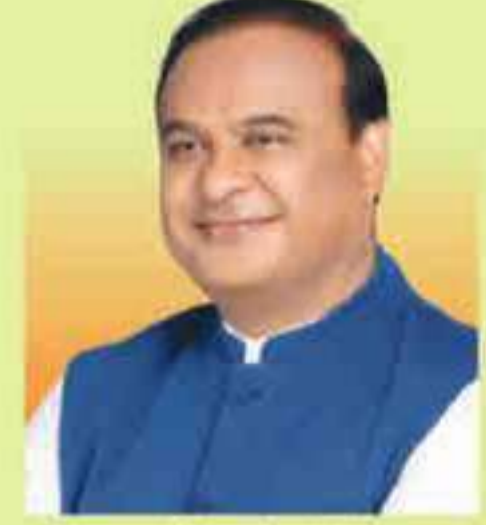
ড° হিমন্ত বিশ্ব শৰ্মা মুখ্যমন্ত্রী, অসম