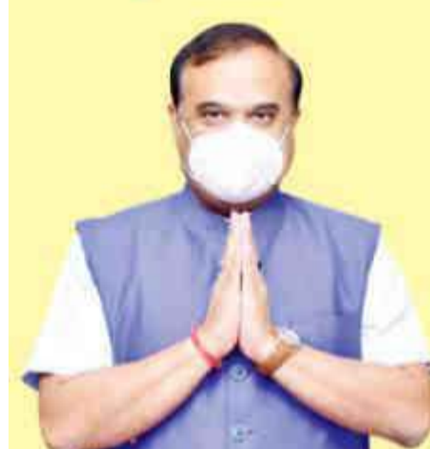
ড° হিমন্ত বিশ্ব শৰ্মা মুখ্যমন্ত্ৰী, অসম

চলিত মহামাৰীৰ সময়ত বহুতে নিজৰ আপোনজনক হেৰুৱাইছে। ক'ভিড-১৯ৰ ফলত স্বামীহাৰা হোৱা সকলো মহিলাক সামাজিক আৰু বিত্তীয় সুৰক্ষা প্ৰদান কৰাৰ উদ্দেশ্যে অসম চৰকাৰে 'মুখ্যমন্ত্ৰীৰ ক'ভিড-১৯ বিধৱা সাহায্য আঁচনি' নামেৰে এক বিশেষ পদক্ষেপ আৰম্ভ কৰিছে। আঁচনিখনৰ অধীনত এই সংকটৰ সময়ত এনে মহিলাসকলক ২,৫০,০০০ টকাৰ এককালীন বিত্তীয় সাহায্য প্ৰদান কৰা হ'ব।