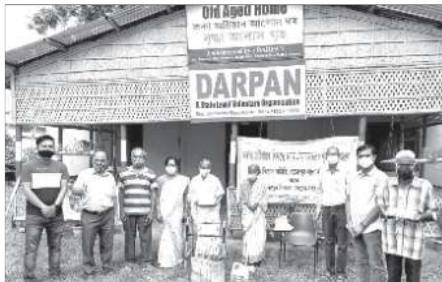
তেজপুৰৰ বৃদ্ধাশ্ৰমত মাৰ্ক্স-ছেনিটাইজাৰ বিতৰণ এছবিআই-বিজ্ঞান কেন্দ্ৰৰ, শনিবাৰে।