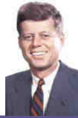
জন এফ কেনেডী প্ৰাক্তন মাৰ্কিন ৰাষ্ট্ৰপতি

যিয়ে শোচনীয়ভাৱে ব্যৰ্থ হোৱাৰ সাহস ৰাখে, তেৱেই বিপুল সাফল্যৰ অধিকাৰীও হ'ব পাৰে।