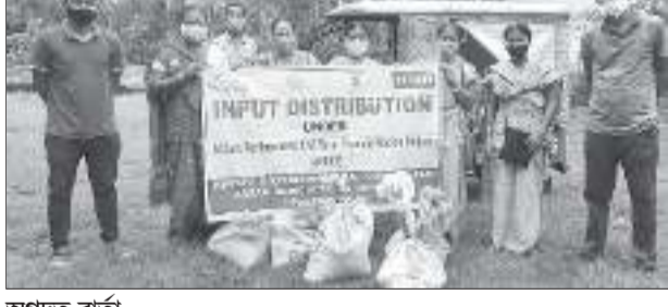
অগ্ৰদূত বাৰ্তা দোতমা/ফৰ্কাৰাগ্ৰাম, ৩ জুলাই : কোকৰাঝাৰ জিলাৰ গোসাইগাঁও মহকুমাৰ অন্তৰ্গত তেজীপাৰাস্থিত কৃষি বিজ্ঞান কেন্দ্ৰই আজি ধানৰ বিধান বিতৰণ কৰে। শালি ধানৰ খেতি উন্নত কৰাৰ বাবে কৃষি বিজ্ঞান কেন্দ্ৰই কৃষি আৰু গ্ৰাম্য পৰিৱৰ্তন প্ৰকল্পৰ অধীনত বাৰিষা স্বত্বত হোৱা ধানৰ বিধান কৃষকৰ মাজত বিতৰণ কৰে। এই ধানৰ বিধানৰ ভিতৰত বঞ্জিত (১) ৫৭০ কেজি, বাহাদুৰ (১) ৩৩০ কেজি, স্বৰ্ণ (১) ৯০ কেজি। ইপিনে উন্নত প্ৰজাতিৰ ধানৰ বিধানৰ মাজত ক'লা জহা ১৮০ কেজি, বকুল জহা ৩০ কেজি, চি আৰ সূদগ ধান (৯০৯) ১৫০ কেজি ধানৰ বিধান বিতৰণ কৰে। উল্লেখ্য যে ইতিমধ্যে কোকৰাঝাৰ জিলাৰ ৯০ শতাংশ কৃষকে ধানৰ বিধান ৰোপণ কৰিছে। অৱশ্যে কেন্দ্ৰই পলমকৈ বিধান বিতৰণ কৰাত বাহিৰে আশ্চৰ্য প্ৰকাশ কৰিছে।