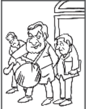
ফাট গ'লেও নিজৰ টেল নিজেই নবজালে আৰু কোনে বজাব!