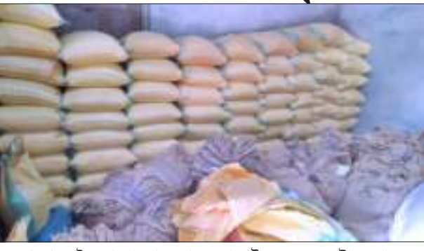
বাংলাদেশলৈ প্ৰেৰণৰ বাবে সাজু কৰা চাউল জৰুৰী বৰপেটাৰ গুদামত।