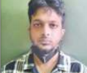
স্টাফ ৰিপ'ৰ্টাৰ গুৱাহাটী, ২৮ আগষ্ট : দীৰ্ঘদিন ধৰি মহানগৰীৰ বহু সন্ত্ৰাস আৰু প্ৰতিষ্ঠিত লোকলৈ দিল্লীৰ পৰা কুৰিয়াৰ ছাৰ্ভিচৰ জৰিয়তে নিষিদ্ধ কোকেইন সৰবৰাহ হৈ অহাৰ তথ্য লাভ কৰিছে অসম আৰক্ষীয়ে। ৰাজ্যৰ বিভিন্ন ১০ পৃষ্ঠাত চাওক

২০১৬ত দিল্লীত পঢ়া শেষ কৰি নামি পৰিছিল ড্ৰাগছ সৰবৰাহত