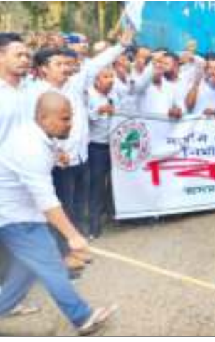
নামনি সোঁৱণশিবি জনবিদ্ৰোহ প্ৰকল্প নিৰ্মাণ কাৰ্য বন্ধ কৰাৰ দাবীত যুৱ-ছাত্ৰ পৰিষদৰ বিক্ষোভ, শনিবাৰে।