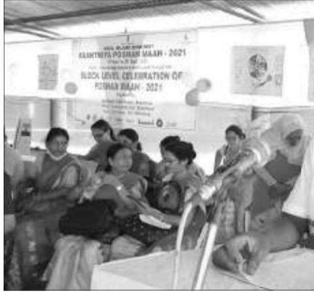
মুকালমুৱাৰ সংহত শিশু উন্নয়ন প্ৰকল্পত পোষণ সভাৰ দৃশ্য।

বিশেষ সংবাদদাতা নগাঁও, ২১ ছেপ্টেম্বৰ ৪ নগাঁৱৰ ছহিদ ভৱনত দুদিনীয়া কাৰ্যসূচীৰে প্ৰধানমন্ত্ৰী নৰেন্দ্ৰ মোদীৰ ৭১ সংখ্যক জন্মদিৱস আৰু সফল প্ৰশাসনৰ দুই দশক সম্পূৰ্ণ হোৱাৰ উদ্যোগত বিজেপিৰ যুৱ মৰ্চাৰ নগাঁও জিলা সমিতিৰ উদ্যোগত আয়োজিত 'সেৱা আৰু সমৰ্পণ' অভিযানৰ লগত সংগতি ৰাখি যোৱা ১৯ ছেপ্টেম্বৰত 'নৱ ভাৰত মেলা'ৰ আৰম্ভ কৰা হয়।