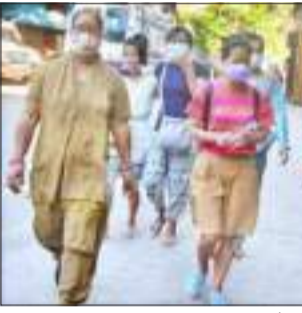
ষ্টাফ ৰিপ'ৰ্টাৰ গুৱাহাটী, ২১ ছেপ্টেম্বৰঃ বহিঃগাঁৱৰ অনুপ্ৰবেশক লৈ অব্যাহত সতৰ্কতাৰ মাজতে গুৱাহাটীত যোৱা ১২ ছেপ্টেম্বৰত ম্যানমাৰৰ চিন উপ-জাতিৰ ২৬ জনীয়া এটা দল গ্ৰেপ্তাৰৰ ঘটনাই গৃহ মন্ত্ৰণালয়কো জোকাৰিছে। সেয়েহে সম্প্ৰতি কাৰাবন্দী হৈ থকা যুবক-যুবতীৰ এই দলটোক কেন্দ্ৰীয় তদন্তকাৰী একাধিক সংস্থা ইতিমধ্যে জেৰা কৰিছে। সমান্তৰালভাৱে অসম আৰক্ষীৰ জেৰাও অব্যাহত আছে। এনে জেৰাত নতুন এই অনুপ্ৰবেশকাৰীসকলৰ ক্ষেত্ৰত পোহৰলৈ আহিছে ইয়াৰ অন্তৰালত থকা যত্নসূত্ৰৰ তথ্য। উল্লেখ্য যে ম্যানমাৰৰ চিন প্ৰদেশৰ ফালাম আঠ পৃষ্ঠাত চাওক

■ সংগঠিত ৰূপত ভাৰতলৈ আনি সংস্থাপিত কৰাৰ যত্নসূত্ৰ ■ ধৰ্ম প্ৰচাৰ কাৰ্যত নিয়োজিত কৰাই উদ্দেশ্য বুলি সন্দেহৰ সৃষ্টি ■ মিজোৰাম আৰক্ষীৰ জৰুৰী পত্ৰ ■ অসম আৰক্ষীৰ লগতে কেন্দ্ৰীয় তদন্তকাৰী সংস্থাবো জেৰা অব্যাহত ■ সম্প্ৰতি জেলত আবদ্ধ