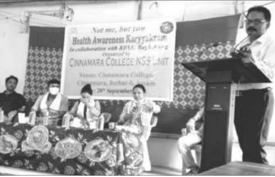
চিনামাৰা মহাবিদ্যালয়ৰ এন এছ এছৰ স্বাস্থ্য সজাগতা শিবিৰৰ দৃশ্য।

অগ্ৰদূত বাৰ্তা লাহৰীঘাট, ২১ ছেপ্টেম্বৰ ৪ খহনীয়াগ্ৰস্ত লাহৰীঘাট অঞ্চলৰ দুখীয়া দৰিদ্ৰক সহায়ৰ বাবে আগবাঢ়ি আহিছে বহিঃৰাজ্য হায়দাৰাবাদৰ 'স্বাহায়াত ট্ৰাষ্ট' নামৰ বেছছালোৰী সংগঠনটোৰ ফালৰ পৰা অঞ্চলটোৰ নদী কাষৰীয়া গৰম বজাৰ, কাঠনিৰ লগতে মধ্যভাৰত বসবাস কৰা ২৩০ টা দৰিদ্ৰ পৰিয়ালক খাদ্য-সামগ্ৰী যোগান ধৰে।