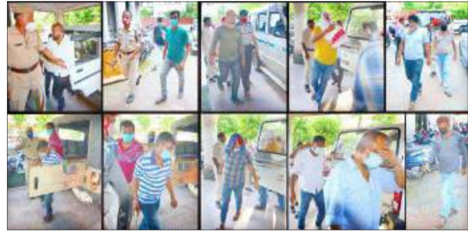
মহানগৰীৰ বিভিন্ন স্থানৰ পৰা আৰক্ষীয়ে আটক কৰা মাটিৰ দালাল, মঙলবাৰে।