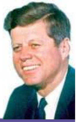
জন এফ কেনেডী প্ৰাক্তন মাৰ্কিন ৰাষ্ট্ৰপতি

শান্তি হৈছে ক্ৰমশঃ পৰিৱৰ্তিত মতৰ এক দৈনিক, সাপ্তাহিক আৰু মাহিলি প্ৰক্ৰিয়া। ই লাহে লাহে পুৰণি বাধা ওফৰায় আৰু নীৰৱে নতুন গাঁথনি নিৰ্মাণ কৰে।