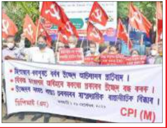
চৰকাৰী সম্পত্তি বেদখলকাৰীৰ পুনৰসংস্থাপন কৰাৰ কোনো নীতি নাইঃ চক্ৰ বিষয়া

ধলপুৰ, ২১ ছেপ্টেম্বৰঃ যোৱা সোমবাৰে দৰং জিলা প্ৰশাসনৰ দ্বাৰা উচ্ছেদিত বেদখলকাৰী হেজাৰ হেজাৰ লোকৰ ভৱিষ্যৎ অন্ধকাৰৰ পিনে গতি কৰিছে। কিয়নো উচ্ছেদিত ২৪ ঘণ্টা পৰ হৈ যোৱাৰ পাছত আজি ছিপাৰাৰ ৰাজহ চক্ৰৰ চক্ৰ বিষয়াই স্পষ্টকৈ ঘোষণা কৰে যে চৰকাৰী সম্পত্তি বেআইনীভাৱে দখল কৰা লোকৰ বাবে উচ্ছেদৰ পৰৱৰ্তী সময়ত পুনৰসংস্থাপনৰ কোনো চৰকাৰী নিয়ম নাই। ফলস্বৰূপে উচ্ছেদিত লোকসকলৰ মাজত হাহাকাৰ পৰিষ্ফিৰিত সৃষ্টি হৈছে। তেওঁলোকে লগতে শংকাৰে প্ৰশ্ন কৰিছে— উচ্ছেদিত লোকসকল এতিয়া যাম ক'লৈ? দুই পৃষ্ঠাত চাওক