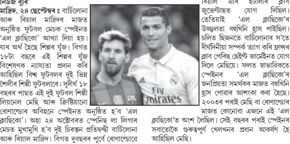
বিয়াল এৰি ইটালীৰ ক্লাব জুভেণ্টাছত যোগ দিছিল। তেতিয়াই 'এল ক্লাছিকো'ৰ উজ্জ্বলতা বৰ্ধনিত ভ্ৰাস পাইছিল। চলিত ছিজনতে বাৰ্চিলোনাৰ স'তে দীৰ্ঘদিনীয়া সম্পৰ্ক ত্যাগ কৰি ফ্ৰান্সৰ ক্লাব পেৰিছ ছেইণ্ট জাৰ্মেইনত যোগ দিলে মেছিয়ে।

উল্লেখ্য যে আগষ্টক এছিয়ান টেবুল টেনিছ চেম্পিয়নশ্বিপৰ বাবে গঠন কৰা ভাৰতীয় দলৰ পৰা দেশৰ শীৰ্ষ খেলুৱৈগৰাকীক বাদ দিয়া হৈছে। তেওঁৰ বিপক্ষে উপস্থাপিত হয় প্ৰতিযোগিতাৰ বাবে আয়োজিত প্ৰস্তুতি শিবিৰত উপস্থিত