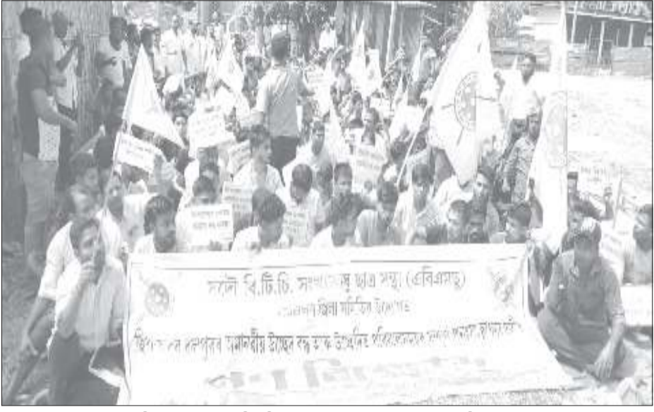
তামুলপুৰৰ কুমাৰীকাটা আন্দোলনীপন্থী গণ্য সংগ্ৰহ কমাণ্ডাৰৰ মুক্তিৰ দাবীত সমদল, গুৰুৱাবাৰে

শিক্ষামন্ত্ৰীলৈ স্মাৰকপত্ৰ অসম চাহ জনজাতি ছাত্ৰ সন্থা বিশ্বনাথ জিলা সমিতিৰ অগ্ৰদূত বাৰ্তা বিশ্বনাথ চাৰিআলি, ২৪ ছেপ্টেম্বৰ : একাংশ ছাত্ৰ-ছাত্ৰীৰ মহাবিদ্যালয় উচ্চতৰ মাধ্যমিক বিদ্যালয়ত নামভৰ্তিৰ ক্ষেত্ৰত উদ্ভৱ হোৱা সমস্যাৰ সন্দৰ্ভত অসম চাহ জনজাতি ছাত্ৰ সন্থা বিশ্বনাথ জিলা সমিতিয়ে স্মাৰকপত্ৰ শিক্ষামন্ত্ৰীলৈ প্ৰেৰণ কৰিছে। সন্থা বিশ্বনাথ জিলা সমিতিয়ে অসমতো কৰ'না অতিসৰীৰ বাবে ছাত্ৰ-ছাত্ৰীসকলৰ হাইস্কুল শিক্ষাত পৰীক্ষা আৰু উচ্চতৰ মাধ্যমিক পৰীক্ষাত অন্তৰ্ভুক্ত কৰিব নোৱাৰি অসম চৰকাৰৰ শিক্ষা বিভাগে সকলো ছাত্ৰ-ছাত্ৰীক এক নিৰ্দিষ্ট নিয়ম বাহিৰে উত্তীৰ্ণ কৰি দিয়াৰ সিদ্ধান্ত গ্ৰহণ কৰে। সেই সিদ্ধান্ত মতে বহু সংখ্যক ছাত্ৰ-ছাত্ৰী উচ্চ মাধ্যমিক আৰু উচ্চতৰ মাধ্যমিক পৰীক্ষাত উত্তীৰ্ণ হয়। কিন্তু বৰ্তমান সেই উত্তীৰ্ণ হোৱা ছাত্ৰ-ছাত্ৰীৰ নামভৰ্তিৰ ক্ষেত্ৰত ব্যাপক অসুবিধাৰ সম্মুখীন হৈছে। যিহেতু বিশ্বনাথ জিলাত একেবোৰে সীমিত সংখ্যক উচ্চ শিক্ষাৰ শিক্ষানুষ্ঠান আছে। মহাবিদ্যালয় আৰু উচ্চ মাধ্যমিক বিদ্যালয়ত সীমিত সংখ্যক আসন থকাৰ বাবে মহাবিদ্যালয় কৰ্তৃপক্ষই সকলো ছাত্ৰ-ছাত্ৰীক নামভৰ্তিৰ সুবিধা প্ৰদান কৰাত বাধা হৈছে। এই ক্ষেত্ৰত বিশেষকৈ চাহ জনগোষ্ঠীৰ ছাত্ৰ-ছাত্ৰীসকল সৰ্বাধিক বঞ্চিত হৈছে। অসম চাহ জনজাতি ছাত্ৰ সন্থাই এই ক্ষেত্ৰত উদ্বোধন প্ৰকাশ কৰিছে, ছাত্ৰ-ছাত্ৰীৰ ভৱিষ্যতক লৈ। সেইবাবে বিষয়টোৰ গুৰুত্ব উপলব্ধি কৰি অতিশীঘ্ৰে মহাবিদ্যালয়সমূহত আসনৰ সংখ্যা বৃদ্ধি কৰিব সকলো ছাত্ৰ-ছাত্ৰীৰ নামভৰ্তিৰ ব্যৱস্থা কৰিবলৈ স্মাৰকপত্ৰ দি ইয়াৰ প্ৰতিলিপি প্ৰেৰণ কৰিছে, বিশ্বনাথ জিলাৰ উপায়ুক্ত, তেজপুৰ লোকসভা সমষ্টিৰ সাংসদৰ লগতে গংগুৰু, বিহালী, বিশ্বনাথ আৰু চতিয়া বিধানসভা সমষ্টিৰ বিধায়কসকলে।