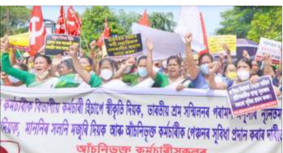
বিভিন্ন দাবীৰ সমৰ্থনত অংগনৱাড়ী কৰ্মী-সহায়িকাৰ প্ৰতিবাদী কাৰ্যসূচী, শুকুৰবাৰে।

মাননিৰ পৰিৱৰ্তে মজুৰি দিয়াৰ দাবী পেঞ্চনৰ ব্যৱস্থা কৰিবলৈ আহ্বান