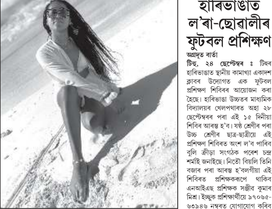
সাগৰতীৰত উচ্ছ্বাস বৃদ্ধি কৰিছে জাপানৰ টেনিছ তাৰকা নাওমি অছাকাই।