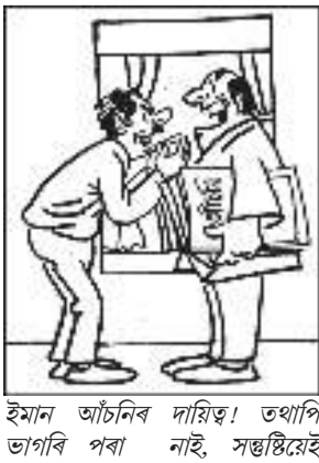
ইমান আচনিৰ দায়িত্ব! তথাপি ভাগৰি পৰা নাই, সন্তোষইে সন্তোষ!