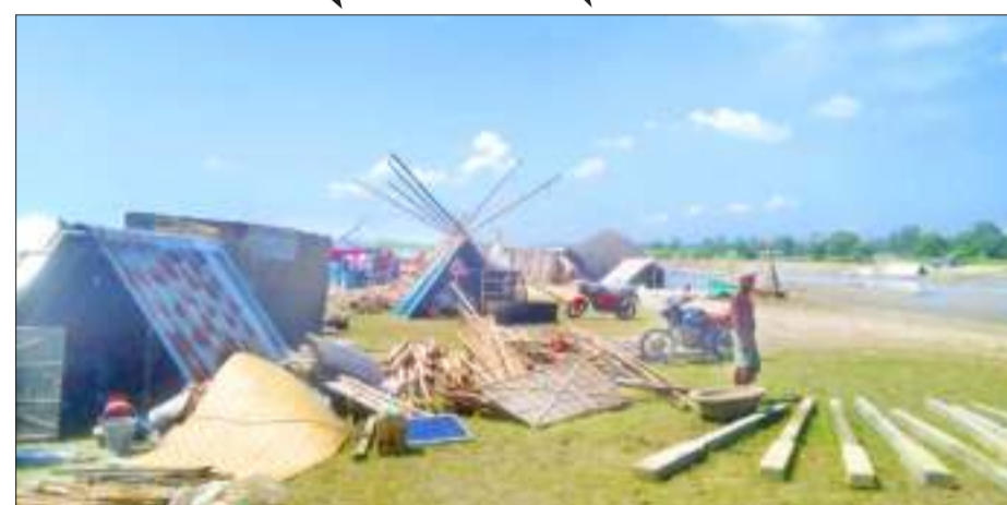
উচ্ছেদ অভিযান আৰু সংঘৰ্ষত বজ্জাত হোৱাৰ পাছত ধলপুৰৰ পৰিবেশ, শুকুৰবাৰে।

প্ৰধানমন্ত্ৰী আৱাসৰ ঘৰো সাজি দিব ■ আমছু নেতৃত্বৰ সৈতে হোৱা কে'বালানি আলোচনাত এই সিদ্ধান্ত গ্ৰহণৰ কথা সদৰী মুখ্যমন্ত্ৰীৰ