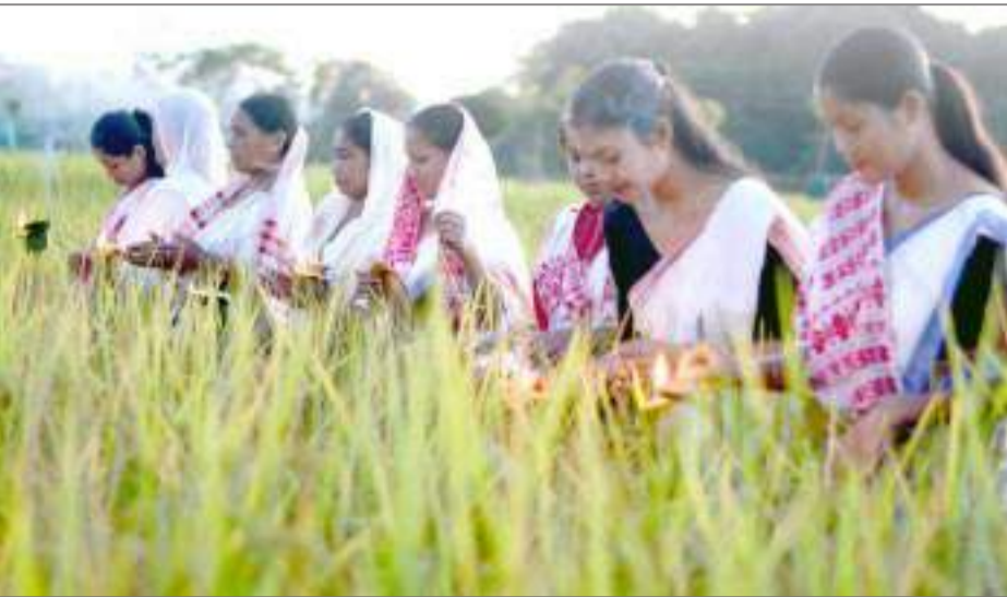
ডিমৌৰ খেতি পথাৰত কাতি বিহ উপলক্ষে বস্তি প্ৰজুলন, সোমবাৰে।

ঔষধ বিক্ৰী কৰি আহিছে। যাৰ ফলত সংশ্লিষ্ট অঞ্চলসমূহত ৰাইজ এতিয়া ভীষণ সমস্যাৰ সম্মুখীন হ'ব লগাত পৰিছে। আচৰিত কথা যে সাধাৰণ জ্বৰ, চৰ্মি, গাৰ বিষ, পেটৰ বিষ, দাঁতৰ বিষ, মূৰৰ বিষ আদি সাধাৰণ বেমাৰতে এতিয়ায় টিক টেবলেট দিয়াৰ ফলত বিপদাপন্ন হৈ পৰিছে বহুতৰে জীৱন। আনকি দুৰ্ঘটনাগ্ৰস্ত লোকক লুপ্ত চেলোৱাৰো গুৰুতৰ অভিযোগ উঠিছে। এই ক্ষেত্ৰত স্বাস্থ্য বিভাগ অথবা ড্ৰাগছ পৰিদৰ্শকে নীৰৱ ভূমিকা পালন কৰি অহা পৰিলক্ষিত হৈছে। বিশেষকৈ নেপৰীয়া অঞ্চলৰ অজ্ঞাৰ সুযোগ লৈ মাটখলা বজাৰত এনে অনুজ্ঞাপত্ৰবিহীন ফাৰ্মাচী অথবা মুন্না ভাই এমবিবিএছে চিকিৎসা প্ৰদানৰ নামত অধিক মুনাফা লুটি অহাৰ ফলত দুৰ্বিহাৰ হৈ পৰিছে বহুতৰে জীৱন। এই ক্ষেত্ৰত অতি শীঘ্ৰেই বিহিত ব্যৱস্থা গ্ৰহণৰ বাবে স্থানীয় ৰাইজে সংশ্লিষ্ট কৰ্তৃপক্ষৰ ওচৰত দাবী জনাইছে।