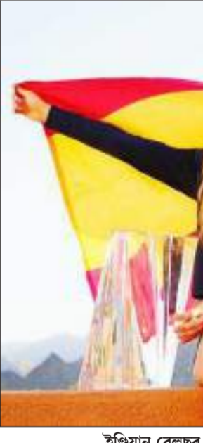
ইণ্ডিয়ান বেলছৰ খিতাপ লৈ বডোছ।