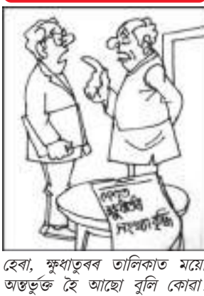
হেৰা, ফুফাতুৰ তালিকাত ময়ো অন্তৰ্ভুক্ত হৈ আহে বুলি কোৱা! মোৰ কেৱল ধন-ক্ষমতাৰ ফুফা!