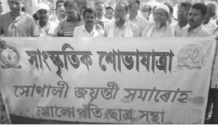
আলোপতি ছাত্ৰ সত্ৰৰ সোণালী জয়ন্তীৰ উপলক্ষে উলিওৱা সাংস্কৃতিক শোভাযাত্ৰা, সোমবাৰে।