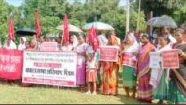
অগ্ৰদূত বাৰ্তা মাটিয়া, ৬ অক্টোবৰঃ বিকল্প ব্যৱস্থা অহিবনে সকলো প্ৰকাৰৰ উচ্ছেদ বন্ধ, উচ্ছেদিতসকলক ক্ষতিপূৰণ তথা পুনৰ সংস্থাপনৰ দাবীত আৰু উত্তৰ প্ৰদেশৰ কৃষক হতাৰাৰ প্ৰতিবাদত গোৱালপাৰা জিলাৰ বাৰ্হাৰী মিলনপাৰাত আজি কৃষক সভাই প্ৰতিবাদী কাৰ্যসূচী ৰূপায়ণ কৰে।