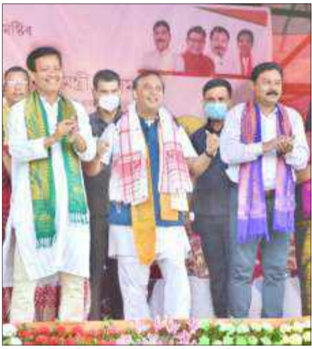
সোৱে-বাবে মন্ত্ৰীক লৈ নাতি-বাগি মুখ্যমন্ত্ৰীৰ নিৰ্বাচনী প্ৰচাৰ, বৃহস্পতি।

শাসক আৰু বিৰোধীয়ে যদি পৰস্পৰৰ কাৰণ বিৰোধিতা নকৰেই তেন্তে কিহৰ প্ৰচাৰ হ'ল।