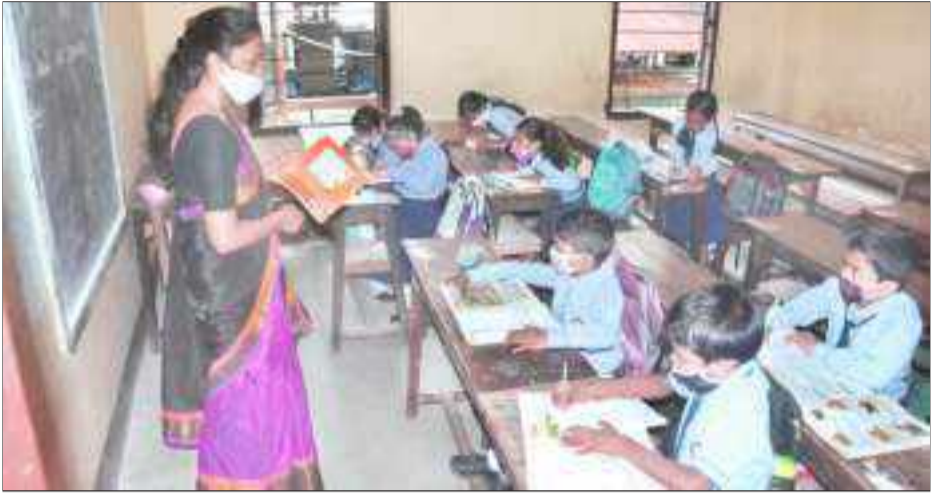
ক'ভিড নিয়ম পালন কৰি পুনৰ খুলিল প্ৰাথমিক বিদ্যালয়, মহানগৰীত বুধবাৰে।