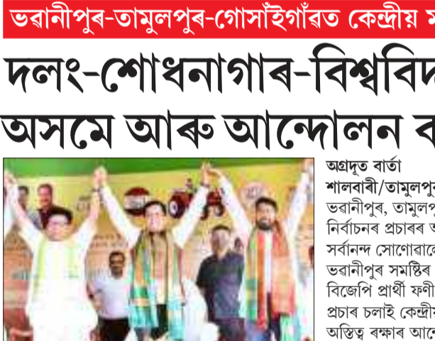
নিৰ্বাচনী আচৰণ বিধি-ক'ভিড-১৯ বিধি উলংঘা