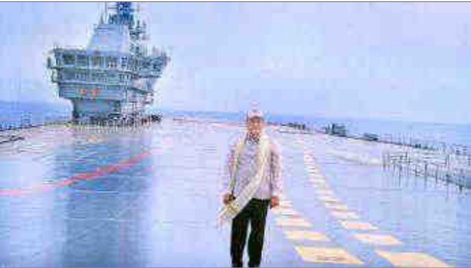
ভাৰতৰ প্ৰথমখন থলুৱা বিমান বাহক পৰিদৰ্শন কেন্দ্ৰীয় মন্ত্ৰী সৰ্বানন্দ সোণোৱালৰ।