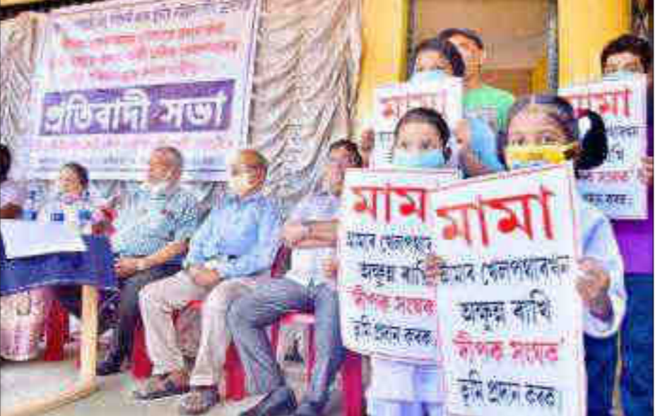
মহানগৰীৰ শিলপুখুৰী খেলপথাৰ অধিগ্ৰহণৰ সিদ্ধান্ত প্ৰত্যাহাৰ কৰি ইয়াক স্থানীয় লীপক সংঘলৈ হস্তান্তৰৰ বাবে মুখামুখীলৈ আহবন্দন ৰাজহুৱা সভাৰ, দেওবাৰে।

মন মুহিছে। তেওঁ ভাল কবিতা লিখাৰ লগতে ভাল ঘোষকো। তেওঁৰ কবিতা কাকতত প্ৰকাশ পাইছে। তেনেদৰে আমাৰ শিক্ষানুষ্ঠানত পঢ়ি থকা বহু ছাত্ৰই খুব কষ্টেৰে নিজৰ পঢ়া-শুনা অব্যাহত ৰাখিছে। তেওঁলোকৰ ঘৰৰ অৱস্থা অতিকৈ শোচনীয়। সেয়ে তেওঁলোককো দেখা দিব নোৱাৰি; কিন্তু তাৰ মাজতো তেওঁলোকে যেনেদৰে মন লগাই পঢ়ে তাৰ বাবে আমি শিক্ষকসকল মাজে মাজে আচৰিত হওঁ। তদুপৰি সীমিত সুবিধাৰ মাজতে আমি তেওঁলোকক পাঠদান কৰি আহো। আওপুৰণি শ্ৰেণীকোটা, গৃহতে ছাত্ৰসকলে পাঠগ্ৰহণ কৰি আহিছে। ছাত্ৰৰ অনুপাতে শ্ৰেণীকোটা বৃদ্ধি পোৱা নাই। তদুপৰি শিক্ষকৰ কিছু অভাৱ আছে। উচ্চতৰ মাধ্যমিকৰ বিষয় শিক্ষকৰ দুটা পৰ আৰু চতুৰ্থৰ্গৰ কৰ্মচাৰীৰ তিনিটা, উচ্চ প্ৰাথমিকৰ তিনিটা পদ খালী হৈ আছে। তাৰ মাজতে আমি যিমান পালে শিক্ষানুষ্ঠানখনৰ পূৰ্বৰ ঐতিহ্য ঘূৰাই আনিবলৈ অৱহৰ চেষ্টা অব্যাহত ৰাখিছো। কিন্তু এই ক্ষেত্ৰত কেৱল আমাৰেই নহয় বৰফ চৰকাৰ তথা সচেতন ৰাইজৰ সহায়ৰো প্ৰয়োজন হ'ব।