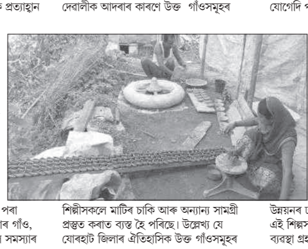
শিল্পীসকলে মাটিৰ চাকি আৰু অন্যান্য সামগ্ৰী প্ৰস্তুত কৰাত ব্যস্ত হৈ পৰিছে। উল্লেখ্য যে যোৰহাট জিলাৰ ঐতিহাসিক উক্ত গাঁওসমূহৰ

অগ্ৰদূত বাৰ্তা টায়ক, ৩১ অক্টোবৰ : চীনৰ সামগ্ৰীক প্ৰত্যাহ্বান সন্মুখীন হ'বলগীয়া হৈছে। সমস্যাৰ মাজতো যোগেদি পৰিয়াল পোহপাল দি আহিছিল যদিও বৰ্তমান আধুনিক প্ৰযুক্তি কৌশলৰ অভাৱে তেওঁলোকক অসুবিধাত পেলাইছে। অধিকাংশ পৰিয়াল আৰ্থিকভাৱে স্বচ্ছল নোহোৱাৰ বাবে উন্নত প্ৰযুক্তি কৌশলৰ যোগেদি দীৰ্ঘম্যাদী আচৰিৰে শিল্পটোক জীয়াই ৰাখিবলৈ ব্যৰ্থ হৈছে। মৃৎ শিল্পীসকলে কঠোৰ কেঁচা সামগ্ৰী দূৰৈৰ পৰা কঢ়িয়াই আনিবলগীয়া হয়। বিক্ৰী কৰা সামগ্ৰীৰ উপযুক্ত মূল্যও নাপায় বুলিও তেওঁলোকে ব্যক্ত কৰিছে। একেদৰে ৰজাৰিয়া অনীহাৰ বাবে এই শিল্পটো সংকটত সন্মুখীন হৈছে।