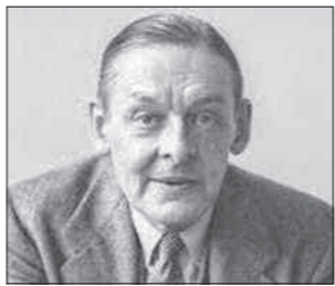
টি এছ এলিয়ট

সাংস্কৃতিক কালত অনুবাদ সাহিত্যৰ গুৰুত্ব বৃদ্ধি পাইছে। সাহিত্য-সংস্কৃতিৰ ক্ষেত্ৰখনৰ লগত জড়িত লোকে নিজৰ ভাষা-সাহিত্যৰ লগতে আন দেশৰ ভাষা-সাহিত্যৰ ক্ষেত্ৰত কি সৃষ্টি হৈ আছে তাক জানিব বিচাৰে। এজন মানুহৰ বাবে পৃথিৱীৰ সকলো ভাষা শিক্ষা সম্ভৱ নহয়। সেই বাবেই আমি অনুবাদৰ ওপৰত নিৰ্ভৰ কৰো। কেতিয়াবা একোখন কিতাপ একাধিক ভাষাৰ মাজেদি অনূদিত হৈ আহি আমাৰ ভাষা পায়হি। সাংস্কৃতিক অনুবাদ অধ্যয়নৰ মতে আমি মৌলিক বুলি ভবা কথা এটাও অনুবাদৰ অনুবাদৰ অনুবাদ হ'ব পাৰে। অনুবাদ অধ্যয়নে আৰু কয় যে অনুবাদেই মূলৰ সৃষ্টি কৰে। কিতাপখন যিবোলা এটা ভাষালৈ অনুবাদ হোৱাৰ পাছতহে মূল ভাষাৰ প্ৰশ্নটো উত্থাপিত হয়। সাংস্কৃতিক অনুবাদ অধ্যয়নত অনুবাদ এটাক ভাল বা বেয়া বোলাতকৈ অনুবাদকৰ কৌশলৰ ওপৰতহে অধিক গুৰুত্ব দিয়া হয়। অনুবাদ কৰাৰ কাৰণে কৰা হৈছে, লক্ষ্যভাষাৰ পাঠক কোন, লক্ষ্য ভাষাৰ পাঠক একাধিক নে উৎসভাষাৰ পাঠকো মূল ভাষাত গৈ দৰকাৰ হ'লে পঢ়িব পাৰিব ইত্যাদি অনেক কথা অনুবাদকৰ কৌশলৰ মাজলৈ সোমাই আছে। পঢ়িতো পঢ়িতো কৰাৰণে কৰা অনুবাদ সাধাৰণ একভাষিক লক্ষ্য পাঠকৰ কাৰণে কৰা অনুবাদৰ পৰা নিশ্চয় সূকীয়া হ'ব।