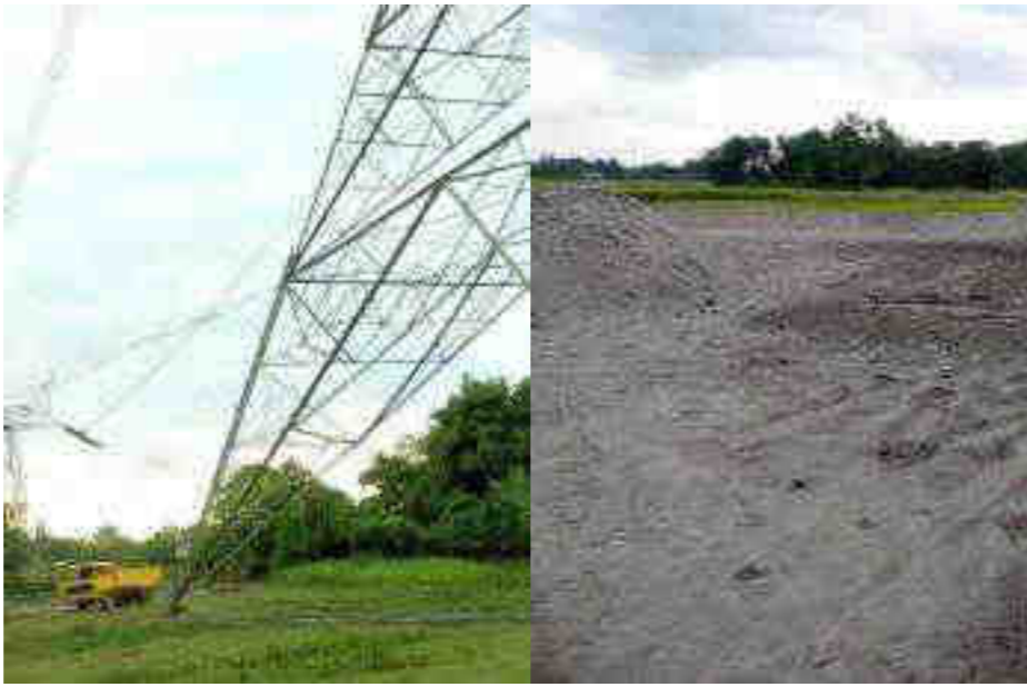
চলাচলৰ বাবে মাজুলী জিলা প্ৰশাসনৰ চৰ্ত সাপেক্ষে অনুমতি

অগ্ৰদূত বাৰ্তা তেজপুৰ, ৩১ অক্টোবৰ : কৃষি, বন বিভাগৰ লগতে ভূমিসংৰক্ষণ বিভাগৰ গাফিলতি তথা প্ৰশাসনৰ নিৰ্লিপ্ত ভূমিকাৰ বাবে তেজপুৰ আৰু কাৰ্বীয়া অঞ্চলত অব্যাহত আছে অবৈধ বালি খনন। তেজপুৰৰ ডালুককাৰণি, যুগলনি, বিহিয়াগাঁও আদিত ব্যাপক ৰূপত মাটি আৰু বালি খনন চলি থকাৰ বিপৰীতে নিকটৱৰ্তী বৌমাৰী, মানশিৰি আদিত জৰে-মধে বালিৰ খনন চলিছে। উল্লেখ্য যে তেজপুৰৰ বিহিয়াগাঁও আৰু ডালুককাৰণিত এই অবৈধ খননে এক মহলৰ ৰূপ লৈছে। বিহিয়াগাঁওত জীয়াৰলীৰ পাৰত পূৰ্বাৰে পৰাই দিনটো এন্ড্ৰাভেটৰেৰে চলোৱা খননে কাৰ্বীয়া অঞ্চলৰ বাবেই বিপদ কঢ়িয়াই আনিছে। বৰ্তমান এই অঞ্চলত জীয়াৰলীৰ বুকুৰ পৰা শিলো সংগ্ৰহ কৰাত নামি পৰিছে