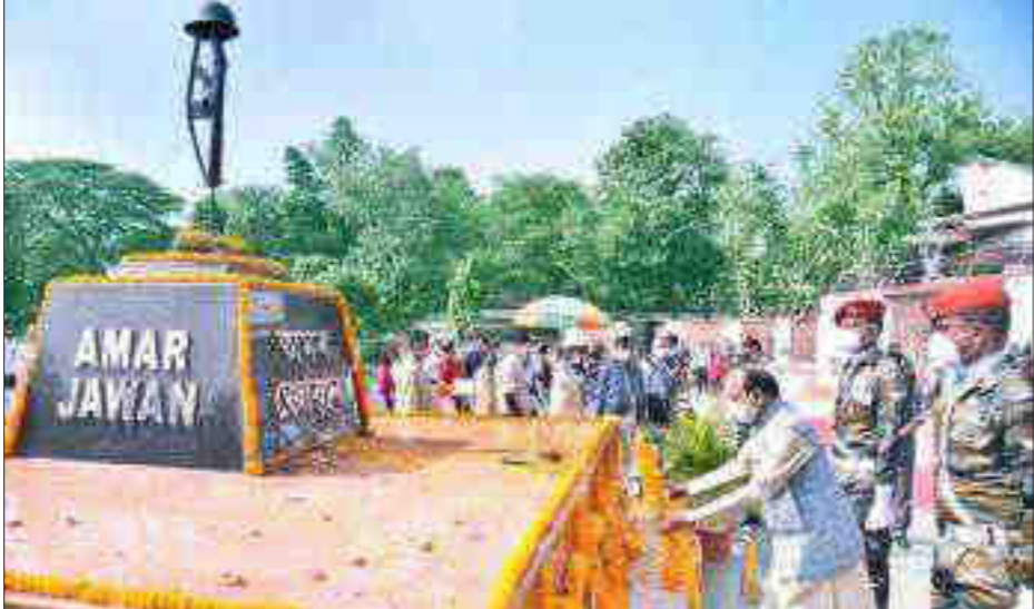
জন সহায় উৎসৱ উপলক্ষে যুদ্ধ স্মাৰকত শ্ৰদ্ধাঞ্জলি বাজাপাল জগদীশ মুখাৰ, মহানগৰীত দেখোবো।