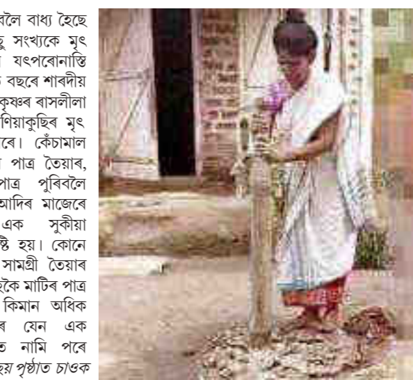
চলোৱা আদি কামত ধৰিবলৈ বাধ্য হৈছে। অৱশ্যে এতিয়াও কিছু সংখ্যক মৃৎ শিল্পক জীয়াই ৰাখিবলৈ যত্নবোনাতি চেষ্টা চলাই আহিছে। প্ৰতি বছৰে শাৰদীয়া বতৰত দীপাৱলী আৰু শ্ৰীকৃষ্ণৰ বাসলীলা উৎসৱৰ আগে আগে বনিয়াকুছিৰ মৃৎ শিল্পীসকল ব্যস্ত হৈ পৰে। কেঁচামাল সংগ্ৰহ, ঘৰে ঘৰে মাটিৰ পাত্ৰ তৈয়াৰ, সমূহীয়াভাৱে মাটিৰ পাত্ৰ পৰিবলৈ ডাঙতি জুই দিয়া পৰ্ব আদিৰ মাজেৰে গাঁওবাসীৰ মাজত এক সুকীয়া উৎসৱমুখৰ পৰিবেশ সৃষ্টি হয়। কোনো কোনো সুন্দৰকৈ মাটিৰ সামগ্ৰী তৈয়াৰ কৰিব, কোনো কিমান সৰহকৈ মাটিৰ পাত্ৰ সাজি উলিয়াব, কোনো কিমান অধিক উপাৰ্জন কৰিব আদিৰ যেন এক অৰ্থনৈতিক প্ৰতিযোগিতাত নামি পৰে গাঁওবাসী। কাৰণ ছয় পৃষ্ঠাত চাওক

অগ্ৰদূত বাৰ্তা টিহু, ৩১ অক্টোবৰ : টিহু অঞ্চলৰ এখন আৰ্থিকভাৱে অনগ্ৰসৰ গাঁও বনিয়াকুছি। গাঁওখনৰ প্ৰায় ৬০ টা পৰিয়ালে আপুৰুগীয়া মৃৎ শিল্পৰ লগত জড়িত থাকি জীৱন-জীৱিকা বৰ্তাই ৰাখিছিল। এই শিল্পীসকলৰ সুন্দৰ হাতৰ পৰম্পৰা সৃষ্টি হৈছিল অসমীয়া সমাজত ব্যৱহৃত চাকি, চক, কলাহ, কৌলি, কুমৰচক, টো, ধূপদানি আদি বিভিন্ন সুন্দৰ সুন্দৰ মাটিৰ বাচন। এই মাটিৰ সামগ্ৰীসমূহ বৃহত্তৰ বাগুসা নলবাৰী বজাৰী অঞ্চলৰ বিভিন্ন প্ৰান্তত বিক্ৰী কৰি দুপহিচা অৰ্জন কৰি পেটাৰ ভাত মোকলাইছিল বনিয়াকুছিৰ মৃৎ শিল্পীসকলে। অসমীয়া সমাজৰ নৈৰ্দ্দীন জীৱনত অতি দৰকাৰী আৰু উৎসৱ পাৰ্বনত পৰিচিহ্ন হিচাপে ব্যৱহৃত এই আটকখুন্দীয়া মাটিৰ সামগ্ৰীসমূহ নিৰ্মাণ কৰি দীৰ্ঘদিন অতি কষ্টেৰে মৃৎ শিল্পক জীয়াই ৰখাৰ লগতে টিহু-বজাৰী-বাগুসা অঞ্চলৰ লগতে কিছু পৰিমাণে অন্য ঠাইৰ ৰাইজৰো চাহিদা পূৰণ কৰি আহিছে। কিন্তু অসমীয়া সমাজৰ গ্ৰাম্য অৰ্থনীতিত প্ৰভাৱ পেলোৱা এই মাটিৰ সামগ্ৰী সম্প্ৰতি বনিয়াকুছিৰ বনিয়াকুছিৰ পৰম্পৰা গতি কৰিছে। অসমীয়া সমাজৰ তথাকথিত আধুনিক ধামখুন্দীয়াত লুপ্তপ্ৰায় হোৱাৰ পথত বনিয়াকুছিৰ মৃৎ শিল্প। এই শিল্পীসকলৰ জীৱিকাৰ আধাৰৰূপক মৃৎ শিল্প সম্পূৰ্ণৰূপে বন্ধ হৈ পৰাৰ উপক্ৰম হোৱাত এওঁলোকৰ ভৱিষ্যত জীৱনলৈ অনিশ্চয়তা আহি পৰিছে। অঞ্চলটোৰ বহু মৃৎ শিল্পীয়ে বৰ্তমান অম-বন্ধৰ তাড়নাত মাটিৰ সামগ্ৰী নিৰ্মাণ কাৰ্য পৰিত্যাগ কৰি দিন মজুৰি কৰা, ইটা ভাটাৰ শ্ৰমিক, ট্ৰেলা-বিগ্ৰা