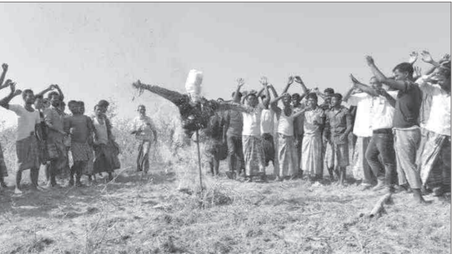
কলগাছিয়াৰ কৃষি পথাৰতে কৃষি মন্ত্ৰীৰ পুতলিকা দাহ, দেওবাৰে।