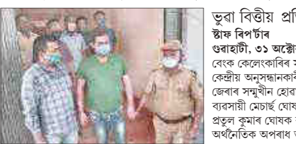
ভূৱা বিত্তীয় প্ৰতিষ্ঠানৰ নামত ৭৫ লাখ আত্মসাৎৰ গোচৰতো হ'ব গ্ৰেপ্তাৰ

আইডিবিআই বেংকৰ এক কোটি ১০ লাখ আত্মসাৎ ■ কৃষি-দুগ্ধ উন্নয়নৰ নামত ঋণ লৈছিল বেংকক প্ৰবঞ্চনা : ঘোষ ব্ৰাদাৰ্ছৰ মালিকক গ্ৰেপ্তাৰ