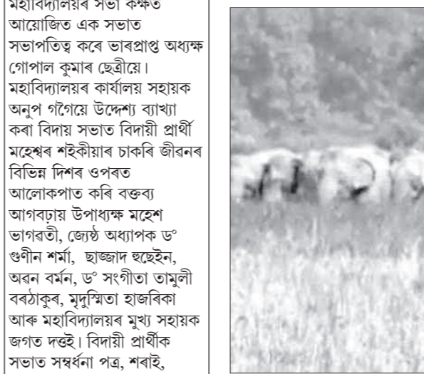
গোৱালপাৰাত বনাইহুতীয়ে নষ্ট কৰিলে কৃষিভূমি, দেওবাৰে।