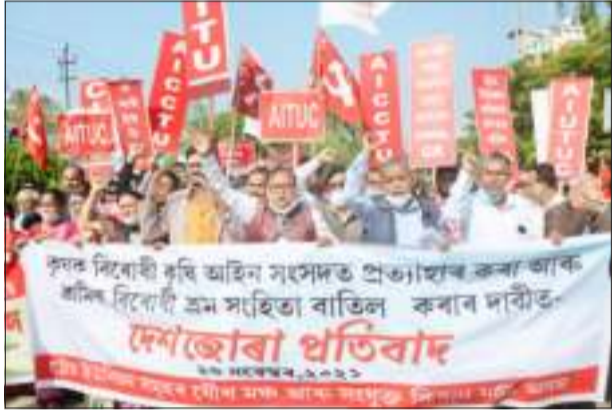
শ্ৰমিক বিৰোধী নীতি বাতিলৰ দাবীত ট্ৰেড ইউনিয়নৰ প্ৰতিবাদ।