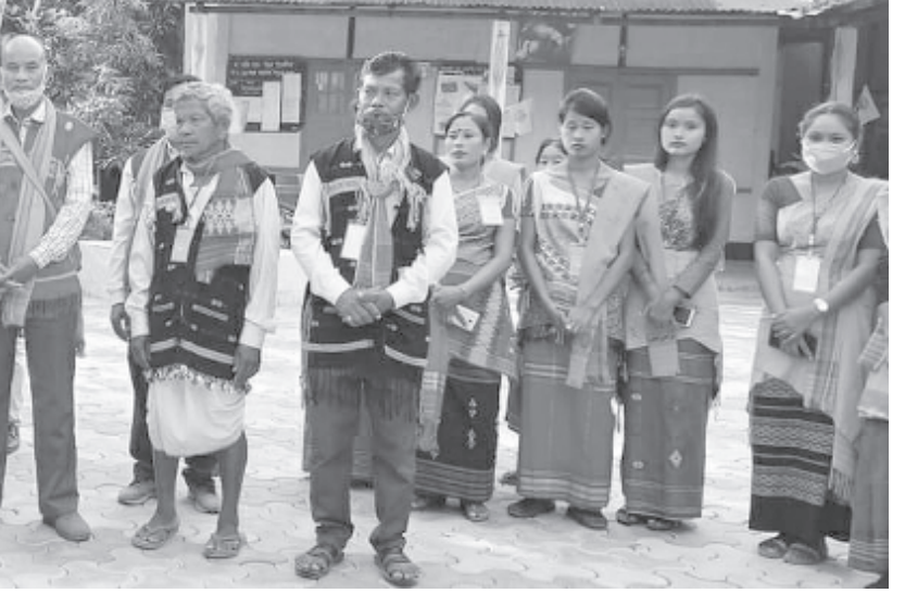
সোণাপুৰত কামৰূপ জিলা তিৱা সাহিত্য সভাৰ অধিবেশন, শনিবাৰে।