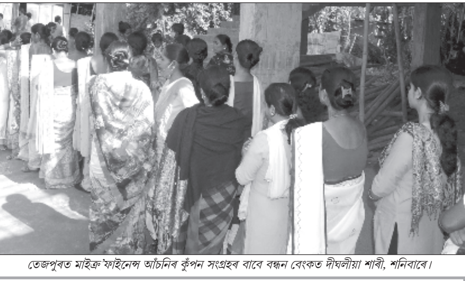
তেজপুৰত মাইক্ৰ’ফাইনেল আঁচনিৰ কুঁপন সংগ্ৰহৰ বাবে বন্ধন বেংকত দীঘলীয়া শাৰী, শনিবাৰে।