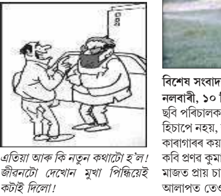
এতিয়া আৰু কি নতুন কথাটো হ'ল! জীৱনটো দেখোন মুখা পিছিয়েই কটাই দিলো!