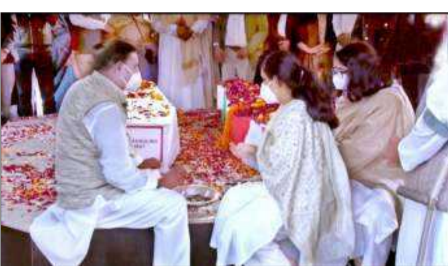
সৰ্বাধিনায়ক বিপিন ৰাৱট আৰু পত্নীৰ শব্দেহত অন্তিম শ্ৰদ্ধা জপান দুই কন্যা, নতুন দিল্লীত শুকুৰবাৰে।