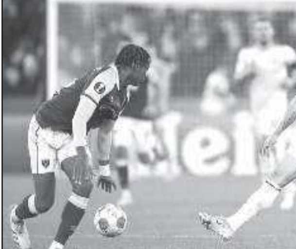
ইউৰোপা লীগত ডায়নাম' জাগ্ৰেব আৰু বেস্ত হামৰ মাজৰ খেলৰ এটি মুহূৰ্ত, বৃহস্পতিবাৰে।