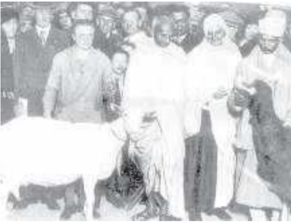
১৯৩১ত লণ্ডনৰ এখন পত্ৰমেলাত বগা ছাগলী এজনীৰ স’তে গান্ধীজী

সৌৰাষ্ট্ৰ উপকূলত অৱস্থিত পোৰবন্দৰ চহৰৰ দেৱান কৰম চাঁদ গান্ধী আৰু পত্নী পূতলী বাইৰ নুমলীয়া সন্তান মোহনদাসক দেশৰ পৰমপূৰ্ব মানি ১৩ বছৰ পূৰ নৌহওঁতেই সমবয়সীয়া কল্পৰ মাজলি কাপাডিয়া নামৰ কন্যাটিৰ লগত বিবাহ সম্পন্ন কৰা হৈছিল। “প্ৰথম স্মৃতিৰ মোহনে কোনোবাৰিনা লগনত উচ্চ শিক্ষা ল’ব পাৰিব” বুলি কৰা পিতৃৰ মন্তব্যৰ পাছত যেতিয়া পিতৃ কৰমচাঁদৰ দেহাৱলন হ’ল, তেতিয়া পিতৃ বাৰু কাৰ্যত পৰিত্যক্ত বৰিবলৈ মাতৃ পূতলী বাই সাজু হ’ল। কিন্তু তেওঁলোকৰ মধ্য সম্প্ৰদায়ৰ আত্মীয়সকলে মোহন লগুণলৈ যোগাৰ বিময়ত অনেক বাধা বিধিনি আৰোপ কৰিলে। মোহনৰ লগলৈ যোৱা প্ৰচণ্ড আত্ৰহ দেখি মাতৃ পূতলী বায়ে তেওঁক বিদেশত মদ-মাংসৰ লগে নাৰীৰ সম্পৰ্কৰ পৰা আতৰি থাকিবলৈ শপত কৰিলে। এবাৰ সিদ্ধান্ত লোৱাৰ পাছত মোহনে কিত্তি সেই সিদ্ধান্ত এৰি দিয়া বিধৰ ব্যক্তি নাছিল। সকলো বাধা অতিক্ৰম কৰি ১৮৮৮ৰ ছেপ্টেম্বৰত মোহনে