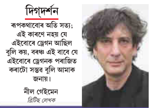
নীল গৌহ্মেন ব্ৰিটিছ লেখক ৰূপকথাবোৰ অতি সত্য; এই কাণেৰে নহয় যে এইবোৰে ড্ৰেগন আছিল বুলি কয়, বৰষুণ এই বাবে যে এইবোৰে ড্ৰেগনক পৰাজিত কৰাটো সম্ভৱ বুলি আমাক জনায়।