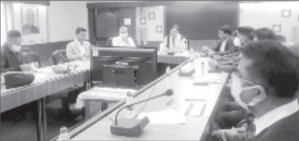
সম্পৰ্কত জিলা স্বাস্থ্য বিভাগৰ উৰফ্ৰফ পৰা এখন সচিব উপস্থাপন কৰে। মুখ্য সচিবজনে স্বাস্থ্য বিভাগৰ লগতে জিলা প্ৰশাসনক