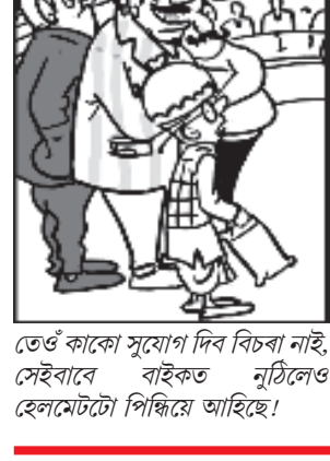
তেওঁ কাকো সুযোগ দিব বিচৰা নাই, সেইবাবে বাইকত নুঠিলেও হেলমেটটো পিন্ধিছে আছিল।