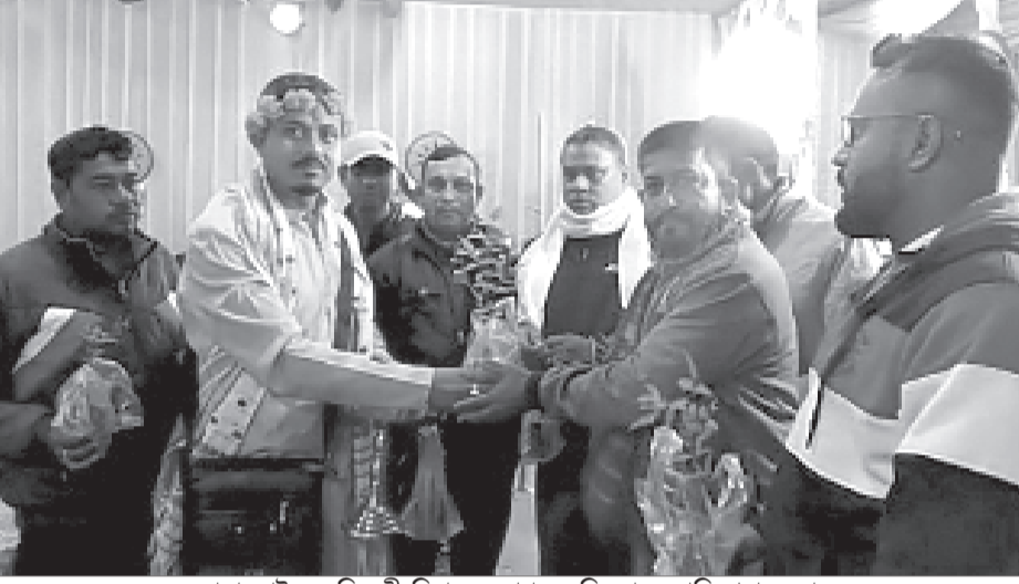
বাহাৰঘাটত ব্যতিক্ৰমী বিয়া। অজাগতক নিম গছৰ পুলি প্ৰদান দৰাৰ।