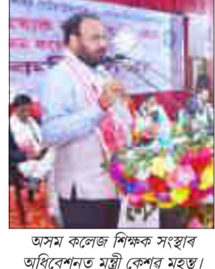
অসম কলেজ শিক্ষক সংস্থাৰ অধিবেশনত মন্ত্ৰী কেশৱ মহন্ত।

ষ্টাফ ৰিপ'ৰ্টাৰ গুৱাহাটী, ১৪ ডিচেম্বৰ : ক'ভিড ১৯ৰ ব্যাপক সংক্ৰমণৰ গভীৰ আশংকাত ভূগিছে গুৱাহাটী বিশ্ববিদ্যালয়ৰ পৰিয়াল। বিশ্ববিদ্যালয় সপ্তাহ চলি থকাৰ মাজতে ১০ পৃষ্ঠাত চাওক