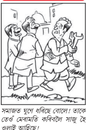
সমাজত ঘূৰে ধৰিছে বোলে! তাকে তেওঁ মেৰামতি কৰিবলৈ সাজু হৈ ওলাই আহিছে!