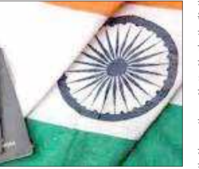
তাগ কৰিলে। সদনত দেশত ৰাষ্ট্ৰীয় নাগৰিকপঞ্জী (এন আৰ চি) প্ৰবৰ্তনৰ সন্দৰ্ভত চৰকাৰৰ স্থিতি দাঙি ধৰি মন্ত্ৰীয়ে কয়।

লগতে কয় যে বৈদেশিক মন্ত্ৰণালয়ৰ হাতত উপলব্ধ তথ্য অনুসৰি মুঠ ১,৩৩,৮৩,৭১৮ জন ভাৰতীয় নাগৰিক বৰ্তমানে বিদেশত আছে। সদনত এক লিখিত প্ৰশ্নৰ উত্তৰ দি গৃহ ৰাজ্যমন্ত্ৰীয়ে কয় যে ২০১৭ বৰ্ষত ১,৩৩,০৪৯ ভাৰতীয়ই নাগৰিকত্ব ত্যাগ কৰিছিল। ২০১৮ বৰ্ষত ১,৩৪,৫৬১ জন, ২০১৯ত ১,৪৪,০১৭ জন, ২০২০ত ৮৫,২৪৮ জন আৰু চলিত বৰ্ষত ৩০ ছেপ্টেম্বৰলৈকে ১,১১,২৮৭ জন ভাৰতীয়ই নিজৰ নাগৰিকত্ব