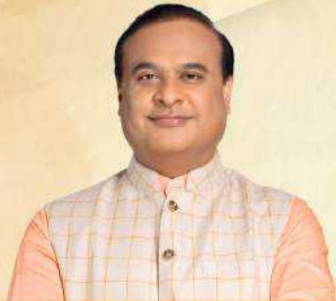
Dr. Himanta Biswa Sarma Hon'ble Chief Minister, Assam