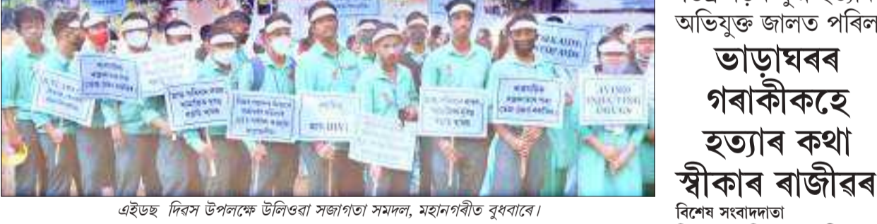
এইডছ দিবস উপলক্ষে উলিওৱা সজাগতা সমদল, মহানগৰীত বুধবাৰে।

■ নলবাৰী মেডিকেল কলেজত ২০২৩ৰ পৰাই আৰম্ভ হ'ব পাঠদান ■ বেয়া কাম কৰিলে ক'লা আপা, বগা আপা সকলো একে হৈ যায়! শৰ্মা অগ্ৰদূত বাৰ্তা নলবাৰী/ঘৰাপাৰ/বাহাৰঘাট, ১ ডিচেম্বৰ : 'অসমত সংঘটিত যিকোনো অপৰাধমূলক কাৰ্য আৰু ইয়াৰ স'তে জড়িত অপৰাধীক নিৰ্মূল কৰা হ'ব। মোৰ মুখ্যমন্ত্ৰীত্বৰ কালত অসমৰ ৰাইজে শান্তিৰে বসবাস কৰিব পাৰিব।' এই মন্তব্য মুখ্যমন্ত্ৰী ড° হিমন্ত বিশ্ব শৰ্মাৰ। নলবাৰী জিলাৰ ঘৰাপাৰৰ দক্ষিণগাঁৱত নলবাৰী চিকিৎসা মহাবিদ্যালয়ৰ নিৰ্মাণ কাৰ্যৰ বুজ লৈ আজি আবেলি মুখ্যমন্ত্ৰীয়ে সংবাদ মাধ্যমৰ আগত এইদৰে কয়। অসমত হত্যা, হিংসা, লুণ্ঠন, যিকোনো দ্বিগুণকৈ তথা লালালিত জড়িত সকলো অপৰাধীক নিৰ্মূল কৰি অসমখন শান্তিপূৰ্ণ ৰাজ্যৰূপে গঢ়ি তোলা হ'ব বুলি তেওঁ সোহোৰে। ৰাজ্যজুৰি প্ৰতিক্ৰিয়াৰ সৃষ্টি কৰা যোৰহাট কাণ্ডৰ সম্পৰ্কত প্ৰতিক্ৰিয়া ব্যক্ত কৰি মুখ্যমন্ত্ৰী ড° শৰ্মাই কয়, 'বেয়া কাম কৰিলে ক'লা আপা, বগা আপা সকলো একে হৈ ১০ পৃষ্ঠাত চাওক