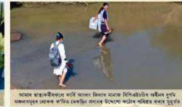
আমাৰ স্বাস্থ্যকৰ্মীসকলে কাৰি আলো জিলাৰ মানাজ বিপিএইচডিৰ অৰীমৰ দুৰ্গম অঞ্চলসমূহৰ লোকক ক’ভিড ভেকছিন প্ৰদানৰ উদ্দেশ্যে কঠোৰ পৰিশ্ৰম কৰাৰ মুহূৰ্ত