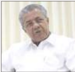
টিকা নল'লে কেৰালাত বিনামূলীয়া নহ'ব কৰ'নাৰ চিকিৎসা

বিচাৰি আবেদন দাখিল কৰা লোকসকলৰ ৭৭৮২ জন পাকিস্তানৰ, ৭৯৫ জন আফগানিস্তানৰ, ২২৭ জন আমেৰিকাৰ আৰু ১৮৪ জন বাংলাদেশৰ আবেদনকাৰী। ২০১৬ বৰ্ষত ১১০৬ জন লোক ভাৰতীয় নাগৰিকত্ব প্ৰদান কৰা হৈছিল। ২০১৭ত ৮১৭ জন, ২০১৮ বৰ্ষত ৬২৮ জন, ২০১৯ বৰ্ষত ৯৮৭ জন আৰু ২০২০ বৰ্ষত ৬৩৯ জন লোক ভাৰতীয় নাগৰিকত্ব প্ৰদান কৰা হৈছিল বুলি কেন্দ্ৰীয় গৃহ ৰাজ্যমন্ত্ৰীয়ে সদনক অৱগত কৰে।