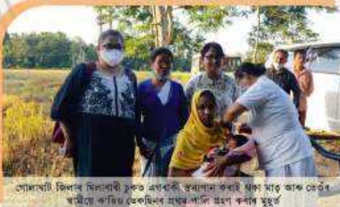
গোলাঘাট জিলাৰ মিনাখাৰী চুকত এগৰাকী কৃষিকাৰীক বৰাই ঘূৰা মাতৃ আৰু তেওঁৰ সান্নিধ্য কৰি ভেকছিনৰ প্ৰথম পালি গ্ৰহণ কৰাৰ মুহূৰ্ত