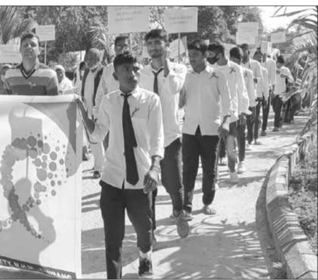
কাজলগাঁৱত বিশ্ব এইডছ দিৱস উপলক্ষে উলিবেটা সজাগতা সমাদল, বুধবাৰে।