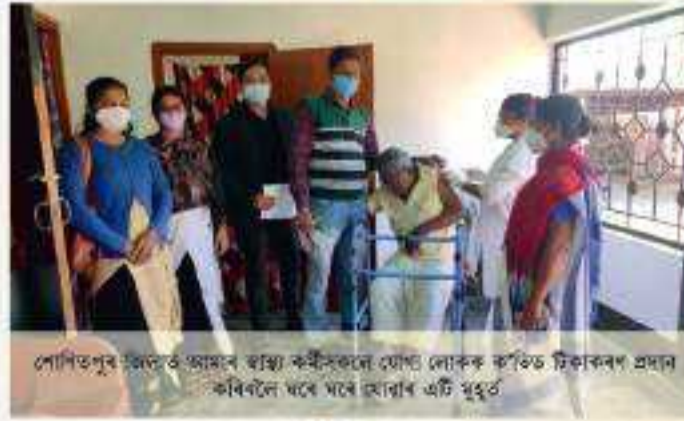
শোণিতপুৰ (মত) আমাৰ স্বাস্থ্যকৰ্মীসকলে যোগা লোকক ক’ভিড টিকাকৰণ প্ৰদান কৰিবলৈ ঘৰে ঘৰে মোৰাৰ এটা মুহূৰ্ত