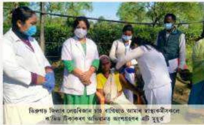
ডিব্ৰুগড় জিলাৰ দেউৰিমান চাই পলিছাত আমাৰ স্বাস্থ্যকৰ্মীসকলে ক’ভিড টিকাকৰণ অভিযানত অংশগ্ৰহণ কৰাৰ মুহূৰ্ত