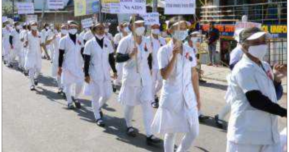
তেজপুৰত বিশ্ব এইডছ দিবস উপলক্ষে সজাগতামূলক সমাল, বুধবাৰে।