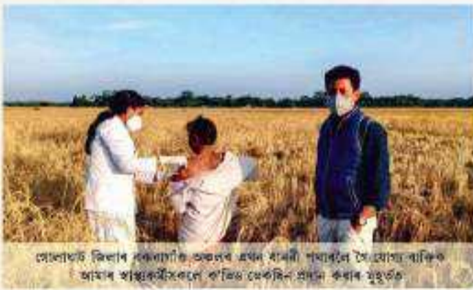
সোণাইত জিলাৰ কেৰাণীত অক্ষয়ৰ এখন ধানী পথাৰলৈ সৈন্যসহ ব্যক্তিগত আমাৰ স্বাস্থ্যকৰ্মীসকলে ক’ভিড ভেকছিন প্ৰদান কৰাৰ মুহূৰ্ত