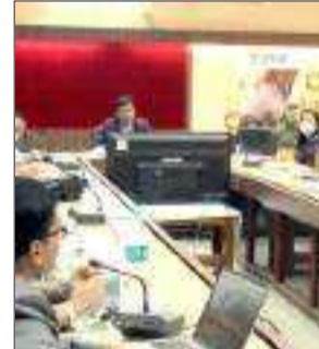
তুলি লোৱা অভিভাৱকে অংশগ্ৰহণ কৰে। প্ৰতিগৰাকী অভিভাৱকে নিজৰ মনৰ কথা বিৱৰি কয় আৰু সন্তান লাভ কৰি জিলা প্ৰশাসন তথা