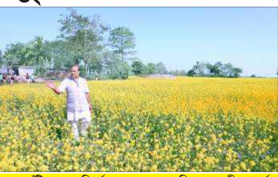
■ গৰুখুটি প্ৰকল্প পৰিদৰ্শন : প্ৰকল্পৰ আধাৰশিলা মুখ্যমন্ত্ৰী ড° শৰ্মাৰ

■ চাকৰিৰ হাৰাখুৰি খোৱাতকৈ কৃষি কাৰ্যত মনোনিৱেশ কৰিব লাগিব ■ মোগলক ১৭ বাৰ পৰাভূত কৰা হাত ■ গৌৰৱ উদ্ধাৰ কৰিব লাগিব অসমীয়াই ষ্টাফ ৰিপ'ৰ্টাৰ গুৱাহাটী, ১ ডিচেম্বৰ : 'গৰুখুটি'ক আমি অসমৰ সন্মান আৰু গৌৰৱৰ এক অন্যতম নিদৰ্শনৰূপে পৰিগণিত কৰিব লাগিব, যাতে আমাৰ যুৱচামে অধিক কমত নিয়োজিত হৈ উন্নতি কৰিব পাৰে। অসমীয়াই মোগলক ১৭ বাৰ পৰাভূত কৰিছিল। এই হাত গৌৰৱ আমি কম তথা অধ্যৱসায়ৰে উদ্ধাৰ কৰিব লাগিব। এই ভাষা মুখ্যমন্ত্ৰী ড° হিমন্ত বিশ্ব শৰ্মাৰ। আজি দৰং জিলাৰ গৰুখুটিত কৃষি প্ৰকল্প পৰিদৰ্শন কৰি ক'বাটো প্ৰকল্প মুকলি কৰি এইদৰে কয় মুখ্যমন্ত্ৰীয়ে। ড° শৰ্মাই বিগত জনত গৰুখুটি অঞ্চল পৰিদৰ্শন কৰি বৃহৎ অঞ্চলটোত বেদখল প্ৰত্যক্ষ কৰিছিল। মুখ্যমন্ত্ৰীৰ এই পৰিদৰ্শনৰ পাছত ৰাজ্য চৰকাৰে কেবিনেট বৈঠকত সেই অঞ্চলৰ পৰা বেদখলকাৰীক ১০ পৃষ্ঠাত চাওক