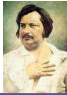
অ'ন'ৰৈ দ্য বালজাক ফৰাচী উপন্যাসিক

গুৱাহাটী (০৩৬১) ২২৬১৯২৩ চাৰ্কলচন : ম'বাইল : ৮৪৮৬৯৮০২৮১ বিজ্ঞাপন : ম'বাইল : ৯৮৬৪৮৯১৭৫ যোৰহাট : (০৩৭৩) ২৩৭১৮৯৫, তেজপুৰ : (০৩৭১২) ২২১৫৫১, ডিব্ৰুগড় : (০৩৭৩) ২৩২৭৮৫৯ হোৱাটছঅপ : ৭৬৩৮০৫৮০৫৪ (সম্পাদনা) agradoot@gmail.com editor.agradoot@gmail.com ■ কাকত নাপালে ফোন কৰক : ৯১০১২-৩৮০০৩