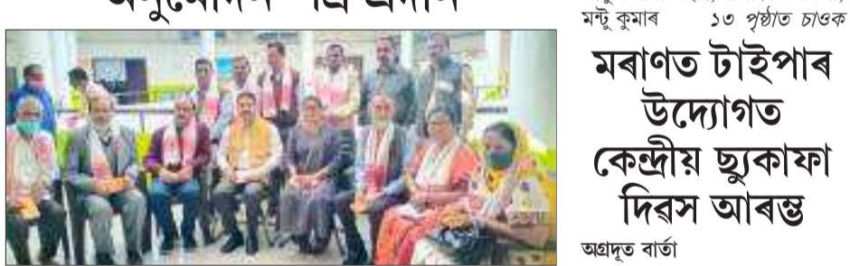
অগ্ৰদূত বাৰ্তা পলাশবাৰী, ১ ডিচেম্বৰ : কামৰূপ জিলাৰ বিভিন্ন বিদ্যালয়ৰ পৰা আজি অৱসৰ গ্ৰহণ কৰা ১০গৰাকী শিক্ষক-কৰ্মচাৰীক জিলাখনৰ বিদ্যালয় পৰিষদৰ কাৰ্যালয়ত আনুষ্ঠানিকভাৱে বিদায় ১৩ পৃষ্ঠাত চাওক