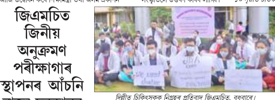
দ্বিতীয় চিকিৎসক নিগ্ৰহৰ প্ৰতিবাদ জিএমচিট, বুধবাৰে।

স্টাফ ৰিপ'ৰ্টৰ গুৱাহাটী, ২৯ ডিচেম্বৰ : ক'ভিডৰ শংকাৰ মাজতেই লেখক, সাহিত্যিক, প্ৰকাশক তথা গ্ৰন্থপ্ৰেমীৰ মাজত উজ্জ্বল-উদ্দীপনাৰ সৃষ্টি কৰি আজিৰে পৰা আৰম্ভ হ'ল 'অসম গ্ৰন্থমেলা'। গুৱাহাটীৰ চান্দমাৰিহিত অসম অভিযান্ত্ৰিক প্ৰতিষ্ঠান খেলপথাৰত অনুষ্ঠিত গ্ৰন্থমেলা আজি উদ্বোধন কৰে শিক্ষামন্ত্ৰী তথা অসম প্ৰকাশন