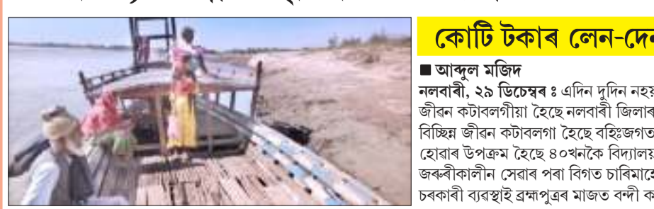
কোটি টকাৰ লেন-দেন ভূবা লীজৰ নামত

নিউজ বুৰ' নতুন দিল্লী, ২৯ ডিচেম্বৰ : 'দেশত পুনৰ ক'ভিডৰ উপদ্ৰৱ বৃদ্ধি পাব। কিছুদিনৰ ভিতৰতে দ্ৰুতভাৱে প্ৰসাৰিত হ'ব ক'ভিডৰ তৃতীয় টো। অৱশ্যে এই টো দীঘলীয়া নহ'ব। কম সময়ৰ বাবে উচ্চ হাৰৰ সংক্ৰমক অ'মিক্ৰনে ভাৰতক আৰ্শিত কৰিব। কেমব্ৰিজ বিশ্ববিদ্যালয়ৰ অধ্যয়নত এই তথ্য প্ৰকাশ পাইছে। ভাৰতত দৈনিক সংক্ৰমণৰ হাৰ বৃদ্ধি পোৱাৰ ফলত ক'ভিডৰ বিস্ফোৰক সংক্ৰমণৰ এটা সময় আহিব আৰু