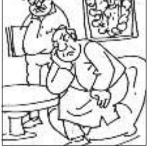
মন্ত্ৰিত্বত নাপালে, এইবাৰ যদি পিএছআ কেইটাও এৰি দিব লাগে তেন্তে এমএলএ হৈ কি লাভ!