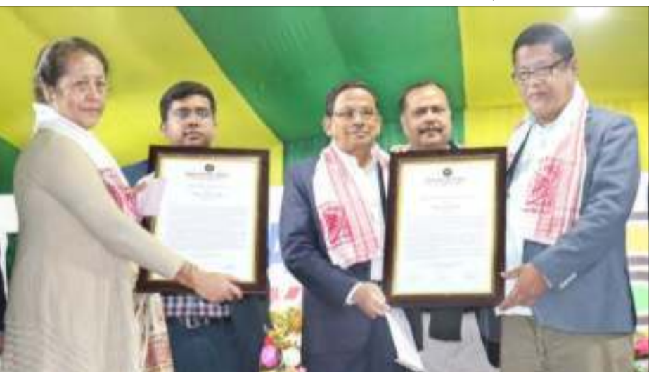
গ্ৰন্থই মানসিক অন্তৰ্ভূক্ত প্ৰশংসিত কৰে, মনলৈ প্ৰশান্তি আনে : পেণ্ড