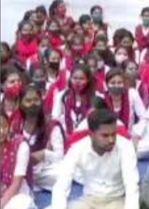
কৰ্মীৰ ওপৰত অমানৱীয় অত্যাচাৰ বন্ধ নকৰিলে অদূৰ ভৱিষ্যত ইয়াতকৈও জংগী আন্দোলন গঢ়ি তোলা হ'ব বুলি হোজাই জিলা ছাত্ৰ সন্থাই হংকাৰ দিয়ে।