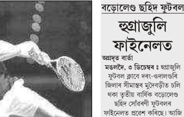
ডেভিছ কাপৰ খেলত বাছিয়াৰ আঙ্গো মেডভেডেভ, গুৰুবৰায়ে।

অগ্ৰদূত বাৰ্তা বেবেজীয়া, ৩ ডিচেম্বৰ : কাৰ্বি আংলং জিলাৰ লাংহিন তিনিআলি ক্ৰীড়া সন্থাৰ উদ্যোগত তথা বড়ো ছহিদ ন্যাসৰ সহযোগত লাংহিন গৰিমৰী খেলপথাৰত অনুষ্ঠিত ২৪সংখ্যক বড়ো ছহিদ কাপ ফুটবলৰ আজি সমৰবি পৰে। আজিৰ ফাইনেলত বিজয়ী হৈ খিতাপ জয় কৰে লাংহিন তিনিআলি ক্ৰীড়া সন্থাৰ 'এ' দলে। আজিৰ ফাইনেলত লাংহিনে ডিব্ৰুগড় ইউনাইটেড ব্ৰাড্ৰছ ফুটবল ক্লাবক ২-১ গ'লত পৰাজিত কৰে। বিজয়ী দলৰ হৈ পাঁচ মিনিটত লাৰিছ মাৰাক আৰু ন মিনিটত মাধুৰ্য বৰাই গ'ল দিয়াৰ বিপৰীতে ৪৫ মিনিটত ডিব্ৰুগড় হৈ এটা