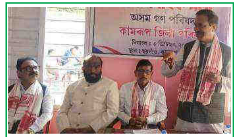
ছয়গাঁৱত কামৰূপ জিলা পৰিষদৰ কাৰ্যনিৰ্বাহক সভা