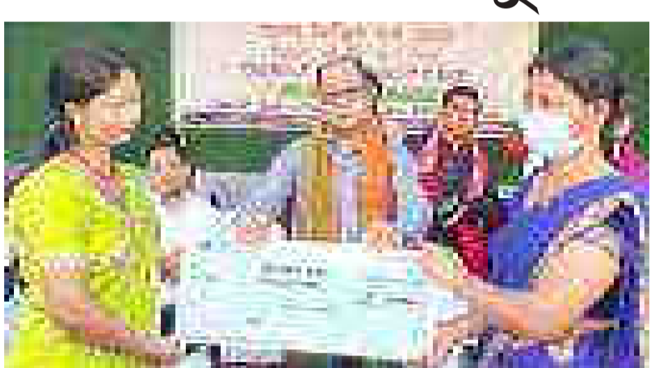
অসম ৰাজ্যিক গ্ৰামীণ জীৱিকা অভিযানৰ জিলা ভিত্তিক ঋণ মেলা, মুছলপুৰত শুকুৰবাৰে।