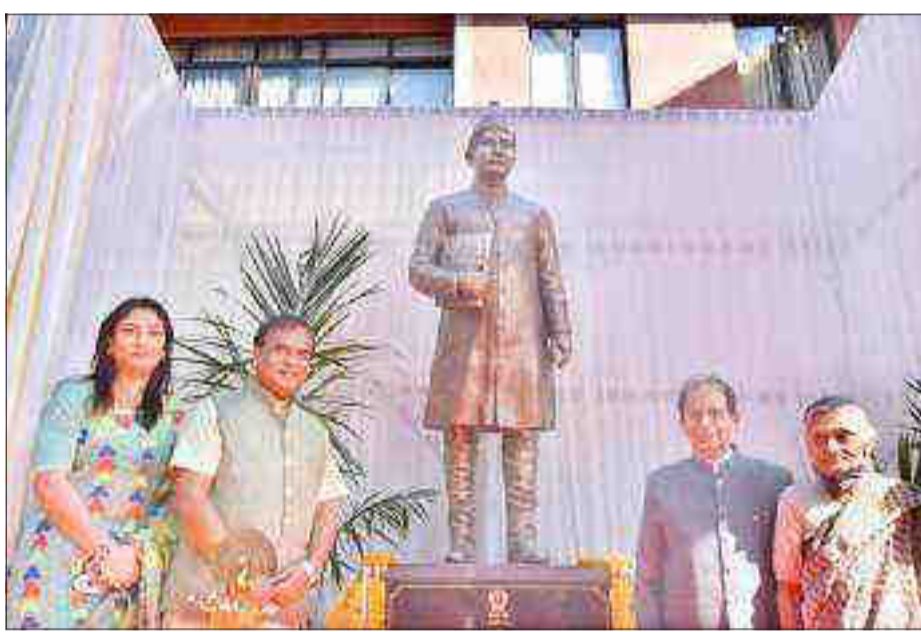
দেশৰ প্ৰথম ৰাষ্ট্ৰপতি ৰাজেন্দ্ৰ প্ৰসাদৰ প্ৰতিমূৰ্তি উন্মোচনত ৰাজ্যপাল আৰু মুখ্যমন্ত্ৰী, ৰাজভৱনত শুকুৰবাৰে।

■ নাৰাৰ্ডৰ ঋণেৰে চৰাইদেউত ৫৬৪.৪২ কোটি- বিশ্বনাথত ৫৫৫ কোটি ব্যয় সাপেক্ষে মেডিকেল কলেজ স্থাপন ■ একে অঞ্চলতে দুখন সমবায় সমিতি থাকিব পাৰিব ■ আইন সংশোধন হ'ব ইভিএমৰ জৰিয়তে আসন্ন পৌৰ নিৰ্বাচন অনুষ্ঠিত কৰাৰ সিদ্ধান্ত কেবিনেটৰ