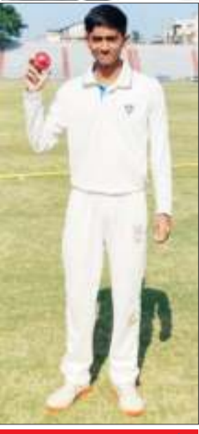
১৬ বছৰ অনূৰ্ধ্ব আন্তঃজিলা ক্ৰিকেট