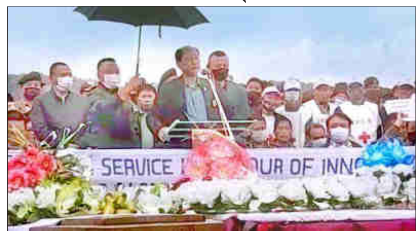
সেনাৰ গুলিত নিহত নিৰীহ লোকসকলৰ শেষকৃত্যত নগালেণ্ডৰ মুখ্যমন্ত্ৰী নেফিউ ৰিঅ', সোমবাৰে।

কোকৰাঝাৰত ১৬৬৯ প্ৰাক্তন এনডিএফৰিক আৰ্থিক অনুদান