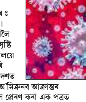
অ'মিক্ৰন ডেণ্টাতকৈ তিনিগুণে অধিক সংক্ৰমক বুলি কোৱা হৈছে আৰু ই ক'ভিড প্ৰতিৰোধী

অগ্ৰদূত প্ৰতিবেদক/স্টাফ ৰিপ'ৰ্টাৰ নতুন দিল্লী/গুৱাহাটী, ২৭ ডিচেম্বৰ : অ'মিক্ৰনৰ আতংকত কাঁপিছে দেশ। ক'ভিডৰ এই নতুন প্ৰজাতিয়ে দেশলৈ তৃতীয় টো আনিব বুলি আশংকাৰ সৃষ্টি হোৱাৰ সময়তে কেন্দ্ৰীয় গৃহ মন্ত্ৰণালয়ে ৰাজ্যসমূহলৈ সতৰ্কবাণী প্ৰদান কৰি জৰুৰী পত্ৰ প্ৰেৰণ কৰিছে। পুনৰ দেশত ক'ভিড আক্ৰান্তৰ সংখ্যাৰ লগতে অ'মিক্ৰনৰ আক্ৰান্তৰ সংখ্যাও বৃদ্ধি পোৱাত ৰাজ্যসমূহলৈ প্ৰেৰণ কৰা এক পত্ৰত