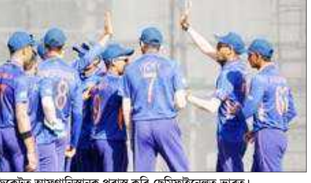
১৯ অনুৰ্ব এছিয়া কাপ ক্ৰিকেটত আফগানিস্তানক পৰাস্ত কৰি ছেমিফাইনেলত ভাৰত।

অগ্ৰদূত বাৰ্তা তিনিচুকীয়া, ২৭ ডিচেম্বৰঃ অসম ফুটবল সন্থাৰ সহ যোগত যজ্ঞোখোৰা জ্যোতিৰ্ময় যুৱ সংঘই আয়োজন কৰা সপ্তম দিবা-নৈশ ফুটবল প্ৰতিযোগিতাখন তিনিচুকীয়াৰ যজ্ঞোখোৰা খেলপথাৰত আৰম্ভ হৈছে। প্ৰতিযোগিতাৰ উদ্বোধনী মেচত টি ৱঃ ইউ নাইটেজ দলে টাইব্ৰেকাত পৰাস্ত কৰে ডাইমন এক চিক। উল্লেখ্য যে দিবা-নৈশ