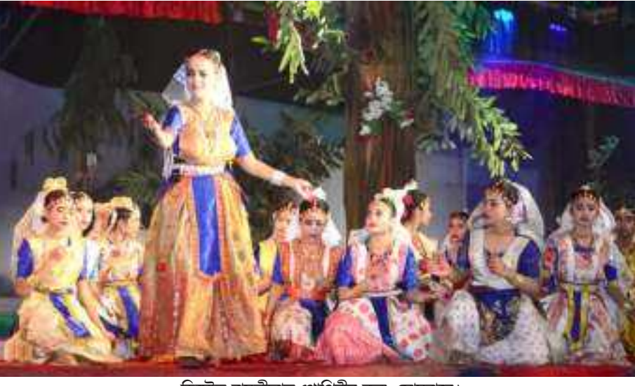
ভিমৌত বাসলীলাত গোপিনীৰ নৃত্য, সোমবাৰে।

অগ্ৰদূত বাৰ্তা পশ্চিম যোৰহাট, ২৭ ডিচেম্বৰঃ প্ৰগতিশীল মহিলা পৰিষদৰ উদ্যোগত যোৰহাট চেফেল ক্লাবত অহা আঠ জানুৱাৰীত অবিভক্ত শিৱসাগৰ জিলাৰ ভিত্তিত জিকিৰ আৰু বৰগীত প্ৰতিযোগিতাৰ আয়োজন কৰা হৈছে। প্ৰতিযোগিতাত অংশগ্ৰহণ কৰিবলৈ ৮৬৩৮১৮৮২৮১/৮৬৩৮৯৮৬৩৪ নম্বৰত যোগাযোগ কৰিবলৈ উদ্যোক্তাসকলে আহ্বান জনাইছে।