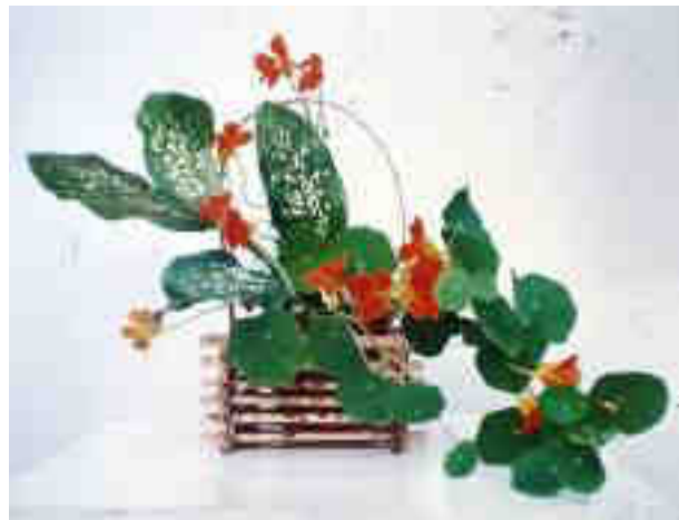
১ নম্বৰ 'সখীক সুৰবি'

উলিয়াইছে। পাইন গছৰ আকাৰৰ প্ৰাচৰ পেগোদা, পৰ্বতৰ আকাৰৰ মিছৰৰ পিৰামিড, সৰোবৰৰ পদুম ফুলৰ আকাৰৰ দিল্লীৰ 'বাহাই মন্দিৰ' আদি অনেক স্থাপত্যৰ কলাকীৰ্তিবিন্যাস শিল্পীসকলে প্ৰকৃতিক অনুকৰণ কৰিয়েই গঢ়ি উলিয়াইছে। সেউজীয়া প্ৰকৃতিৰ ফুলি থকা ধুনীয়া ফুলপাহাৰে সৌন্দৰ্য পিপাসু মানৱ মনক আনন্দ দি কবিতা আৰু সাহিত্য ৰচনাৰ প্ৰেৰণা যোগাইছে। ভাবতত ফুল বিনে যেনেকৈ কোনো সামাজিক আৰু ধৰ্মীয় অনুষ্ঠান পাতিব নোৱাৰে, জাপান দেশত ফুল বিনে কোনো গৃহস্থলী ঘৰ চলিব নোৱাৰে। মনোমোহাৰকৈ ফুলি থকা গছ এজোপা ভগৱানৰ এটা অঙ্গপৰ সৃষ্টি। কিন্তু ফুলি থকা বস্তুৰ সূত্ৰে পাইন গছৰ আকাৰৰ প্ৰাচৰ পেগোদা, পৰ্বতৰ আকাৰৰ মিছৰৰ পিৰামিড, সৰোবৰৰ পদুম ফুলৰ আকাৰৰ দিল্লীৰ 'বাহাই মন্দিৰ' আদি অনেক স্থাপত্যৰ কলাকীৰ্তিবিন্যাস শিল্পীসকলে প্ৰকৃতিক অনুকৰণ কৰিয়েই গঢ়ি উলিয়াইছে। সেউজীয়া প্ৰকৃতিৰ ফুলি থকা ধুনীয়া ফুলপাহাৰে সৌন্দৰ্য পিপাসু মানৱ মনক আনন্দ দি কবিতা আৰু সাহিত্য ৰচনাৰ প্ৰেৰণা যোগাইছে। ভাবতত ফুল বিনে যেনেকৈ কোনো সামাজিক আৰু ধৰ্মীয় অনুষ্ঠান পাতিব নোৱাৰে, জাপান দেশত ফুল বিনে কোনো গৃহস্থলী ঘৰ চলিব নোৱাৰে। মনোমোহাৰকৈ ফুলি থকা গছ এজোপা ভগৱানৰ এটা অঙ্গপৰ সৃষ্টি। কিন্তু ফুলি থকা বস্তুৰ সূত্ৰে পাইন গছৰ আকাৰৰ প্ৰাচৰ পেগোদা, পৰ্বতৰ আকাৰৰ মিছৰৰ পিৰামিড, সৰোবৰৰ পদুম ফুলৰ আকাৰৰ দিল্লীৰ 'বাহাই মন্দিৰ' আদি অনেক স্থাপত্যৰ কলাকীৰ্তিবিন্যাস শিল্পীসকলে প্ৰকৃতিক অনুকৰণ কৰিয়েই গঢ়ি উলিয়াইছে।