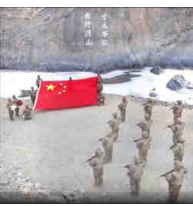
■ নিউজ ব্যু'ৰ নতুন দিল্লী, ৩ জানুৱাৰী : ভাৰত-চীন সীমান্তৰ বিতৰ্কিত গালবান উপত্যকাত পহিলা জানুৱাৰীত উৰিল চীনা পতাকা। দুই ৰাষ্ট্ৰৰ মাজত সীমান্ত বিবাদৰ উত্তেজনা দীৰ্ঘদিন ধৰি অব্যাহত থকাৰ মাজতে সীমান্তবৰ্তী গালবান উপত্যকাত চীনা সেনাই দেশৰ ৰাষ্ট্ৰীয় পতাকা উত্তোলন কৰাক লৈ তীব্ৰ প্ৰতিক্ৰিয়াৰ সৃষ্টি হৈছে। চীনৰ চৰকাৰী টুইটৰযোগে এই সম্পৰ্কীয় এক ভিডিঅ' প্ৰচাৰ কৰাত তুমুল বিতৰ্কৰ সৃষ্টি হৈছে। অৱশ্যে ভাৰতীয় সেনাৰ সূত্ৰত প্ৰকাশ যে যি স্থানত চীনৰ পতাকা উৰিছে সেয়া বিতৰ্কিত

গীতৰ লগতে ভূপেন হাজৰিকাৰ আত্মজীৱনীয়েও বাংলাদেশত তুলি আহিছে খলকনি