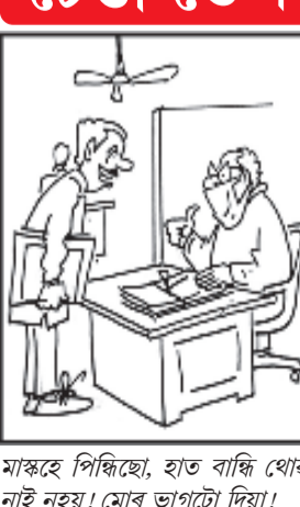
মাকহে পিন্ধিছে, হাত বান্ধি থোৱা নাই নহয়! মোৰ ভাগটো দিয়া!

■ দুলীয়াজানত দ্বিতীয়খন আৰক্ষী অধীক্ষক সন্মিলন ■ ৰাজ্যত ব্যক্তিগত নিৰাপত্তাৰক্ষীৰ প্ৰয়োজন নোহোৱা পৰিৱেশৰ সৃষ্টি কৰিব পাৰিব লাগিব ■ মুকলি আহুন মুখ্যমন্ত্ৰী ড° শৰ্মাৰ