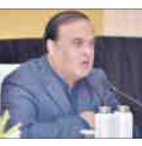
বিশেষ সংবাদদাতা/অগ্ৰদূত বাৰ্তা ডিব্ৰুগড়/দুলায়জান, ৩ জানুৱাৰী : 'সৰ্বসাধাৰণৰ সুৰক্ষা সুনিশ্চিত কৰাৰ বাবে বন্ধুত্বসুলভ মানসিকতাত অসম আৰক্ষীয়ে জনতাৰ কাষত সদায়ে থিয় দিব লাগিব, কিন্তু একে সময়তে শূন্য সহনশীল নীতিৰে সকলো প্ৰকাৰৰ অপৰাধৰ বিৰুদ্ধে কঠোৰ হিঁত্বও গ্ৰহণ কৰিব লাগিব।' দুলায়জানত আজি এই মন্তব্য কৰিলে মুখ্যমন্ত্ৰী ড° হিমন্ত বিশ্ব শৰ্মাই। অসম আৰক্ষীত সংস্কাৰ সাধনৰ দিশত এক নতুন মাত্ৰা অৰ্থেৰণৰ অশংকপে

মুখ্যমন্ত্ৰীয়ে আজি তৈলনগৰী দুলায়জানত অসমৰ সকলো জিলাৰ আৰক্ষী অধীক্ষকসকলৰ দ্বিতীয়খন সন্মিলন উদ্বোধন কৰে। গুণগত মানৰ অনুসন্ধান আৰু ফলপ্ৰসূতাবে গোচৰ নিষ্পত্তি প্ৰক্ৰিয়াত সফলতা আৰক্ষী বাহিনীৰ মূল চাবিকাঠী বুলি অভিহিত কৰি মুখ্যমন্ত্ৰীয়ে ৰাজ্যৰ নাগৰিকসকলৰ বিৰুদ্ধে সংঘটিত সকলো প্ৰকাৰৰ অন্যাৱৰণ বিৰুদ্ধে দৃঢ়তাৰে থিয় দিবলৈ আৰক্ষীক আহ্বান জনায়। উদ্বোধনী ভাষণত ড° শৰ্মাই কয় যে ছমাহৰ আগতে কাজিৰঙাত ১০ পৃষ্ঠাত চাওক