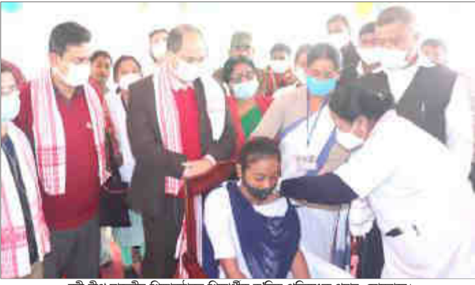
নদী-দ্বীপ মাজুলীৰ শিক্ষানুষ্ঠানত শিক্ষাৰ্থীক ক'ভিড প্ৰতিৰোধক প্ৰদান, সোমবাৰে।

কৰি আছে। ছয় জনগোষ্ঠীক জনজাতিকৰণৰ প্ৰতি মুখ্যমন্ত্রী ড° হিমন্ত বিশ্ব শৰ্মাৰ অপমান সমগ্ৰ অসমৰ বাবে দুৰ্ভাগ্যজনক বুলি সংবাদমেলত সদৰী কৰে আটাছৰ কৰ্মীসকলে। আনহাতে, ছয় জনগোষ্ঠী জনজাতিকৰণ সন্দৰ্ভত মুখ্যমন্ত্রীক নিৰ্বাচনী ইচ্ছাহাৰত থকা প্ৰতিক্ৰমিত আখৰে আখৰে পালন কৰিবলৈ দাবী সসী তহি আহোম ছাত্ৰ সন্থা গোলাঘাট জিলা সমিতিৰ। ইফালে, খুমটাইত সাত, আঠ আৰু ন জানুৱাৰীত বৰ্ণাঢ়া কাৰ্যসূচীৰে অনুষ্ঠিত হ'বলগীয়া দ্বি-বাৰ্ষিক গোলাঘাট জিলাৰ অধিবেশন মহামাৰী ক'ভিড পৰিস্থিতিৰ বাবে বাতিল কৰা হৈছে বুলি সংবাদ মাধ্যমত সদৰী কৰে অধিবেশন উদ্যোগন সমিতিয়ে। কেৱল সাত জানুৱাৰীত আহোম সকলৰ পূৰ্বপুৰুষ স্মৃতি উদ্দেশ্যে আগবঢ়োৱা ৰিক-খন-মুং-খন পূজা ভাগি অনুষ্ঠিত হ'ব। উল্লেখ যে মহামাৰী ক'ভিড পৰিস্থিতিৰ বাবে আটাছৰ গোলাঘাট জিলাৰ সমিতিখনৰ কাৰ্যকাল পুনৰ দুটা বৰ্ষৰ বাবে বৃদ্ধি কৰাৰ কথা সংবাদ মাধ্যমত আগত সদৰী কৰে আটাছৰ বিষয়ববীয়াসকলে।