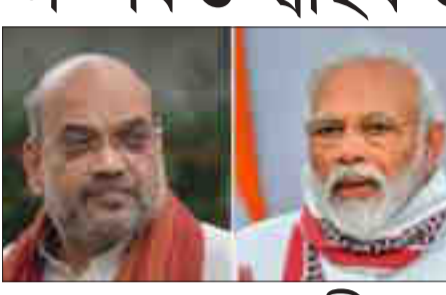
■ নিউজ ব্যু'ৰ নতুন দিল্লী, ২৯ ডিচেম্বৰ : প্ৰধানমন্ত্ৰী নৰেন্দ্ৰ মোদীৰ প্ৰতি অপমানজনক মন্তব্য কৰিছিল নেকি গৃহমন্ত্ৰী অমিত শ্বাহে? মূৰৰ বিকৃতি ঘটা বুলি কৈছিল নেকি মোদীক? মেঘালয়ৰ ৰাজ্যপাল সত্যপাল মালিকৰ স্পষ্টীকৰণ মতে এনে ঘটনা ঘটা নাই। গৃহমন্ত্ৰী শ্বাহে প্ৰধানমন্ত্ৰীৰ প্ৰতি কোনো ধৰণৰ অপমান প্ৰদৰ্শন কৰা নাই। দৰাচলতে এই প্ৰশ্নৰ সূত্ৰত ঘটে মালিকৰ ভাইৰেল হৈ পৰা এটা ভিডিঅ'ৰ ১০ পৃষ্ঠাত চাওক

অঞ্চলৰ পৰা আঁতৰত। চীনৰ চৰকাৰী টুইটাৰত এইদৰে উল্লেখ কৰা হয়, '২০২২ৰ নৱবৰ্ষৰ দিনা গালবান উপত্যকাত চীনৰ ৰাষ্ট্ৰীয় পতাকা উত্তোলন কৰা হৈছে। এই ৰাষ্ট্ৰীয় পতাকা অতি বিশেষ কিয়নো 'বেইজিঙৰ টিয়েনানমেন স্কোৱেৰত ইয়াক উত্তোলন কৰা হৈছিল।' ভিডিঅ'ত দেখা গৈছে যে চীনৰ এখন পতাকা আংশিকভাৱে বৰফাবৃত পাহাৰীয়া অঞ্চলত উত্তোলন কৰা হৈছে। গুচতে থিয় হৈ আছে সশস্ত্ৰ বাহিনীৰ বহুসংখ্যক সদস্য। ২০২০ৰ জুনত গালবান লৈয়ে পাক লোৱা যি অঞ্চলত ভাৰত-চীনৰ সংঘৰ্ষ হৈছিল সেই আঠ পৃষ্ঠাত চাওক