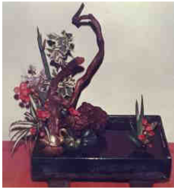
২ নম্বৰ চিত্ৰত দিয়া সজ্জাটোৰ নাম 'ফুলে কথা কয়'

পৰিবেশটোৰ ভাব প্ৰকাশ কৰিছে। সজ্জাটোৰ কৰ্মকৌশল হ'ল—এটা ফুলৰ কুকিৰ ভিতৰত প্লাষ্টিক বা আইনাৰ পাত এটাত বালি ভৰাই বালি তিতি যোৱাকৈ পানী ঢালি কুকিটোৰ ওপৰৰ জালোৰে বান্ধি দিয়া হৈছে। টাৰত গজা সেউজীয়া ফুট থকা আলাংকাৰিক পাত ঠাৰিৰে স'তে ডিঙি কুকিটোৰ জালৰ মাজেৰে ভৰাই পাতৰ তিতা বালিত গুজি