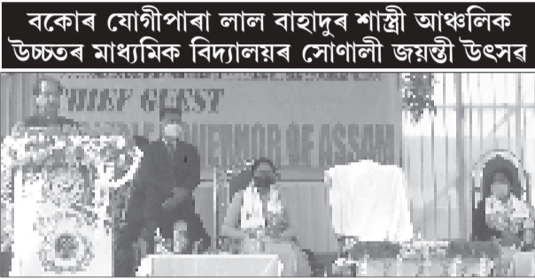
বকোৰ যোগীপাৰা লাল বাহাদুৰ শাস্ত্ৰী আঞ্চলিক উচ্চতৰ মাধ্যমিক বিদ্যালয়ৰ সোণালী জয়ন্তী উৎসৱ

আলোচপতি, ৩ জানুৱাৰী : কামৰূপ জিলাৰ বকে সমষ্টিৰ অন্তৰ্গত দুই নম্বৰ যোগীপাৰা লাল বাহাদুৰ শাস্ত্ৰী আঞ্চলিক উচ্চতৰ মাধ্যমিক বিদ্যালয়ৰ সোণালী জয়ন্তী উৎসৱৰ আজি মুকলি সভা অনুষ্ঠিত হয়। উক্ত সভাত ৰাজ্যপাল অধ্যাপক জগদীশ মুখীয়ে অংশগ্ৰহণ কৰে। সোণালী জয়ন্তীৰ মুকলি সভাত ৰাজ্যপাল মুখীয়ে কয় যে যিকোনো অনুষ্ঠান এটাই সোণালী জয়ন্তী বৰ্ষত ভৰি দিয়াটো অতি কঠিন। তেওঁ তাহানিয়ে লাল বাহাদুৰ শাস্ত্ৰী বিজ্ঞানসকলক বন্যাদ জ্ঞাপন কৰি ৰাজ্যৰ শিক্ষাৰ্থীৰ লগতে অভিভাৱকসকলক বিজ্ঞান শিক্ষাৰ