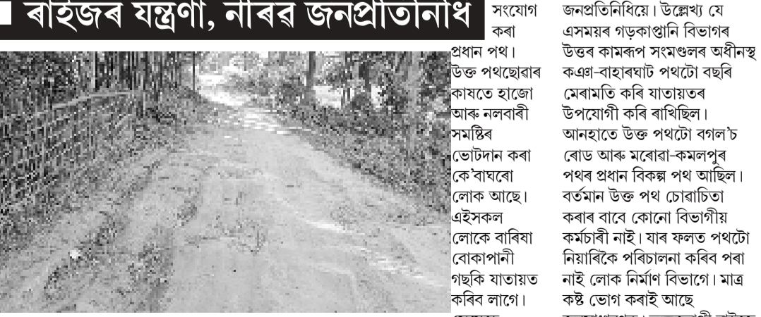
ৰাইজৰ এটা অংশই আজি 'দিনক অগ্ৰদূত'ৰ আগত 'সাতভগীয়া

লহকৰপাৰা-কেদুতলৈ একে ধৰনে নিৰ্মাণ কৰি যাতায়তৰ উপযোগী কৰিছে। কিন্তু লক্ষ্য মাজতে পথটোৰ এটা অংশ দুৰ্ভাগ্যজনক ভাবে বে গ'ল। উক্ত অংশটোৱে হ'ল পূৰ্ণদৈচপৰাৰ পৰা চাপোন সংযোগী কৰা প্ৰধান পথ। উক্ত পথছোৱাৰ কাষতে হাজ্জা আৰু নলবাৰী সমষ্টিৰ ভোটদান কৰা কে'বাঘৰো লোক আছে। এইসকলে লোকে বাৰিষা বোকাপানী গছকি যাতায়ত কৰিব লাগে। সেয়েহে