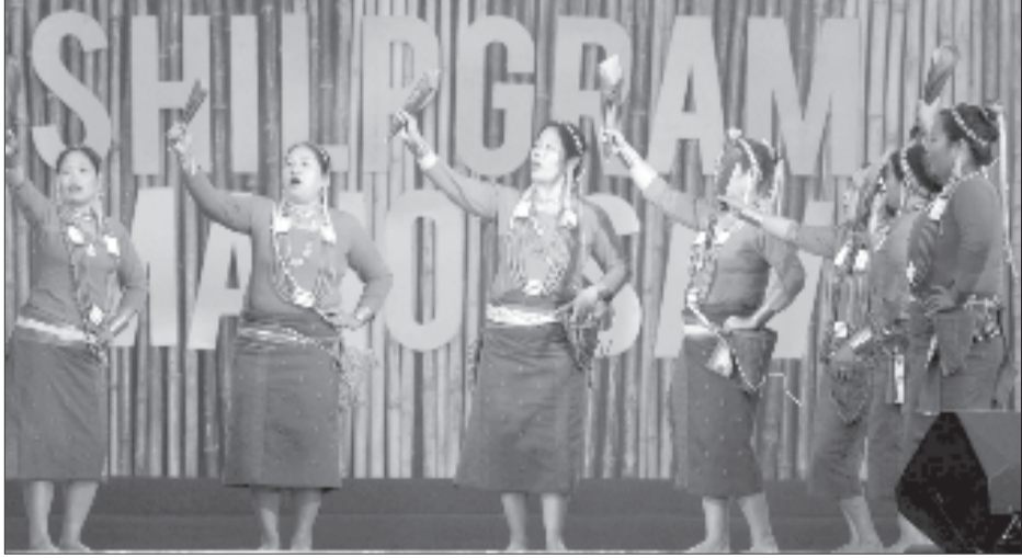
শিল্পগ্ৰাম মহোৎসৱত গৰম্পৰাগত নৃত্য প্ৰদৰ্শন, বুধবাৰে।

বিধানসভা সমন্বিত দুটাকৈ বাঘৰ বিচৰণে সৰ্বসাধাৰণক চিন্তিত কৰাৰ লগতে ইয়াৰে এটা বাঘৰ সতে পোৱালী থকা বুলিও আশংকা কৰা