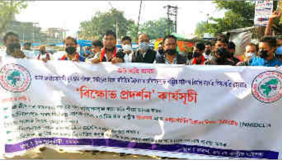
ৰাষ্ট্ৰীয় ঘাইপথ নিৰ্মাণৰ বিসংগতিৰ প্ৰতিবাদত জাতীয়তাবাদী যুৱ-ছাত্ৰ পৰিষদৰ বিক্ষোভ প্ৰদৰ্শন কাৰ্যসূচী।

শাখাৰ দিছপুৰ কাৰ্যালয়ৰ পৰা উৰু ফাইলটো বিচাৰি চৰকাৰী পত্ৰ প্ৰেৰণ কৰা হৈছিল যদিও আজিকোপতি গা নলবিলা বিভাগীয় বিষয়াৰ। পত্ৰখনৰ জৰিয়তে উৰু ফাইলটোৰ লগতে সংশ্লিষ্ট কাৰ্যালয়টোত পৰি থকা সেইখাটোও ক্ষতিপূৰণ ফাইল বিচাৰা হৈছিল যদিও সেই ফাইলসমূহ আগতেই বিভাগীয় কাৰ্যালয়ত জমা দিয়া হ'ল বুলি দায় সাৰে শিৱসাগৰ জলসম্পদ সংগঠনৰ কাৰ্যালয়ে। ভুক্তভোগী কেউটি উচ্ছেদিত পৰিয়ালে অত বছৰ শিৱসাগৰ জলসম্পদ সংগঠনৰ কাৰ্যালয়, উপায়ন্তৰ কাৰ্যালয় আৰু দিছপুৰ সচিবালয়ত তাঁৰাটিক কৰিলে যদিও আজি পৰ্যন্ত তেওঁলোকৰ কাৰ্যক্ৰম- নিৰ্ণয়িত চৰকাৰী বিষয়া-কৰ্মচাৰীয়ে ওকত্ৰ নিদিয়াৰ ১৩ পৃষ্ঠাত চাওক