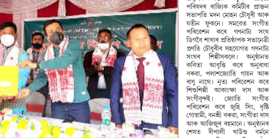
ডিব্ৰুগড়ত হিতাধিকাৰীক পাবাৰ টিলাৰ বিতৰণ, বুধবাৰে।