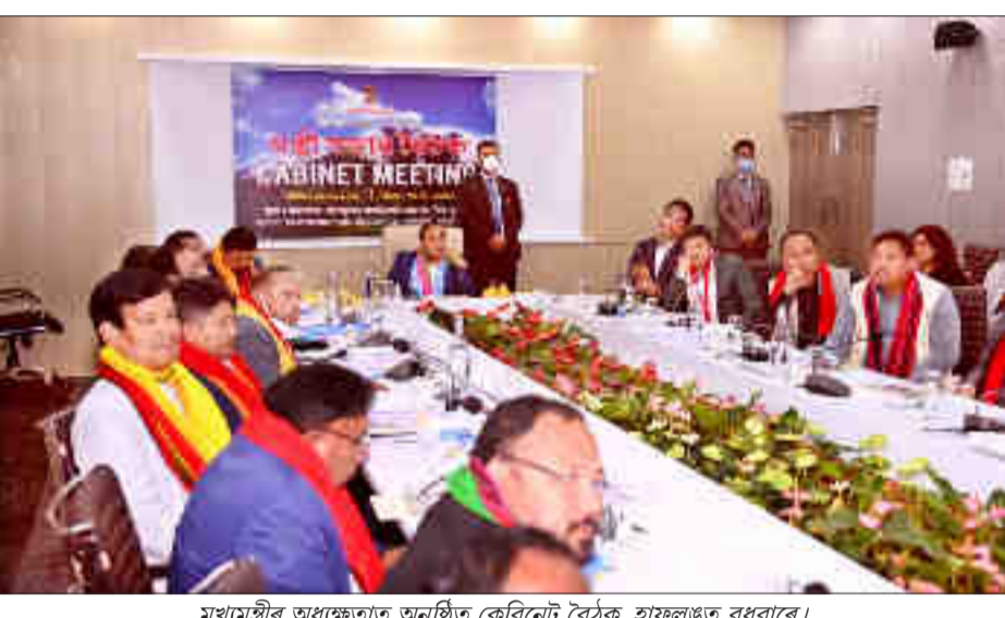
মুখ্যমন্ত্ৰীৰ অধক্ষতাত অনুষ্ঠিত কেবিনেট বৈঠক, হাফলঙত বুধবাৰে।

শিলচৰত স্থাপন হ'ব মুকলিত ঘূৰি ফুৰা জীৱ-জন্তু উপভোগ কৰিব পৰা চিৰিয়াখানা ডিমা হাছাওৰ আন্তঃগাঁথনিৰ বাবে আঁচনি