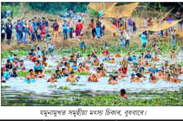
যমুনামুখত সমূহীয়া মংসা চিকাৰ, বুধবাৰে।

ফণীত্ৰ বৰুৱা নদুৱাৰ, ১৯ জানুৱাৰী : বিগত ৩৫ বছৰ ধৰি মানৱ সমাজৰ পৰা আঁতৰত ঘন জংঘলত বসবাস কৰি আহিছে এজন লোকে।