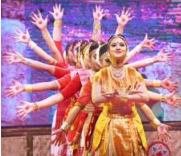
সৰ্বোচ্চ ৰাজ্যিক অসামৰিক বঁটা প্ৰদান অনুষ্ঠাত নৃত্য প্ৰদৰ্শন, সোমবাৰে।

সুস্থতাৰ হাৰ ৯৩ শতাংশৰ সামান্য বেছি। এই মুহূৰ্তত দেশত সক্ৰিয় ক'ভিড ৰোগী আছে ২২ লাখ ৪৯ হেজাৰ ০৩৫জন। স্বাস্থ্য মন্ত্ৰালয়ৰ পৰিসংখ্যাত দেখা গৈছে যে দেওবাৰৰ তুলনাত দৈনিক সংক্ৰমণ কমিছে ২৭ লাখ ৪৬৯জন। সংক্ৰমণৰ হাৰ ২০.৭৫ শতাংশ, যাৰ উৰ্দ্ধমুখী হাৰ অব্যাহত। বিগত ২৪ ঘণ্টাত ১৪ লাখ ৭৪ হেজাৰ ৭৫৩টা নমুনা পৰীক্ষা কৰা হৈছে। যাৰ ভিতৰত পজিটিভ হাৰ ২০ শতাংশৰ বেছি। ইপিনে, বিশেষজ্ঞসকলে দাবী কৰিছে যে শেহতীয়াকৈ মূৰ দাঙি উঠিছে অ'মিক্ৰনৰ উপ-প্ৰজাতি 'বিএ.২.১' যিটো আৰ্টি-পিচিআৰ পৰীক্ষাত ধৰা পৰা নাই। ফলত