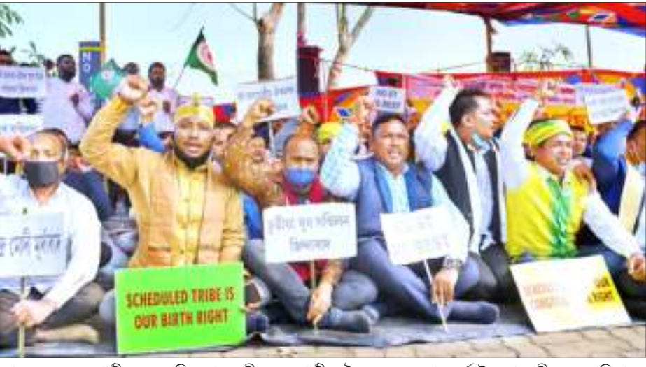
ৰাজহ ছয় জনগোষ্ঠীয় জনজাতিকৰণৰ দাবীত জনগোষ্ঠীয় ঐক্যমঞ্চৰ অৱহান ধৰ্মঘট, মহানগৰীত বৃহস্পতিবাৰে।