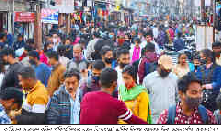
ক'ভিডৰ সংক্ৰমণ বৃদ্ধিৰ পৰিপ্ৰেক্ষিতত নতুন নিষেধাজ্ঞা জাৰিৰ দিনাও বজাৰত ভিৰ, মহানগৰীত গুৰুৰংগা

প্ৰধানমন্ত্ৰী আৱাস (গ্ৰামীণ) আঁচনি ৰূপায়ণত ব্যৰ্থতা ওলাই পৰিল চুবুৰীয়া অৰুণাচলে ৰাষ্ট্ৰীয় গড়ৰ তিনিমাহ পূৰ্বেই সম্পূৰ্ণ কৰে নিৰ্মাণ ৰাষ্ট্ৰীয় গড়তকৈ তিনিমাহ পিছ পৰি ৰৈছে অসম, ক'ভিডৰ অজুহাত