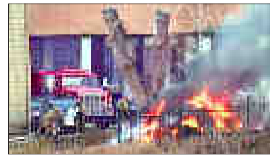
বাহিনীয়ে বেলাকছৰ স'ত থকা ইউক্ৰেইনৰ উত্তৰৰ সীমান্তৰ পৰা আক্ৰমণ আৰম্ভ কৰে। ইউক্ৰেইনৰ ১০ পৃষ্ঠাত চাওক

নিউজ যুৱ' মস্কো/কিয়েভ, ২৪ ফেব্ৰুৱাৰী : ইউক্ৰেইনক তিনিও দিশৰ পৰা আওৰি ধৰি পূৰ্ণাংগ সমৰসজ্জাৰে যুদ্ধক্ষেত্ৰত জঁপিয়াই পৰিল ৰাছিয়া। দ্বিতীয় বিশ্বযুদ্ধৰ পাছত ইউৰোপত সৰ্ববৃহৎ সংঘৰ্ষৰ সূচনা কৰি ইউক্ৰেইনৰ ওপৰত জঁপিয়াই পৰিল ৰুছ সেনা বাহিনী। বহু মাহ পূৰ্বৰে পৰাই এই যুদ্ধৰ প্ৰস্তুতি চলাইছিল ৰাছিয়াৰ ৰাষ্ট্ৰপতি ভ্লাডিমিৰ পুটিনে। সামৰিক অনুশীলনৰ অজুহাত দেখুৱাই