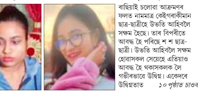
বাছিয়াই চলোৱা আক্ৰমণৰ ফলত নামমাৰ কেইগৰাকীমান ছাত্ৰ-ছাত্ৰীয়ে উভতি আহিবলৈ সক্ষম হৈছে। তাৰ বিপৰীতে আৰব্ধ হৈ পৰিছে শ শ ছাত্ৰ-ছাত্ৰী। উভতি আহিবলৈ সক্ষম হোৱাসকল সেয়েহে এতিয়াও আৰব্ধ হৈ থকাসকলক লৈ গভীৰভাৱে উদ্ভিগ্ন। একেধৰে উদ্ভিগ্নত ১০ পৃষ্ঠাত চাওক

স্টাফ ৰিপ'ৰ্টাৰ/বিশেষ সংবাদদাতা/অগ্ৰদূত বাৰ্তা গুৱাহাটী/নগাঁও/ডিগাঁও/লাহৰদেও/দেৰগাঁও, ২৫ ফেব্ৰুৱাৰী : সূদূৰ হ'লেও ইউক্ৰেইনত চিকিৎসা বিজ্ঞানক মুখ্য কৰি বিভিন্ন পাঠ্যক্ৰম অধ্যয়ন কৰি থকা অসমৰ ছাত্ৰ-ছাত্ৰীৰ সংখ্যা হ'ল প্ৰায় তিনি হেজাৰ। দেশখনৰ ওপৰত