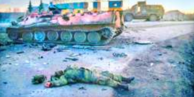
নিউজ বুৰ' কিয়েভ, ২৩ ফেব্ৰুৱাৰী : ধাৰাবাহিক ক্ষেপণাসুৰ আৰু বোমাৰ আঘাতত ক্ষত-বিক্ষত ইউক্ৰেইন। বাছিয়াৰ ৰাষ্ট্ৰপতি ড্ৰাভিমিৰ পুটিনে দাবী কৰিছিল যে সামৰিক অভিযান আৰম্ভ কৰা হৈছে, যুদ্ধ নহয়। ইউক্ৰেইনৰ সামৰিক ঘাটীবোৰেই কছ বাহিনীৰ লক্ষ্য বুলিও পুটিনে কৈছিল। লগতে ইউক্ৰেইনৰ সাধাৰণ জনতাৰ কোনো ক্ষয়-ক্ষতি নহয় আৰু নাগৰিকসকলে ৰাজধানী কিয়েভলৈ ধৰি নগৰ-চহৰ পৰিত্যাগ কৰিব নালাগে বুলিও আশ্বস্ত কৰিছিল যদিও তাক বিশ্বাসত হোৱা নাছিল ইউক্ৰেইনবাসীয়ে। অৰণ্যত এনে আশংকাত সত্য প্ৰমাণিত কৰি আজি পুৰাৰ পৰা

কোলাত কেঁচুৱা লৈ স্বদেশ এৰি পলায়ন কিয়েভত জলসংকট : অবৰণীয় দৃশ্য নিউজ বুৰ' কিয়েভ, ২৩ ফেব্ৰুৱাৰী : ধাৰাবাহিক ক্ষেপণাসুৰ আৰু বোমাৰ আঘাতত ক্ষত-বিক্ষত ইউক্ৰেইন। বাছিয়াৰ ৰাষ্ট্ৰপতি ড্ৰাভিমিৰ পুটিনে দাবী কৰিছিল যে সামৰিক অভিযান আৰম্ভ কৰা হৈছে, যুদ্ধ নহয়। ইউক্ৰেইনৰ সামৰিক ঘাটীবোৰেই কছ বাহিনীৰ লক্ষ্য বুলিও পুটিনে কৈছিল। লগতে ইউক্ৰেইনৰ সাধাৰণ জনতাৰ কোনো ক্ষয়-ক্ষতি নহয় আৰু নাগৰিকসকলে ৰাজধানী কিয়েভলৈ ধৰি নগৰ-চহৰ পৰিত্যাগ কৰিব নালাগে বুলিও আশ্বস্ত কৰিছিল যদিও তাক বিশ্বাসত হোৱা নাছিল ইউক্ৰেইনবাসীয়ে। অৰণ্যত এনে আশংকাত সত্য প্ৰমাণিত কৰি আজি পুৰাৰ পৰা