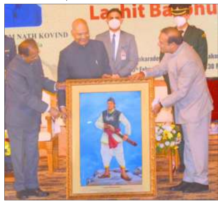
গুৱাহাটী, ২৫ ফেব্ৰুৱাৰী : ৰাষ্ট্ৰপতি বৰদৰ্শন ক'ৱিন্দৰ অংশগ্ৰহণেৰে আজি মহানগৰীৰ শ্ৰীমন্ত শংকৰদেৱ কলাক্ষেত্ৰত বীৰ লাচিত বৰফুকনৰ চাৰিশ সংখ্যক জন্ম জয়ন্তী বৰ্ষৰ অনুষ্ঠানৰ শুভাৰম্ভণি কৰা হয়। আহোম ৰাজ শাসনৰ বীৰযোদ্ধা লাচিত বৰফুকনৰ চাৰিশ সংখ্যক জন্ম জয়ন্তী বৰ্ষ অনুষ্ঠান উদ্বোধন কৰি দিয়া ভাষণত ৰাষ্ট্ৰপতি ক'ৱিন্দে কয় যে শৰাইঘাটৰ ৰণত লাচিত বৰফুকনে কেৱল আক্ৰমণকাৰী মোগলক পৰাস্ত

ভূপেন হাজৰিকাৰ গীতেৰে ভাষণ আৰম্ভ কৰিলে ৰাষ্ট্ৰপতিয়ে ৰাষ্ট্ৰপতি ভৱনত লাচিত বৰফুকনৰ প্ৰতিচ্ছবি সংৰক্ষণ-প্ৰদৰ্শন কৰিব ক'ৱিন্দে সপৰিয়ালে কামাখ্যা মন্দিৰ দৰ্শন