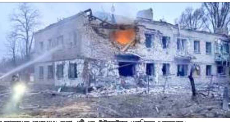
কছ আক্ৰমণত ধ্বংসপ্ৰাপ্ত হোৱা এটি গৃহ, ইউক্ৰেইনৰ খাৰখিতত শুকুৰবাবে।

স্টাফ ৰিপ'ৰ্টাৰ গুৱাহাটী, ২৫ ফেব্ৰুৱাৰী : প্ৰধানমন্ত্ৰী নৱেন্দ্ৰ মোদীয়ে নিজে তদাৰক কৰা কেন্দ্ৰীয় চৰকাৰৰ এখন ধৰ্মাৰ্থী আৰ্চনি— প্ৰধানমন্ত্ৰী আবাস যোজনা (নগৰ)। ২০২২ৰ মাৰ্চৰ ভিতৰত দেশৰ নগৰ অঞ্চলৰ কোনো লোক যাতে গৃহহীন হৈ থাকিব নালাগে সেই লক্ষ্যৰে বিগত ২০১৪ৰ জুনত আৰ্চনিখনৰ কাৰ্য্যকৰণ আৰম্ভ হৈছিল। সেই সময়সীমা স্পৰ্শ কৰিবলৈ মাজত এমাহে আছে। অসমত এই আৰ্চনিখন অতি শামুকীয়া গতিত কাৰ্য্যকৰণ হোৱাই নহয়, চাৰিখন নগৰত আজিলৈকে এটা ঘৰো সম্পূৰ্ণ নহ'ল। নগৰকেইখন হ'ল গোলকগঞ্জ, জাগীৰোড, বৈঠালাংছ আৰু লাংখিন। এই তথ্যৰে একপ্ৰকাৰ অভিলেখ গঢ়া অসমত মাত্ৰ এটা ঘৰৰ নিৰ্মাণ