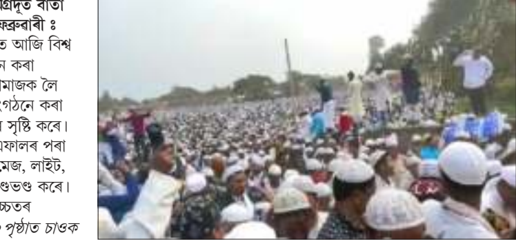
এইবোৰ নাটকৰ অংকহে! প্ৰথমটো অংকত যি দেখিবা, পাছটোত তাৰ আকৌ ওলোটো!

বিশেষ সংবাদদাতা/অগ্ৰদূত বাৰ্তা নগাঁও/জুবীয়া, ২৫ ফেব্ৰুৱাৰী : নগাঁও জিলাৰ জুবীয়াত আজি বিশ্ব শান্তিৰ বাবে আয়োজন কৰা শুকুৰবীয়া জুম্মাৰ নামাজক লৈ এটা অখ্যাত ধৰ্মীয় সংগঠনে কৰা প্ৰতাৰণাই লংকাগণ্ডৰ সৃষ্টি কৰে। একাংশ ক্ষুদ্ৰ লোকে এফালৰ পৰা মণ্ডপৰ লগতে চকী, মেজ, লাইট, শব্দযন্ত্ৰ আদি ভাঙি লণ্ডণ্ড কৰে। জুবীয়াৰ বগৰীণ্ডৰ উচ্চতৰ মাধ্যমিক