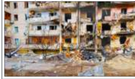
নিউজ বুৰ' নতুন দিল্লী, ২৫ ফেব্ৰুৱাৰী : বাছিয়া আৰু ইউক্ৰেইন যুদ্ধৰ পৰিণতিত আন্তৰ্জাতিক বজাৰত প্ৰতি বেবেল তেলৰ মূল্য ১০৫ ডলাৰলৈ বৃদ্ধি হৈছে। ইতিমধ্যে বিশ্বৰ বজাৰত থাকিব তেলৰ প্ৰতি বেবেলৰ মূল্য আকাশশৰণী হৈছে। ভাৰত সৰ্বাধিক পৰিমাণৰ খাৰকা তেল আমদানি কৰা বিশ্বৰ দ্বিতীয়খন ৰাষ্ট্ৰ।