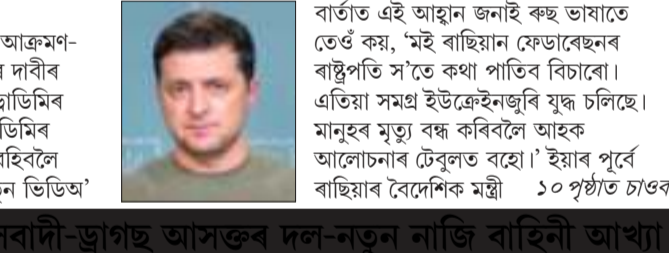
নিউজ বুৰ' কিয়েভ, ২৫ ফেব্ৰুৱাৰী : যুদ্ধ, আক্ৰমণ-প্ৰত্যাহ্বান, হতাশতৰ দুই পক্ষৰ দাবীৰ মাজতে ইউক্ৰেইনৰ ৰাষ্ট্ৰপতি ড্ৰাভিমিৰ পুটিনক মুখামুখি আলোচনাৰ বাহিৰলৈ আহান জনালে। আজি এক নতুন ভিডিঅ'