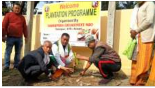
অগ্ৰদূত বাৰ্তা তামুলপুৰ, ৫ ফেব্ৰুৱাৰী : নগৰগতি তামুলপুৰ জিলাখন প্ৰাকৃতিক পৰিবেশৰ

তামুলপুৰ, ৫ ফেব্ৰুৱাৰী : নগৰগতি তামুলপুৰ জিলাখন প্ৰাকৃতিক পৰিবেশৰ মাজত সেউজীয়া কৰি গঢ়িবলৈ চৰকাৰে তামুলপুৰৰ ৰেছাৰ্চ স্কীমৰ