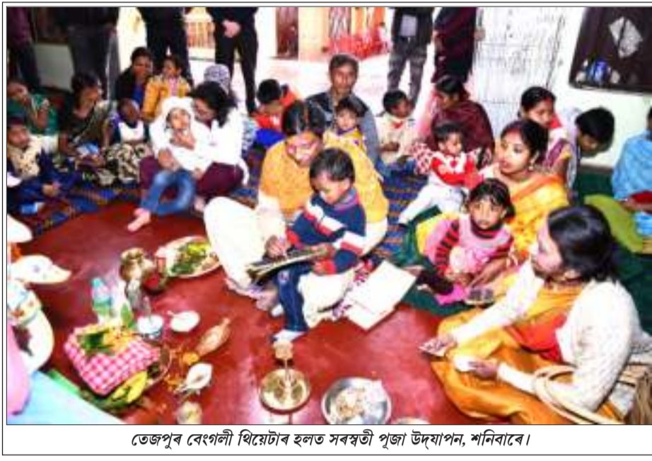
তেজপুৰ বেংগলী থিয়েটাৰ হলত সৰস্বতী পূজা উদ্‌যাপন, শনিবাৰে।

ষ্টাফ বিপটৰ ওৰাহাটী, ৫ ফেব্ৰুৱাৰী : ডাগছ-জুৰা-বামিজ চুপাৰি আদিৰ ছিণ্ডিকেটৰ সমান্তৰালভাৱে দুষ্ট চৰাই অব্যাহত বহা অসমৰ কৃষকৰ বাবে আৱণ্টিত সাৰৰ চোৰাং বেহা ৰোধ কৰিবলৈ কঠোৰ হৈছে অসম আৰক্ষী।