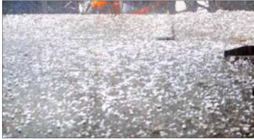
শাসক পক্ষৰো সমৰ্থনৰ আশা পালিছে

গুৱাহাটী, ৫ ফেব্ৰুৱাৰী : বতৰৰ অস্বাভাৱিক পৰিৱৰ্তনত আবতৰীয়া ঠেৰেঙা জাৰত ৰূপিছে সমগ্ৰ ৰাজ্য। স্বাভাৱিকতে ফাগুনৰ আগমনৰ এই সময়ছোৱাত খুলিৰ প্ৰভাৱ বৃদ্ধি পায়। তাৰ বিপৰীতে এইবাৰ হাড় ৰূপোৱা শীতৰ লগতে ডবাপিটা বৰষুণৰ মাজেৰে সময় অতিবাহিত কৰিছে বাজ্যবাসীয়ে। ইয়াৰ মাজতে ঠায়ে ঠায়ে শিলাবৃষ্টিয়েও তাণ্ডৰ চলাইছে। আজি গুৱাহাটীকে ধৰি ৰাজ্যৰ বিভিন্ন প্ৰান্তত অস্বাভাৱিক পৰিমাণত শিলাবৃষ্টি হয়। ইয়াৰ ফলত সাধাৰণ জীৱন যাত্ৰা ব্যাহত হয়। তদুপৰি বাজ্যৰ বিভিন্ন স্থানত শিলাবৃষ্টিয়ে খেতিপথাৰৰ বিস্তৰ ক্ষতিসাধন কৰে। আন বহুতৰে বাসগৃহও ক্ষতিগ্ৰস্ত হয়। ইপিনে, প্ৰচণ্ড শিলাবৃষ্টিত নগাঁৱৰ বচমপুৰত সংঘটিত হয় এক কৰুণ ঘটনা। বচমপুৰৰ শান্তিবনত এখন বাঁহনিত বাহ সাজি থকা দুই শতাধিক বগলীৰ শিলৰ আঘাতত মৃত্যু হয়। ইয়াৰ বিপৰীতে বহুতৰ বাবে ১০ পৃষ্ঠাত চাওক