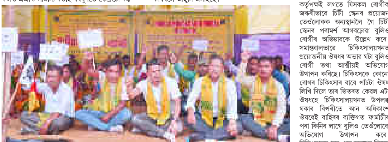
জনজাতিকৰণকে ধৰি বিভিন্ন দাবীৰ সমৰ্থনত গুৱাহাটীত আক্ৰমণৰ ধৰ্মা, শুকুৰবাৰে।

শৌচালয় আৰু প্ৰসাৱাগাৰ ব্যৱস্থা। ইপিনে, ছাত্ৰ-ছাত্ৰীসকলৰ আহাৰ প্ৰস্তুত কৰিবলৈ ব্যৱস্থা নথকাত কাৰ্য্যীয়া লোকৰ চোতালত মুকলিভাৱেই আহাৰ তৈয়াৰ কৰিবলগীয়া হৈছে।