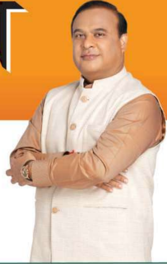
ড° হিমন্ত বিশ্ব শৰ্মা মুখ্যমন্ত্রী, অসম

কাইলৈৰ বাণিজ্যৰ বাবে আজিয়েই প্ৰস্তুত কৰা হৈছে লঘু আন্তঃগাঁথনি