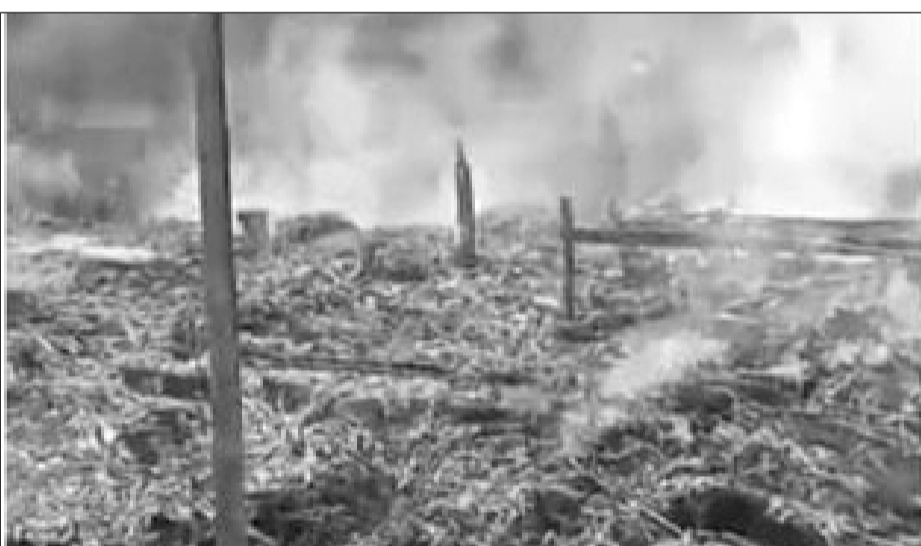
নামকপত অগ্নিকাণ্ডত ভস্মীভূত গৃহ, সোমবাৰে।