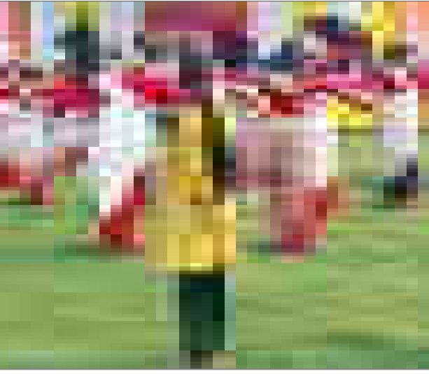
দেওমৰনৈত বিহু নৃত্যৰ আখ্যাত ব্যস্ত নাট্যী, সোমবাৰে।