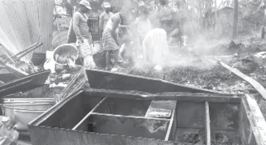
মাহমবাত যুৱ-ছাত্ৰ পৰিষদৰ নেতাৰ ঘৰত দুৰ্বৃত্তই অগ্নিসংযোগ কৰাৰ ফলত বিধ্বস্ত গৃহ, সোমবাৰে।