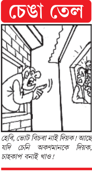
হেৰি, ডেট বিচৰা নাই দিয়ক। আছে যদি ডেই অৰুণমানকে দিয়ক, চাহকপ বনাই খাও!

পহিলা এপ্ৰিলৰ পৰা বিদ্যুতৰ মাচুল বৃদ্ধি ■ প্ৰতি ইউনিটত বাঢ়িব ৫৯ পইচা ■ প্ৰতি কিলোৱাটৰ ফিক্সড চাৰ্জত ১০-৫০ টকা, এনাৰ্জী চাৰ্জত ২৫-৫০ পইচালৈ বৃদ্ধি ■ ৫৪৬ কোটিৰ লোকচান