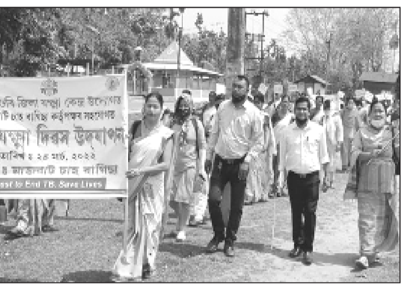
বিশ্ব যক্ষ্মা দিৱস উপলক্ষে মাজবাটত উলিওৱা সমাল, বৃহস্পতিবাৰে

অগ্ৰদূত বাৰ্তা সৌৰীসাগৰ, ২৪ মাৰ্চ : শিৱসাগৰ জিলাৰ কালুগাঁও অঞ্চলৰ কৰিব গাঁৱত কাহৰা সাধনী মহিলা সমিতিৰ উদ্যোগত আৰু স্থানীয় ৰাইজৰ সহযোগত অহা ২১ আৰু ২২ এপ্ৰিলত সতী সাধনীৰ স্মৃতি দিৱসৰ লগতে ৰঙালী বিহু উদ্‌যাপনৰ ব্যাপক প্ৰস্তুতি চলিছে।