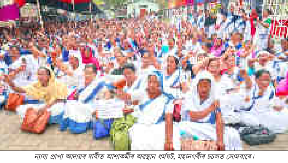
ন্যায় প্ৰাপ্য আদায়ৰ দাবীত আশাকামীৰ অৱস্থান ধৰ্মঘট, মহানগৰীৰ চলত সোমৰাৰে।

■ মুখ্যমন্ত্ৰীৰ আহ্বানলৈ সঁহাৰি নাই ■ আৰক্ষীৰে সংঘৰ্ষক লৈ উত্তপ্ত হ'ল বিধানসভা ■ এই পৰ্যন্ত ২৯জনৰ মৃত্যু-৯৬জন আঘাতপ্ৰাপ্ত