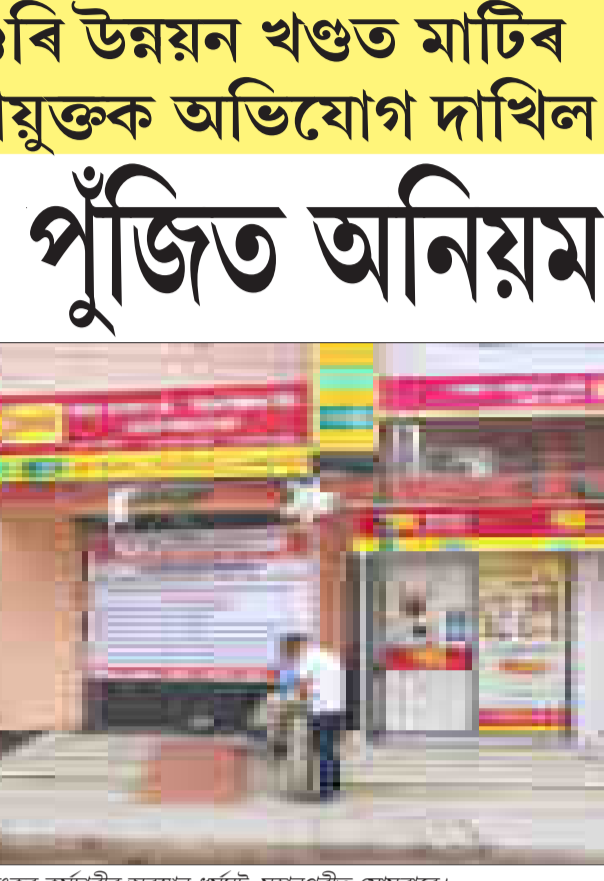
পঞ্জাৰ নেচনেল বেংকৰ কৰ্মচাৰীৰ অৱস্থান ধৰ্মঘট, মহানগৰীত সোমবাৰে।