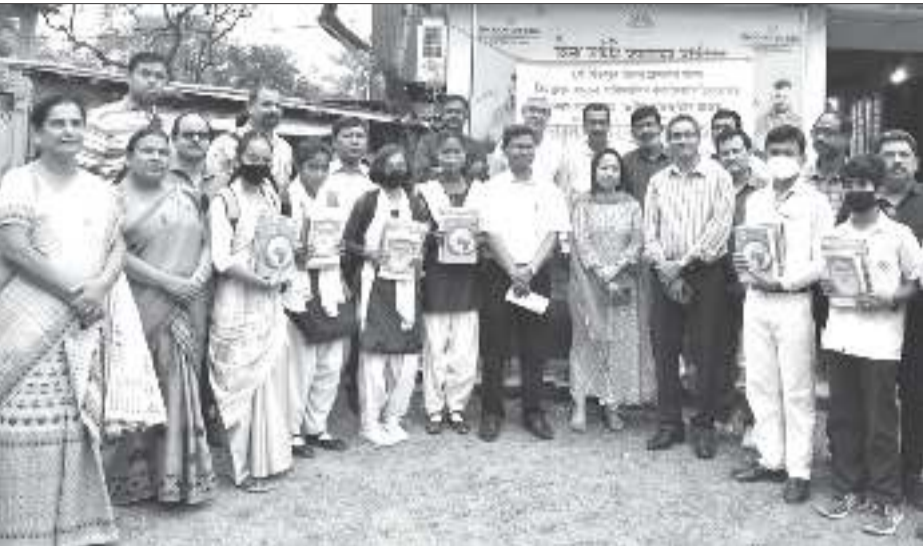
তেজপুৰত বিনামূলীয়া পাঠ্যপুথি বিতৰণ, নুৰাবাৰে।