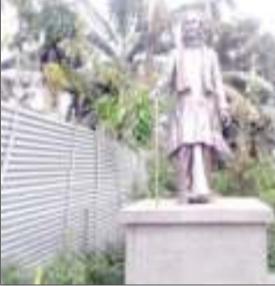
আন্দোলনৰ মধ্যভাগলৈকে দেশৰ ৰাজনীতিত চমক সৃষ্টি কৰা ছ'চিয়েলিষ্ট দলৰ অভিসম্বাদী নেতা বৰাই এই সমষ্টিটো প্ৰতিনিধিত্ব কৰিছিল। ৮০ৰ দশকত তেওঁ অসম বিধানসভাত ৰাজ্যৰ কৃষিক্ষেত্ৰ হৈ থকাৰ সময়তে দুৰদৰ্শী কাৰ্য দক্ষতাই অসমত জন্ম দিছিল ক্ষুদ্ৰ চাহ খেতিৰ। আজিৰ তাৰিখত এই ক্ষুদ্ৰ চাহ খেতিয়কৰ চাহ খেতিয়ে অসমত আবাদী হৈ থকা লক্ষ লক্ষ বিঘা মাটি চাহ খেতিয়ে আৱৰি ধৰিলে। নিতৌ বিঘাৰ পাছত বিঘাকৈ চাহ খেতি সম্প্ৰসাৰিত হৈ হৈ আজি অসমৰ লক্ষ লক্ষ পৰিয়ালৰ লক্ষ লক্ষ যুৱক-যুৱতী এই চাহ খেতিৰ দ্বাৰা উপকৃত হৈছে। অকল্পনীয়ভাৱে বৰ্তমান সময়ত অসমৰ ক্ষুদ্ৰ চাহ খেতিয়কে চাহ শিল্পই ব্ৰিটিছ যুগৰ পৰা অসমত খোপনি পোতা বৃহৎ বৃহৎ চাহকোম্পানীসমূহৰ লগত প্ৰতিদ্বন্দ্বিতা কৰিবলৈ সক্ষম হৈ অসমৰ অৰ্থনীতিত প্ৰভুত অৰিহণা যোগাইছে। উল্লেখ্য যে বিধানসভাৰ মজিয়াত তদানীন্তন একাংশ