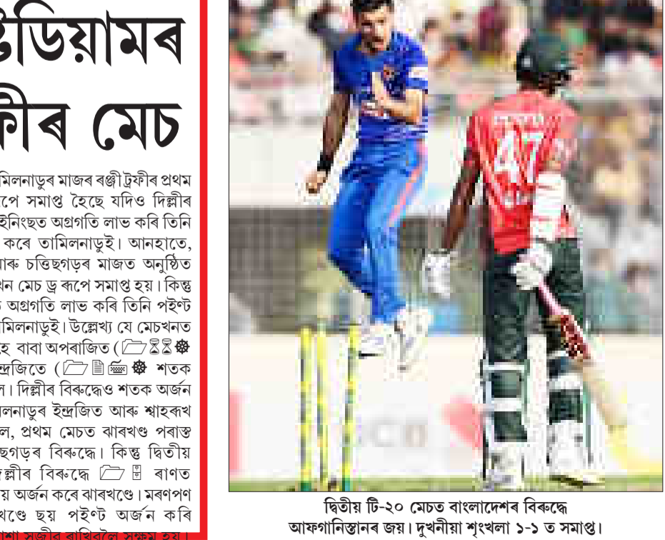
দ্বিতীয় টি-২০ মেচত বাংলাদেশৰ বিৰুদ্ধে আফগানিস্তানৰ জয়। দুখনীয়া শৃংখলা ১-১ ত সমাপ্ত।