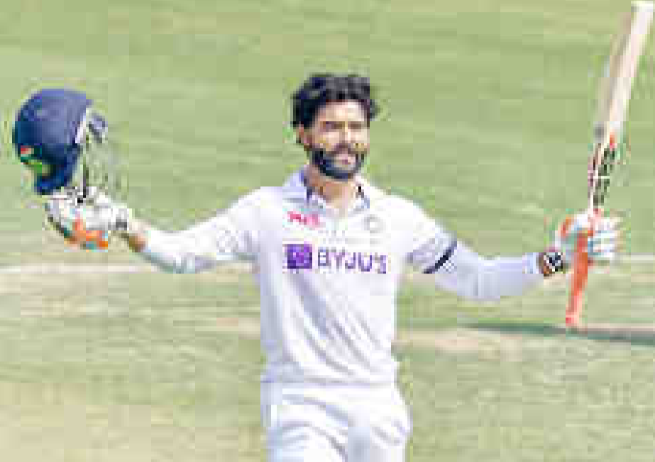
মোহালি, ৫ মাৰ্চ : ভাৰতে শ্ৰীলংকাৰ বিৰুদ্ধে খেলা দুখনীয় টেষ্ট শৃংখলাৰ প্ৰথমখন মেচত চালকৰ আসনত বহিছে। উল্লেখ্য যে মোহালী ষ্টেডিয়ামত চলি থকা টেষ্টখনত টছত জয় হৈ বেটিং কৰা ভাৰতে প্ৰথম দিনা ছয় উইকেট হেৰুৱাই ৯৮ ৰাণ কৰি প্ৰথম ইনিংছ যোগা কৰে। ভাৰতৰ এই বৃহৎ ৰাণৰ মূলেতে হ'ল বৰীষ্ট জাদেজাৰ ১৭৫ ৰাণৰ অপৰাজিত শতক। উল্লেখ্য যে প্ৰথমদিনাৰ খেলৰ অন্তত উইকেটত দূৰতাবে বেটিং কৰি থকা জাদেজাই আজি বিন্সফাক ইনিংছ খেলি ১৬০ টা বাউণ্ডেৰী আৰু তিনিটা ছিষ্টাৰুৱাই ১৬০ ৰাণৰ অনবদ্য ইনিংছতো খেলে। আনহাতে, বৰীচন্দ্ৰন অশ্বিনে কৰে ৫ ৰাণ। উল্লেখ্য যে উভয়ৰ মাজত শতকীয় যুটি হয়। ইফালে, দ্বিতীয় দিনাৰ খেলৰ অন্তত