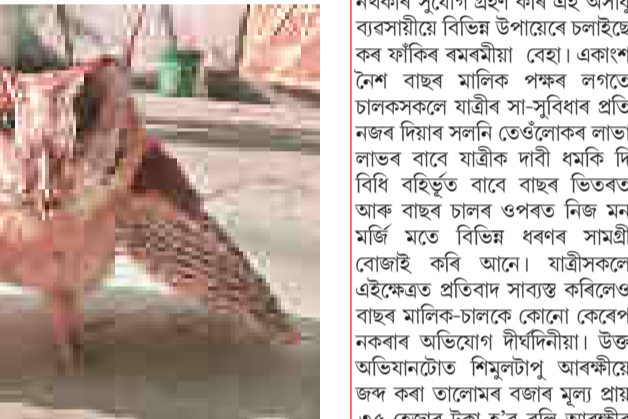
বাগ্‌সৰ উত্তৰকণ্ঠীত উদ্ধাৰ সোণালী কেঁচা, শনিবাৰে।

তৎপৰতাত ইতিমধ্যে উদ্বেগ প্ৰকাশ কৰি আহিছে ভিয়েটনাম চৰকাৰে। নিজৰ অৰ্থনীতিক অঞ্চলৰ মাজত চীনা নৌসেনাৰ এই অনুশীলনক ভিয়েটনামৰ সাৰ্বভৌমত্বৰ প্ৰতি ভাবুকি আৰু উলংঘন কৰা বুলি দেশৰ সংবাদ মাধ্যমত বাতৰি প্ৰকাশ পাইছে। উল্লেখ্য যে ২০২০ত দক্ষিণ-চীন সাগৰৰ বিবদমান প্যাডাচাল দ্বীপপুঞ্জৰ সৰ্ববৃহৎ দ্বীপ উডি আইলেণ্ডত চীনা নৌসেনাৰ যুদ্ধ বিমান অবতৰণক লৈ বেইজিং আৰু ভিয়েটনামৰ মাজত উত্তেজনাৰ সৃষ্টি হৈছিল। তাৰ পূৰ্বেও ২০১৪ৰ চীনৰ এটা খনিজ সম্পদ পৰিবাহী জাহাজ ভিয়েটনামৰ জলসীমাত খনন