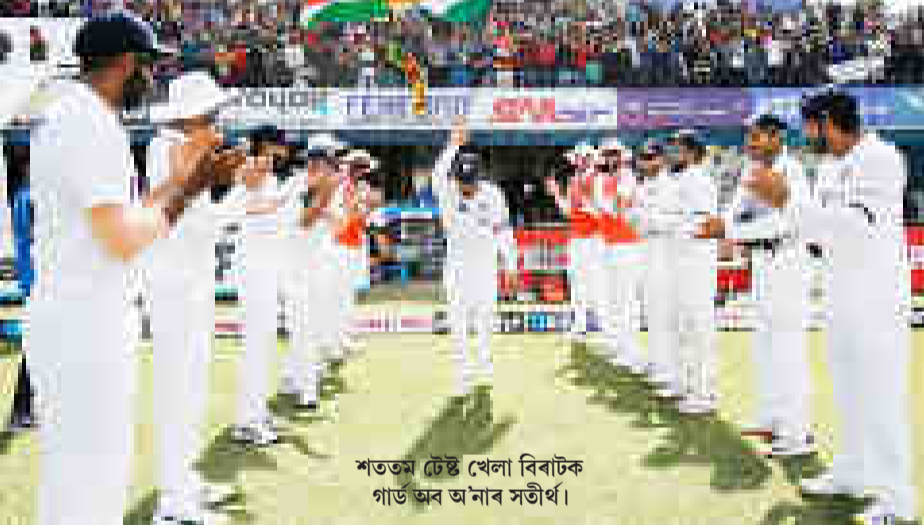
শততম টেষ্ট খেলা বিৰাটক গাউছৰ আনাৰ সতীৰ্থ।

গুৱাহাটী, ৫ মাৰ্চ : গুৱাহাটীৰ এ চি এৰ বৰ্ষাপাৰা ষ্টেডিয়ামত চলি থকা বঞ্জী ট্ৰফীৰ মেচত চতিছগড়ৰ বিৰুদ্ধে ফল'অনৰ সন্মুখীন হৈছে দিল্লী। উল্লেখ্য যে মেচখনত অমনিৱীপ (১৬০) আৰু শশাংকৰ (১৬০) শতকীয় ইনিংছৰে দিল্লীৰ বিৰুদ্ধে পোনতে বেটিং কৰা চতিছগড়ে প্ৰথম ইনিংছত ন উইকেটত ১৬০ ৰাণ কৰি ইনিংছ যোগা কৰিছিল। প্ৰত্যন্তৰত, দ্বিতীয় দিনাৰ খেলত দিল্লীয়ে বেটিং কৰি ১৬০ ৰাণত তিনটি উইকেট হেৰুৱাই বিপদত পৰাৰ পাছত আৰ্জি ১৬০ ৰাণত প্ৰথম ইনিংছ সামৰি ফল'অনৰ সন্মুখীন হয়। তৃতীয় দিনাৰ খেলৰ অন্তত দ্বিতীয় ইনিংছত দিল্লীয়ে কোনো উইকেট নেহেৰুৱাকৈ ১৬০ ৰাণ কৰিছে। এতিয়াও ১৬০ ৰাণ পিছ পৰি আছে দিল্লী। উল্লেখ্য যে বঞ্জী ট্ৰফীৰ পৰা দিল্লীৰ বিদায় নিশ্চিত হৈছে যদিও চতিছগড়ে সাত পইন্ট লাভ কৰি কোৱাৰ্টাৰ ফাইনেললৈ উত্তৰণৰ আশা কৰি আছে। কিন্তু গুপৰ পৰা এটা দলহে