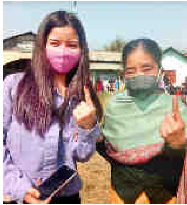
মণিপুৰৰ নিৰ্বাচনত ভোটদানৰ পাছত চিহ্ন প্ৰদৰ্শন ভোটদাতাৰ।