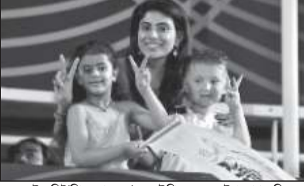
ডুৱেইন ব্ৰেভ' বিছৰ পুত্ৰৰ সৈতে আইপিএলৰ মেচ উপভোগ কৰিছে ৰবীন্দ্ৰ জাদেজাৰ পত্নী-কন্যাই, বৃহস্পতিবাৰে।

নিউজ বুৰ' মুম্বাই, ১ এপ্রিল : ৪০ বছৰ বয়সতো চমক স্নান হোৱা নাই মহেন্দ্ৰ সিং ধোনিৰ। যোৱা নিশা চেমাই ছুপাৰ কিংছ পৰাজিত হ'লেও প্ৰাক্তন অধিনায়কজনে এক বিশেষ কীৰ্তি স্থাপন কৰিবলৈ সক্ষম হয়। টি-২০ মেচত দুশ কেচ আয়ত্ত কৰাৰ বিশ্বৰ প্ৰথম উইকেট কীপাৰত পৰিগণিত হ'ল ধোনি। আনহাতে, এই কৃতিত্ব স্থাপন কৰা ধোনি হ'ল বিশ্বৰ চতুৰ্থজন ফিণ্ডাৰ। ইয়াৰ পূৰ্বে কেইব'ন পাৰ্ভাৰ্ছ, ডুৱেইন ব্ৰেভ' আৰু ডেভিদ মিলাৰে টি-২০ মেচত দুশ কেচ ধৰিছে। উইকেটকীপাৰৰূপে ধোনিয়েই প্ৰথম। অৱশ্যে উইকেটকীপাৰৰূপে ধোনিয়ে ১৯৫টা কেচ আয়ত্ত কৰিছে। ইয়াৰে ৫৭টা কেচ জাতীয় দলৰ হৈ ধৰিছিল। বাকী পাচটা কেচ তেওঁ ফিণ্ডাৰৰূপে আয়ত্ত কৰিছিল। যোৱা নিশা লক্ষ্ণৌ ছুপাৰ জয়েন্টছৰ অপেনাৰ কুইন্টন ডি'ক'ক কেচ ধৰাৰ লগে লগে ধোনিয়ে উক্ত কৃতিত্ব স্থাপন কৰে।