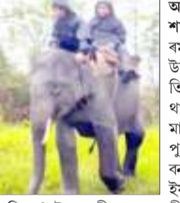
অগ্ৰদূত বাৰ্তা শালবাৰী, ১ এপ্ৰিল : আজিৰে পৰা প্ৰকৃতিৰ বমাত্মি বিশ্ব ঐতিহ্য ক্ষেত্ৰ মানাহ ৰাষ্ট্ৰীয় উদ্যানত গঁড় গণনা প্ৰক্ৰিয়া আৰম্ভ হৈছে। অহা তিনি এপ্ৰিললৈ এই গঁড় গণনা কাৰ্যসূচী অব্যাহত থাকিব। যাৰ বাবে পৰ্যটকৰ বাবে তিনিদিনলৈ মানাহৰ প্ৰবেশদ্বাৰ বন্ধ কৰি দিয়া হৈছে। আজি পুৱাৰে পৰা মানাহ ৰাষ্ট্ৰীয় উদ্যান কৰ্তৃপক্ষ আৰু বন বিভাগে গঁড় গণনা প্ৰক্ৰিয়া আৰম্ভ কৰিছে। ইফালে মানাহৰ জীপ ছাফাৰী এছ'চিয়েছনকে ধৰি কে'বটাও স্থানীয় স্বেচ্ছাসেৱী সংগঠনেও বন বিভাগক সম্পূৰ্ণ সহযোগিতা আগবঢ়াইছে। নোবামেপোৰা বৰষুণৰ মাজতো উদ্যানখনৰ ভিতৰভাগত গঁড় গণনা প্ৰক্ৰিয়া চলি থাকে। হাতী ছাফাৰীৰ লগতে জীপ ছাফাৰীৰে গঁড় গণনাৰ কাম চলোৱা হৈছে। ইতিমধ্যে প্ৰথমটো দিনত উদ্যানখনত ২৪ টা গঁড়ৰ সন্ধান পোৱা বুলি সদৰী কৰিছে কৰ্তৃপক্ষই। মানাহত পূৰ্বৰ তুলনাত এইবাৰ গঁড়ৰ সংখ্যা যথেষ্ট বৃদ্ধি পাব বুলি বন বিভাগৰ লগতে স্থানীয় লোকে আশা প্ৰকাশ কৰিছে। প্ৰাথমিকভাৱে যে ৰাষ্ট্ৰীয় উদ্যানখনত গণনাৰ পূৰ্বে ৪৮ টা গঁড় আছিল।

■ বিশ্ব ঐতিহ্য ক্ষেত্ৰ মানাহ ৰাষ্ট্ৰীয় উদ্যানত গঁড় গণনাৰ কাম আৰম্ভ