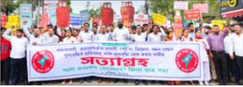
ইন্ধনসহ আত্মাৱশ্যকীয় সামগ্ৰীৰ মূল্যবৃদ্ধিৰ প্ৰতিবাদ আৰু মূল্যবৃদ্ধি ৰোধৰ দাবীত আছুৰ সত্যাগ্ৰহ।

গুৰুতৰ অনিয়মৰ আশংকা ষ্টাফ ৰিপ'ৰ্টাৰ গুৱাহাটী, ১ এপ্ৰিল : অসমে অনুদান হিচাপে লাভ কৰা হেজাৰ হেজাৰ কোটি টকাৰ ব্যৱহাৰিক প্ৰমাণপত্ৰ নিৰ্ধাৰিত সময় ভিতৰত দাখিল নকৰাৰ প্ৰভাৱ চৰকাৰৰ বিভিন্ন আঁচনিৰ হিতাধিকাৰীৰ ওপৰত পৰিছে। অসম বিত্তীয় বিধি অনুসৰি অনুদানৰ ক্ষেত্ৰত ব্যৱহাৰিক প্ৰমাণপত্ৰ পূৰ্ণ লাভৰ এবছৰৰ ভিতৰত ১০ পৃষ্ঠাত চাওক