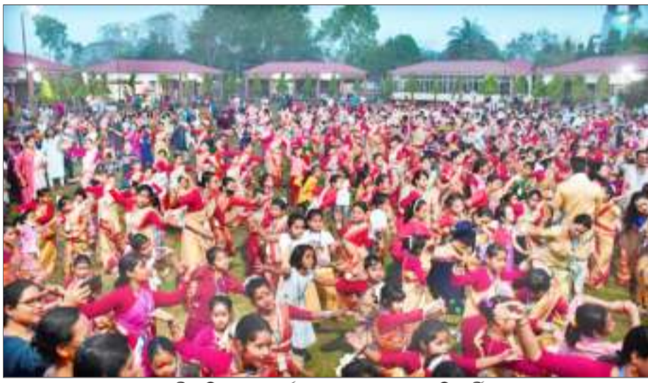
মহানগৰীত বিহু নৃত্যৰ কৰ্মশালাত অংশগ্ৰহণ কৰা প্ৰশিক্ষাৰ্থী, গুৰুৱাবাৰে।