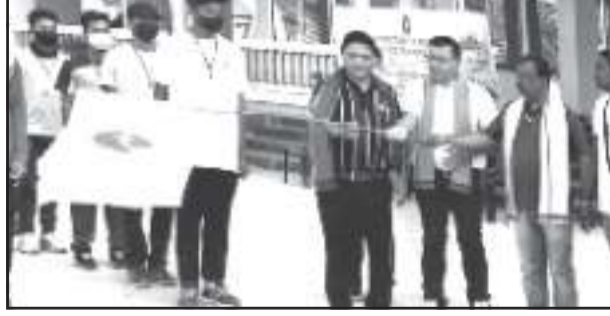
দুঃসাহসী ক্ৰীড়াৰ প্ৰশিক্ষণ শিবিৰৰ সামৰণিৰ এটি মুহূৰ্ত।