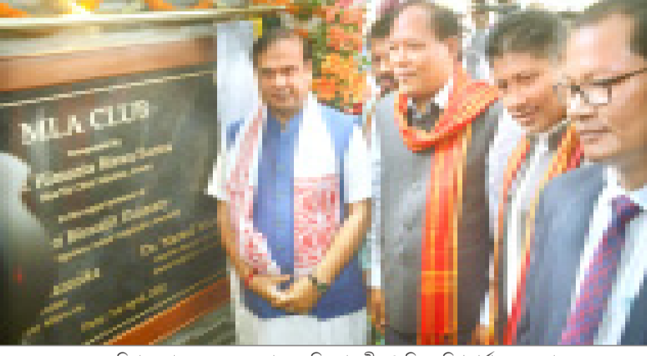
অসম বিধানসভাত এম এল এ ক্লাব মুকলি মুখামতী ড° হিমন্ত বিশ্ব শৰ্মাৰ, গুৰুৱাৰে।

■ বিশ্ব ঐতিহ্য ক্ষেত্ৰ মানাহ ৰাষ্ট্ৰীয় উদ্যানত গঁড় গণনাৰ কাম আৰম্ভ