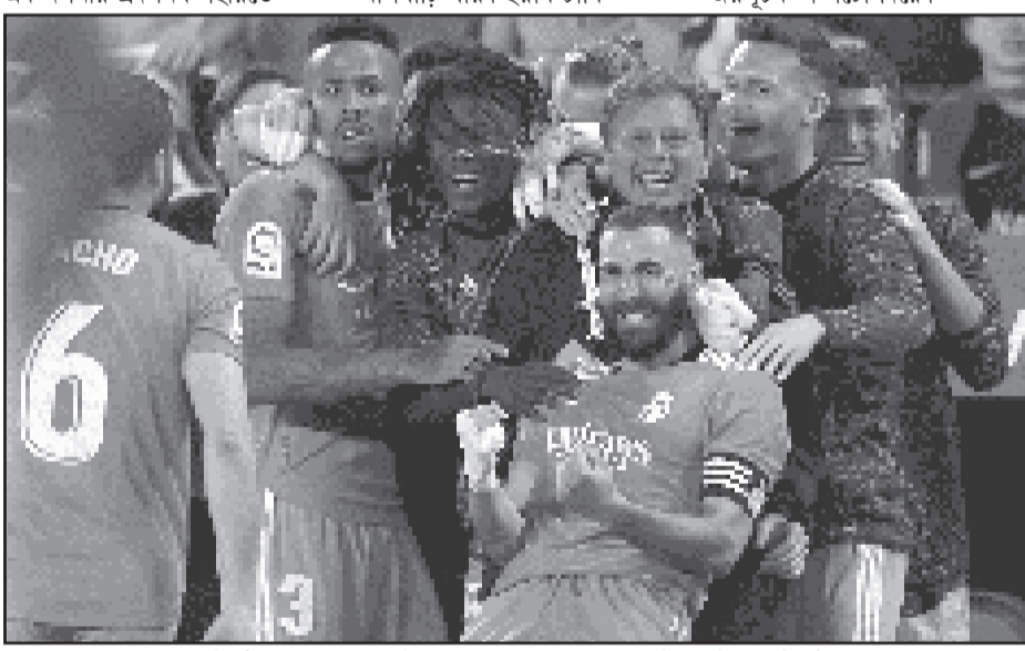
নিৰ্ণায়ক গ'লদাতা কৰিম বেনজেমাক লৈ উল্লাস পিএছজিৰ সতীৰ্থৰ।