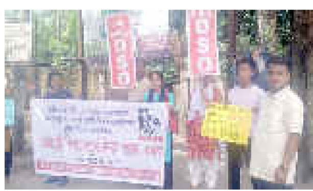
কৰাৰ দাবী জনায়। উল্লেখ্য যে প্ৰতিবাদী সভাত ১৯৮৬ত তদানীন্তন কংগ্ৰেছৰ কেন্দ্ৰীয় চৰকাৰে নতুন জাতীয় শিক্ষা নীতি প্ৰণয়ন কৰি শিক্ষাৰ ব্যৱসায়ীকৰণ ব্যক্তিগতকৰণৰ দুবাৰ মুকলি হোৱা ক্ৰমাগতভাৱে ছাত্ৰ-ছাত্ৰীৰ সংখ্যা কমিবলৈ লয় আৰু মালিকাধীন শিক্ষা প্ৰতিষ্ঠানত ছাত্ৰ-ছাত্ৰীৰ সংখ্যা বাঢ়িবলৈ লয়। পৰৱৰ্তী সময়ত সৰ্বশিক্ষা অভিযান আৰু ২০০৯ত শিক্ষা অধিকাৰ আইন বলৱৎ কৰি প্ৰাথমিক আৰু উচ্চ প্ৰাথমিক শিক্ষাক ধ্বংস মুখলৈ ঠেলি পঠিওৱা সন্দৰ্ভত গৰিহণা দিয়ে।

অগ্ৰদূত বাৰ্তা লখিমপুৰ , ২০ এপ্রিলঃ বাজাজুৰি আজি চৰকাৰী শিক্ষা বচাও দিবসৰ অংশ তথা নতুন জাতীয় শিক্ষা নীতি ২০২০ কাৰ্যকৰী কৰি চৰকাৰী শিক্ষা ব্যৱস্থাক ধ্বংসৰ মুখেই ঠেলি দিয়াৰ চৰ্কাৰত বিৰুদ্ধে অল ইণ্ডিয়া ডিএছঅ'ৰ অসম ৰাজ্যিক কমিটিৰ আহ্বান তথা লখিমপুৰ জিলা কমিটিৰ উদ্যোগত পুৱা ১০ বজাত জিলা উপায়ুক্ত কাৰ্যালয়ৰ সমুখত এক প্ৰতিবাদী কাৰ্যসূচী পালন কৰা হ'ল। প্ৰতিবাদীকাৰীয়ে জাতীয় শিক্ষানীতি ২০২০ কাৰ্যকৰী কৰি ৰাজহুৱা শিক্ষা ব্যৱস্থাক ধ্বংস কৰাৰ চৰ্কাৰত বন্ধ কৰাৰ, দুখীয়া ঘৰৰ ছাত্ৰ-ছাত্ৰীৰ শিক্ষাৰ সুযোগ কাটি লোৱা নচলিব, অষ্টম শ্ৰেণীলৈকে পাছ-ফেল প্ৰথা পুনৰ প্ৰবৰ্তন, পৰ্যাপ্ত শিক্ষক নিয়োগ কৰি ৰাজহুৱা শিক্ষাৰ মান উন্নত