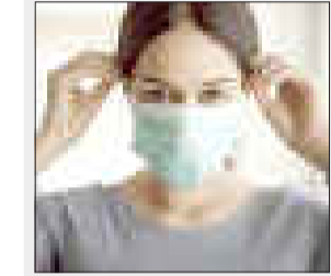
মাস্ক পৰিধান নকৰিলে দিল্লীত ভৰিৰ লাগিব ৫০০ টকাৰ জৰিমনা

কৰ'নাত আক্ৰান্ত শিশুকে শেহতীয়াভাৱে চিকিৎসালয়ত ভৰ্তি কৰোৱাৰ সন্দৰ্ভত বিশেষজ্ঞই জানিবলৈ দি কয় যে দিল্লী আদিত বৰ্তমানে ক'ভিড আক্ৰান্ত হৈ চিকিৎসালয়ত ভৰ্তি হোৱা শিশুৰ সংখ্যা বৃদ্ধি পাইছে যদিও এইসকল শিশু পূৰ্বৰে পৰা বিভিন্ন স্বাস্থ্যজনিত সমস্যা আক্ৰান্ত হৈছে।