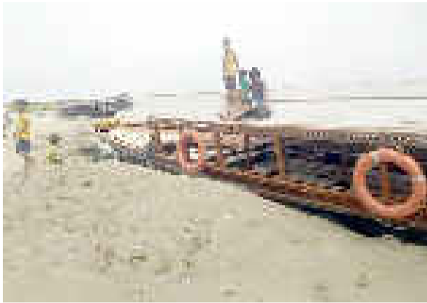
শেহতীয়াকৈ বাজা চৰকাৰৰ আভ্যন্তৰীণ জল পৰিবহণ বিভাগে আওপূৰণি ফেৰী আৰু ভূটভূটি

অগ্ৰদূত বাৰ্তা শৈলীমাৰা , ২০ এপ্রিলঃ দুবছৰৰ অন্তত পুনৰ আৰম্ভ হ'ব ধিং-শিঙৰী ফেৰী সেৱা। সেয়েহে আভ্যন্তৰীণ জল পৰিবহণ বিভাগৰ পদক্ষেপত ধিং-শিঙৰী ফেৰী সেৱাৰ স'তে জড়িত লোকসকলৰ মুখত বিৰিঙিল হাই। উল্লেখ্য যে দীৰ্ঘদিন ধৰি ধিং-শিঙৰী ফেৰী সেৱাত আওপূৰণি নাও অতি বিপদসংকুলভাৱে ব্ৰহ্মপুত্ৰৰ বুকুত চলাচল কৰিছিল। দুবছৰ পূৰ্বে ব্ৰহ্মপুত্ৰৰ বুকুত কে'বাটাও সংঘটিত নাও দুৰ্ঘটনাৰ পাছত শোণিতপুৰৰ শিঙৰী-ধিং ফেৰী সেৱাও বন্ধ ৰাখিছিল আভ্যন্তৰীণ জল পৰিবহণ বিভাগে।