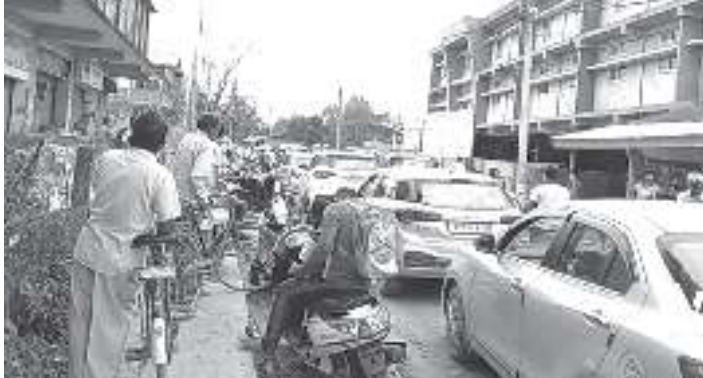
বিদ্যালয়লৈ অহা-যোৱা কৰা বাহনসমূহৰ বাবে যানজটৰ সৃষ্টি হৈ ৰোগী কঢ়িয়াবলৈ বাধ্য হৈছে লোক

অগ্ৰদূত বাৰ্তা জাঁজী, ২৪ এপ্ৰিল : যোৰহাট জিলাৰ টীয়ক ছেকেণ্ডাৰী ১৫০০ ছাত্ৰ-ছাত্ৰী থকা বিদ্যালয়খনত নাই যান-বাহন ৰখা ঠাই। ফলত ধৰি পথচাৰী আৱদ্ধ হ'বলগীয়া হয় ঘটনা উপৰি ঘট। অথচ কাগসাৰ নাই প্ৰশাসন কি স্কুল স্বত্বাধিকাৰীৰ। নগৰৰ মাজ মজিয়াত এখন বিদ্যালয় খুলিবলৈ থাকিবলগীয়া সুবিধাসমূহ নথকাকৈ কি ৰহস্যত এখন স্কুল খোলাৰ অনুমতি টীয়ক নগৰ সমিতিয়ে প্ৰদান কৰিলে তাক লৈয়ো চৰ্চা হৈছে। বিদ্যালয়খনৰ পৰা সৃষ্টি হোৱা সমস্যাবৰ ক্ষেত্ৰত টীয়ক পৌৰসভাৰ নতুন পৌৰপতিয়ে কি পদক্ষেপ গ্ৰহণ কৰে তাক লৈয়ো চৰ্চা হৈছে সচেতন মহলত। ইফালে, লোক নিৰ্মাণ বিভাগৰ যোৰহাট কাৰ্যালয়ৰ একাংশ বিষয়াৰ টোঘলকী কাণ্ডত ১৩ পৃষ্ঠাত চাওক