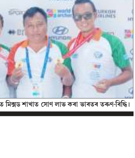
বিশ্বকাপ আৰ্চাৰীত মিন্ড্ৰ শাখাত সোণ লাভ কৰা ভাৰতৰ তৰুণ-বিন্দি।