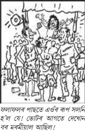
ফলাফলৰ পাছতে এওঁৰ কপ সলনি হ'ল যে! ভোটৰ আঁঠুতে দেখোন বৰ মৰমীয়াল আছিল!