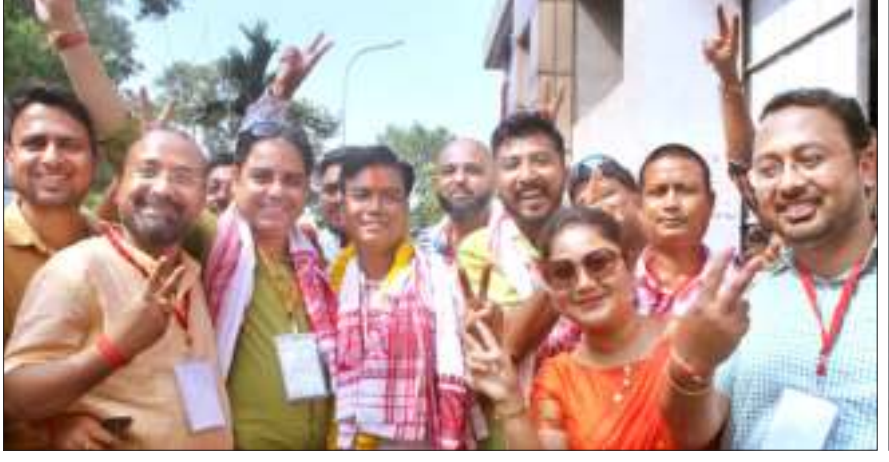
গুৱাহাটী পৌৰ নিগমৰ নিৰ্বাচনৰ বিজয়ী দুই মিত্ৰ দল বিজেপি আৰু অগপৰ একাংশ প্ৰাৰ্থী, দেওবাৰে।

ষ্টাফ ৰিপ'ৰ্ট গুৱাহাটী, ২৪ এপ্ৰিলঃ সম্পূৰ্ণ একপক্ষীয়ভাৱে আজি গুৱাহাটী পৌৰ নিগম (জিএমটি) দখল কৰিলে শাসকীয় বিজেপি মিত্ৰজোঁটে। অসম জাতীয় পৰিষদ আৰু আম আদমী পাৰ্টিয়ে ৰাজ্য বাজনীতিত খোপনি পোতাৰ চেষ্টাৰে এখনকৈ আসনত জয়লাভ কৰে। লক্ষণীয়ভাৱে এই নিৰ্বাচনী যুঁজৰ পৰা খালী হাত লৈ উভতিবলগীয়া হয় ৰাজ্যৰ প্ৰধান বিৰোধী দল কংগ্ৰেছ। ৬০টা ৱাৰ্ড বিশিষ্ট জিএমটিৰ ৫২টা ৱাৰ্ডত বিজেপিয়ে, ছটা অসম গণ পৰিষদে জয়লাভ কৰে। মিত্ৰদল হিচাপে দুয়োটা দলৰ দখললৈ যায় ৫৮টা ৱাৰ্ড। ইয়াৰ বিপৰীতে অসম জাতীয় পৰিষদ আৰু আম আদমী পাৰ্টিয়ে এটাকৈ ৱাৰ্ড দখল কৰে। জাতীয় পৰিষদে এক নম্বৰ আৰু আম আদমী পাৰ্টিয়ে ৪২ নম্বৰ ৱাৰ্ডত জয়লাভ কৰে। অসম গণ পৰিষদে জয়লাভ কৰে ১০, ১২, ১৩, ২৪, ৩২ আৰু ৫৯ নম্বৰ ৱাৰ্ডত। বাকীকেইটা ৱাৰ্ডত বিজেপিয়ে জয়লাভ কৰে। অসম গণ পৰিষদ আৰু বিজেপিয়ে প্ৰতিদ্বন্দ্বিতা কৰা মাত্ৰ এটাকৈ ৱাৰ্ডত পৰাজিত হয়। অগপই সাতটা আৰু বিজেপিয়ে ৫টা ১০ পৃষ্ঠাত চাওক