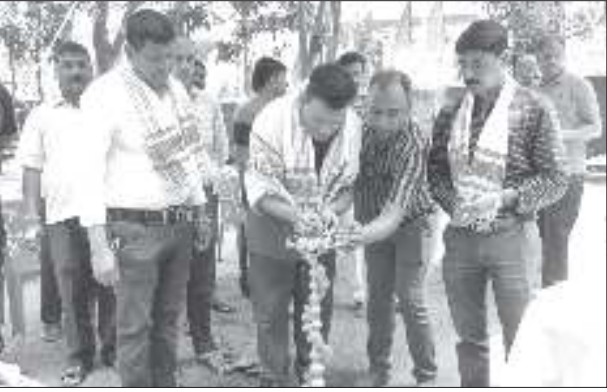
১২ পৃষ্ঠাৰ পৰা দাস আদি। উল্লেখ্য যে প্ৰতি দেওবাৰে আশ্ৰমখনত ছাত্ৰ-ছাত্ৰীসকলক বৌদ্ধিক আৰু মানসিক দিশৰ বিকাশৰ প্ৰতি লক্ষ্য ৰাখি চিত্ৰাংকনকে ধৰি বিভিন্ন ধৰণৰ শিক্ষামূলক কাৰ্যসূচী অনুষ্ঠিত কৰাৰ বাবে যোজনা কৰা হৈছে।