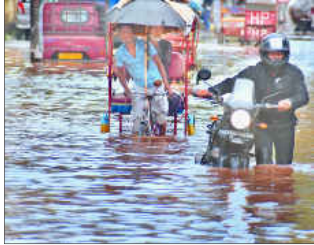
হঠাৎ অহা বৰষুণৰ ফলত কৃত্ৰিম বানপানীত ডুব গ'ল অনিল নগৰ।