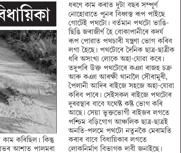
অভিযোগ কৰিছে। উল্লেখ্য যে বিগত পথটোৰ মেৰামতিৰ কাম কৰিছিল। কিন্তু ঠিকাদাৰে অধিক লাভৰ আশাত পালমৰা

অগ্ৰদূত বাৰ্তা বাহাঘাট, ১৪ মে'ঃ কামৰূপ জিলাৰ বাহাঘাটত কামৰূপ জিলাৰ পৰা সৌৰামুৰী সংযোগী পথৰ দুৰৱস্থা দেখিলে সকলো ৰাইজে সমষ্টিটোৰ বিধায়কগৰাকীয়ে দোষাৰোপ কৰিব। বাস্তৱত উক্ত কথাটো সত্য। কাৰণ এজন জনপ্ৰতিনিধিয়ে সমষ্টিটোৰ চুকে-কোণে তকা সকলো বাট-পথৰ লগতে সকলো ৰাজহুৱা অভাৱ-অভিযোগৰ প্ৰতি গুৰুত্ব দিব লাগে। কিন্তু দুৰ্ভাগ্যজনকভাৱে বিধায়কগৰাকীয়ে উক্ত পথছোৱাৰ ক্ষেত্ৰত কোনো গুৰুত্বই দিয়া নাই বুলি ভুক্তভোগী ৰাইজে পথটোৰ মেৰামতিৰ কাম কৰিছিল। কিন্তু ঠিকাদাৰে অধিক লাভৰ আশাত পালমৰা