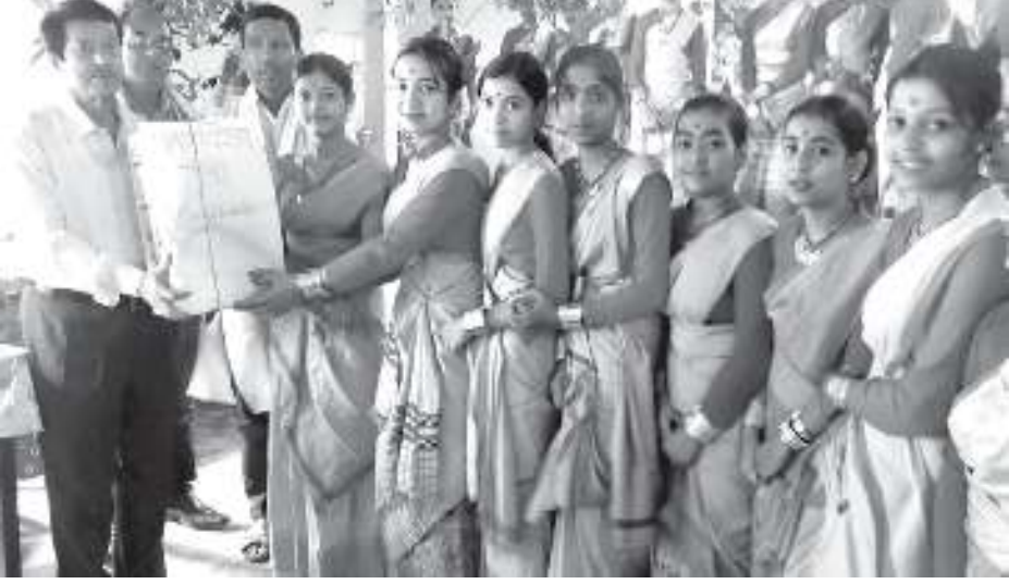
লাহদৈগড় চাৰিগাঁও উচ্চ বালিকা বিদ্যালয়ত বহাগী উৎসৱ, শুকুৰবাৰে।

পদ প্ৰাদেশীকীকৰণৰ পৰা বঞ্চিত কামৰূপৰ পশ্চিম বড়িগোগ আঞ্চলিক মহাবিদ্যালয়