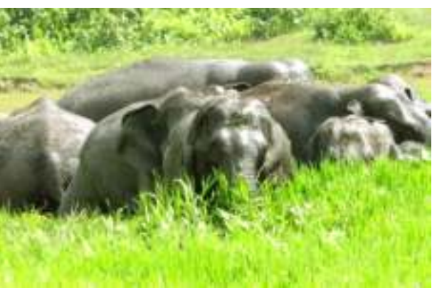
লগতে দলবান্ধি খাই জিৰণি লয়। স্থানীয় বাহিজে এই জাকটোক নজৰ ৰখাৰ্থে যদিও বৰ্তমানলৈকে কোনো ধৰণৰ অনিষ্ট সাধন কৰা নাই।

অগ্ৰদূত বাৰ্তা বকো, ৬ মে' : বনজ সম্পদৰে ভৰপূৰ পশ্চিম কামৰূপ বন সংমণ্ডল প্ৰাধিকাৰী বিষয়া কাৰ্যালয়ৰ অধীনৰ সেউজ ভূমি সংক্ৰান্তিত হোৱাত খাণ্ডৰ সন্ধানত জাকে জাকে বন্যহস্তীৰ জাক বনঞ্চল এৰি জনাঞ্চলত নামি আহিছে। দিনে দিনে বৃদ্ধি পাইছে হাতী মানুহৰ সংখ্যা। ইয়াৰ মাজত আজি বকোৰ হাৰিম লামপাৰা গাঁৱৰ সমীপে পুৱাই বিলত এজাক বনৰীয়া হস্তীয়ে গৰমৰ পৰা বন্ধা পাবলৈ নামে। পোৱালি, সাইকী, দাঁতালকে ধৰি ২৫ টা হাতী থকা জাকটোৱে বিলখনত গা খোৱাৰ