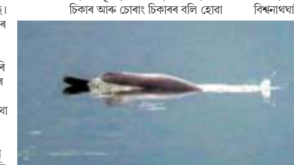
শিহুৰে বিচৰণ কৰে বুলি বন বিভাগৰ এক উচ্চস্তৰীয় সুদৃশ্য সদৰী কৰিছে।

স্টাফ ৰিপৰ্টাৰ তেজপুৰ, ৬ মে' ৪ জীয়াভৰলী নৈ আৰু ব্ৰহ্মপুত্ৰৰ তেজপুৰৰ ভোমোৰাওৰিৰ সংযোগস্থলীত এতিয়া নদী ডলফিন অৰ্থাৎ শিহুৰ জলক্ৰীড়াই সন্মোহিত কৰিছে প্ৰত্যক্ষদৰ্শী সকলোকে। উল্লেখ্য যে বিস্মনাথঘাটৰ পৰা শিলঘাট, ভোমোৰাওৰি, দেৱসিংঘাট, ৰুদ্ৰপদ, শিঙাৰীলৈকে ব্ৰহ্মপুত্ৰৰ প্ৰায় ১২০ কিলোমিটাৰ অংশত শিহুৰ সঘন বিচৰণ দেখিবলৈ পোৱা যায়। ইয়াৰ মাজতে এই দুস্ত্ৰপা জলাচৰ প্ৰাণীবিধ মানুহৰ জিয়াসোৱো বলি হোৱা দুই-এক ঘটনা মাজে মাজে পাহৰিলে আহে। উল্লেখ্য যে বিস্মনাথঘাটৰ পৰা শিঙাৰী পৰ্যন্ত প্ৰায় দুশ