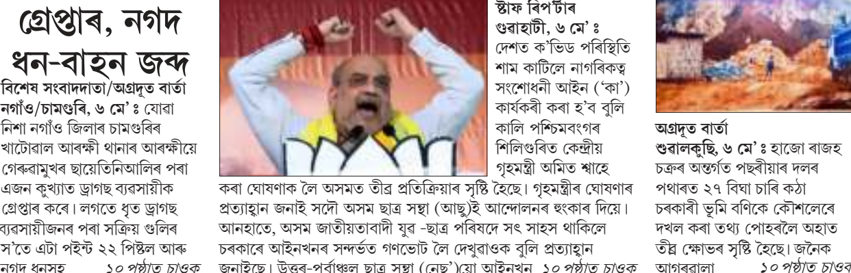
অগ্ৰদূত বাৰ্তা শ্ৰীৰামকৃষ্ণ, ৬ মে' : হাজো ৰাজহ চক্ৰৰ অন্তৰ্গত পছৰীয়াৰ দলৰ পথাৰত ২৭ বিঘা চাৰি কঠা চৰকাৰী ভূমি বণিক কৌশলেৰে দখল কৰা তথ্য পোহৰলৈ অহাত উত্তৰ ক্ষেত্ৰৰ সৃষ্টি হৈছে। জনৈক আগৰবালা ১০ পৃষ্ঠাত চাওক

২২ পিষ্টলসহ কুখ্যাত ড্ৰাগছ ব্যৱসায়ীক গ্ৰেপ্তাৰ, নগদ ধন-বাহন জব্দ বিশেষ সংবাদদাতা/অগ্ৰদূত বাৰ্তা নগাঁও/চামগুৰি, ৬ মে' : যোৱা নিশা নগাঁও জিলাৰ চামগুৰিৰ খাটোৱাল আৰক্ষী থানাৰ আৰক্ষীয়ে গেৰামুখৰ ছায়েতিনিআলিৰ পৰা এজন কুখ্যাত ড্ৰাগছ ব্যৱসায়ীক গ্ৰেপ্তাৰ কৰে। লগতে ধৃত ড্ৰাগছ ব্যৱসায়ীজনৰ পৰা সত্ৰীয় গুলিৰ স'তে এটা পইন্ট ২২ পিষ্টল আৰু নগদ ধনসহ ১০ পৃষ্ঠাত চাওক