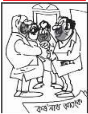
বাইজৰ মাজত আতংকতো থাকিবই! কেতিয়াবা কৰ'নাৰ, কেতিয়াবা আমাৰ দৰে জনসেৱকৰ!

সীমান্তত ভাৰতীয় সেনাৰ উপস্থিতি ধৰা পেলাবলৈ নতুন প্ৰযুক্তি কৌশল ব্যৱহাৰ কৰিলেই অৱগত হয় পিএলএ গালৱানৰ সংঘৰ্ষৰ পাছৰে পৰা বিশেষ তৎপৰতা