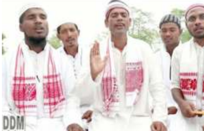
আৰু ফলশ্ৰুতিত অসমত পৃথক পৃথক মুছলমানসকলৰ আটায়ে মিলি এটা জনগোষ্ঠীয় পৰিয়াল হিচাপে স্বীকৃতি লভিছিল।

মুছলমানে ফুলকোঁৱৰ-মণিকোঁৱৰ গীত, স্বৰাজৰ গীত, পপলা পাৰ্বতীৰ গীত, লক্ষিম্ভৰ গীত, মিয়ানাম-আইনাম আদি চৰ্চা কৰিছিল। গাইছিল। উজনিৰ মুছলমানসকলৰ মাজত বিশেষকৈ গোলাঘাটৰ নাহৰণিত ভাটিমালী গীতৰো চৰ্চা হয়। নিটো আচলতে চুখী পছৰ 'বাউল' গীত। যেনে- 'সোণাৰ পিঞ্জাৰ আমাৰ / কৰিয়া গৈলা খালি বে মোৰ যতনেৰ পাৰি / সেই কোঠাই থাকিব পাৰি সদায় কৰি খেলা / সেই কোঠাৰ মাজে আজি লাগিয়া গৈছে তাল.....' আৰু; 'বনি আদমে পুখুৰী খন্দালে/ সবিয়হ নগ'লে তল'। সাধু মোৰ মহন্ত সৱাই যাই গ'লে/ এনু মোৰ পুখুৰী জল'।