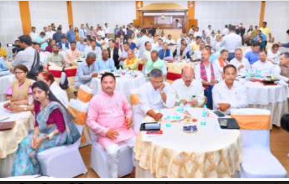
বিজেপিৰ দুদিনীয়া পৰ্যালোচনা বৈঠক সমাপ্ত। আগন্তুক বৰ্ষত সমাজৰ শেষবৰ্তো দুখীয়া পৰিয়ালকো আঁচনিত সামৰি লোৱাৰ লক্ষ্য