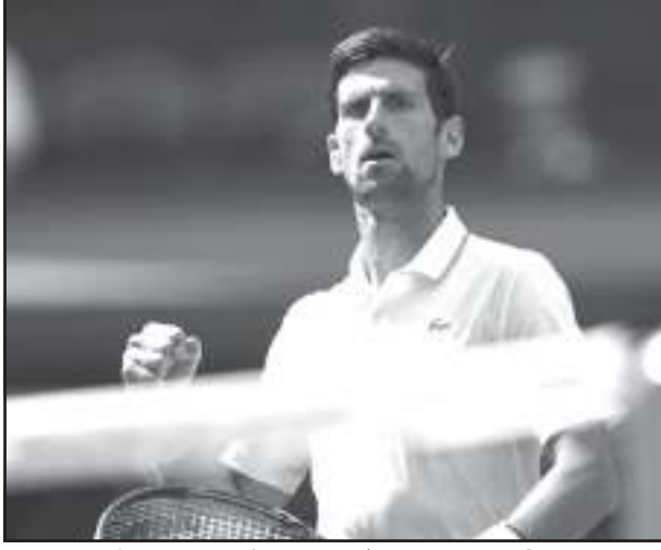
মাদ্ৰিদ অপেন টেনিছ কোৰ্টাৰ ফাইনেলত জয়ী হৈ ন'ভাক ডক'ভিভৰ প্ৰতিক্ৰিয়া, গুৰুবাৰে।