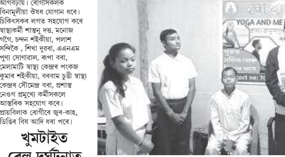
তামুলপুৰত যোগমহন কেন্দ্ৰ মুকলি, শুকুৰবাৰে।