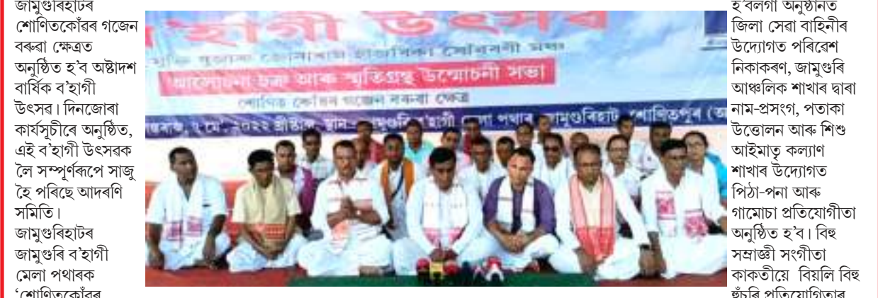
জামুগুৰিহাটৰ জামুগুৰি ব'হাগী মেলা পথাৰক 'শোণিতকোঁৱৰ গজেন বৰুৱা কেন্দ্ৰত অনুষ্ঠিত হ'ব অষ্টাদশ বাৰ্ষিক ব'হাগী উৎসৱ।

মঞ্চ উদ্বোধন কৰাৰ লগে লগে ৰাজ্যৰ ভিন্ন প্ৰান্তৰ পৰা অহা বিহু ঠুৰি দলসমূহে বিহু প্ৰদৰ্শন কৰিব। আনহাতে, কেন্দ্ৰীয় ব'হাগী উৎসৱলৈ আহিবলগীয়া ৰাজ্যৰ ভিন্ন প্ৰান্তৰ পৰা অহা অতিথিসকলক আপ্যায়নৰ বাবে জামুগুৰি আঞ্চলিকৰ ৩৬ খন শাখাৰ আইমাতৃসকলে গাঁৱে গাঁৱে প্ৰায় ২০ হেজাৰ লাৰু-পিঠা আপ্যায়নৰ বাবে তৈয়াৰ কৰি অতিথিসকলক আদৰিবলৈ সাজ হৈ পৰিছে।