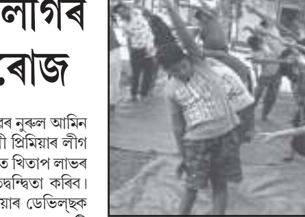
সৰুপেটাত যোগ-সমৰকলা প্ৰশিক্ষণৰ এটি মুহূৰ্ত।