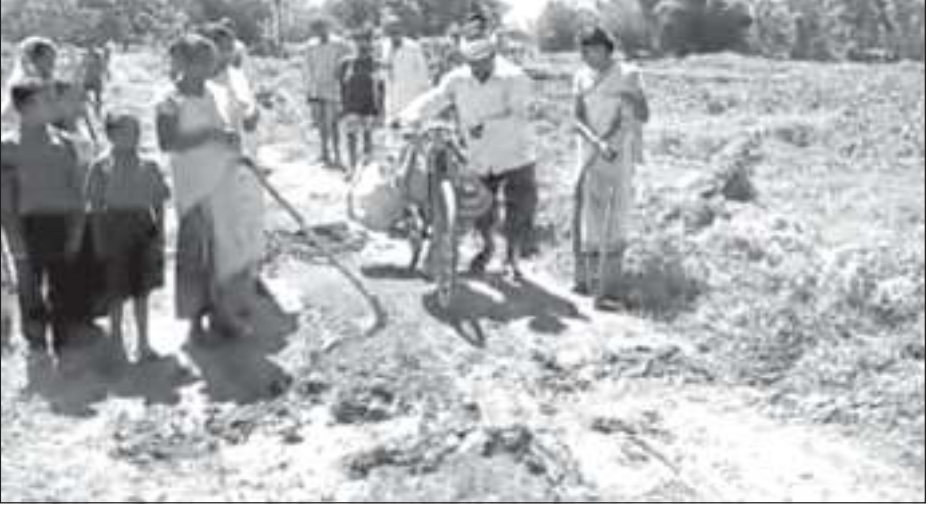
খুমটাইৰ ভোলাওৰি গাঁৱৰ বিক্ষম পথ।