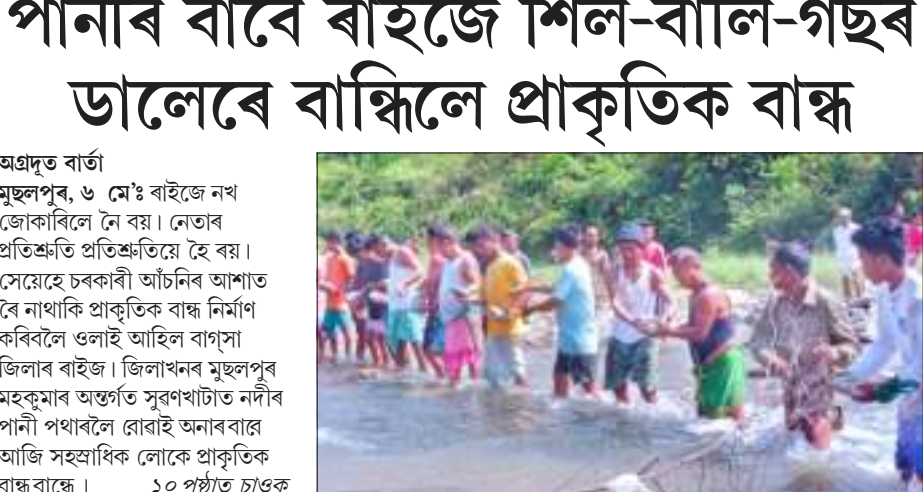
অগ্ৰদূত বাৰ্তা মুছলপুৰ, ৬ মে' : বাইজে নখ জোকৰিলে নে বয়। নেতাৰ প্ৰতিশ্ৰুতি প্ৰতিশ্ৰুতিয়ে হৈ বয়। সেয়েহে চৰকাৰী আঁচনিৰ আশাত বৈ নাথাকি প্ৰাকৃতিক বান্ধ নিৰ্মাণ কৰিবলৈ ওলাই আহিল বাগুসা জিলাৰ বাইজ। জিলাখনৰ মুছলপুৰ মহকুমাৰ অগ্ৰদূত সুবৰ্ণচাৰ্টাৰ নদীৰ পানী পথাৰলৈ ৱোৱাই আনাৰ বাবে আজি সহস্ৰাধিক লোকে প্ৰাকৃতিক বান্ধ বান্ধে। ১০ পৃষ্ঠাত চাওক

এছএছবিৰ জৰিয়তে পোহৰলৈ আহিছে তথ্য উদ্বিগ্ন দিল্লী তৎপৰ প্ৰতিৰোধক ব্যৱস্থাৰ বাবে