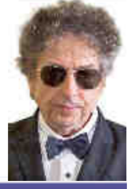
বব ডিলান ন'বেলজয়ী গীতিকাৰ-গায়ক

এজন ব্যক্তি সফল; যদিহে তেওঁ পুৰা টোপনিৰ পৰা উঠে আৰু নিশা শুবলৈ যায়, আৰু তাৰ মাজৰ সময়খিনিত যি মন যায় তাকে কৰিব পাৰে।