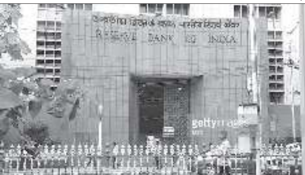
লাগিলেহেঁতেন। বৰ্তমান ভাৰতবৰ্ষত প্ৰয়োজন মানুহৰ হাতত টকা যোৱাৰ অৰ্থনীতিৰ সৃষ্টি কৰা, অৰ্থাৎ প্ৰত্যেকজন শ্ৰম কৰিব পৰা লোকৰ বাবে জায় কৰিব পৰা সুযোগ সৃষ্টি কৰা, যাতে দেশৰ অৰ্থনীতি কামক্ষমতায়িত হৈ অধিক বিকাশশীল হয়।

যাত্ৰীভাড়া বৃদ্ধিৰ বাবেও জনসাধাৰণৰ পকেটৰ পৰা অধিক পৰিমাণৰ টকা ওলাই যাব। চৰকাৰৰ অনুমোদনত কোম্পানীবোৰে ঊষধৰ দাম দহ শতাংশ বৃদ্ধি কৰিছে, এইটো কি বজাৰত টকা অধিক সঞ্চালন হোৱা বাবে ঊষধৰ দাম বৃদ্ধি হৈছে নেকি? টকাৰ সঞ্চালন হ্রাস হ'লে ঊষধৰ দাম কমিব নেকি? অৰ্থাৎ ৰেপ'ৰ্টে বৃদ্ধি