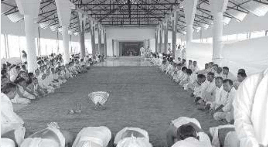
মাধৱদেৱৰ জন্মতিথি উপলক্ষে নামপ্ৰসংগ, দেওবাৰে।

অৰ্জুন সিং বাবুল সুপ্ৰিয়ৰ পাছতে পশ্চিমবংগত বিজেপি