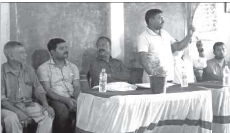
দোতমাত সদৌ অসম বাঙালী যুৱ ছাত্ৰ ফেডাৰেছন কোৱাৰ্টাৰ জিলা সমিতিৰ সাধাৰণ সভা।