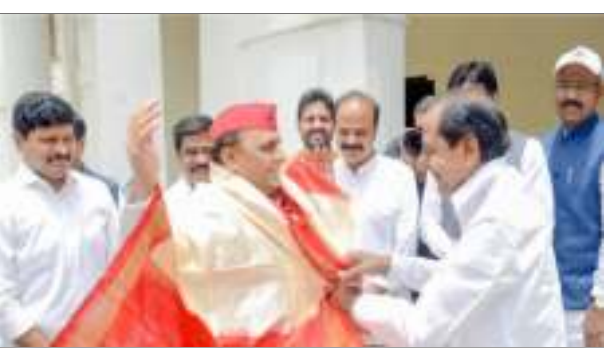
শিবিৰত নতুন জন্ম-কলনা অব্যাহত আছে। তেলেংগানাৰ মুখ্যমন্ত্ৰীয়ে আজি টুইটাৰ হেণ্ডেলত অখিলেশ আৰু কেজৰিৱালক সাক্ষাৎ কৰাৰ ফটো শ্বেয়াৰ কৰে। টুইটত বাৰে প্ৰকাশ কৰা মতে, অখিলেশ আৰু কেজৰিৱালৰ স'তে তেওঁ দেশৰ

প্ৰতিদ্বন্দ্বিতাৰ বণকৌশলত বিশেষ গুৰুত্ব দিছে। কিন্তু কংগ্ৰেছৰ আন কে'বাজিও বিৰোধীৰ দলে তৃণমূল কংগ্ৰেছৰ এই প্ৰস্তাৱলৈ বিশেষ সঁহাৰি দিয়া নাই। এইবাৰ ২০২৪ৰ লোকসভাৰ নিৰ্বাচনক লৈ সক্ৰিয়তা প্ৰদৰ্শন কৰিলে তেলেংগানাৰ মুখ্যমন্ত্ৰী বাৰে। দুদিনীয়া অমলসূচীৰে দিল্লীত উপস্থিত হোৱা তেলেংগানাৰ মুখ্যমন্ত্ৰীয়ে আজি ৰাজধানীত সমাজবাদী পাৰ্টিৰ মুৰব্বী অখিলেশ যাদৱ আৰু দিল্লীৰ মুখ্যমন্ত্ৰী অৰবিন্দ কেজৰিৱালক সাক্ষাৎ কৰে। বাৰে এইদৰে কেজৰিৱাল আৰু অখিলেশক সাক্ষাৎ কৰাৰ পাছতে বিৰোধীৰ