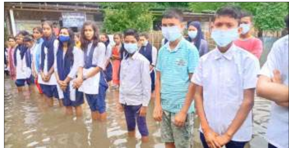
হাজোৰ চকলাপাৰ দেৱাবাবী গৰুপাৰ মধ্য ইংৰাজী বিদ্যালয়ত একাঠ পানীৰ মাজতে গুণ্ণাংসৰ অনুষ্ঠিত।