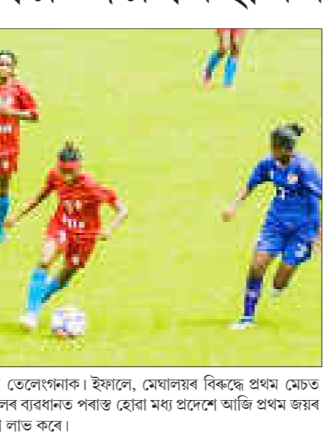
কৰিছিল তেলেংগনাক। ইফালে, মেঘালয়ৰ বিৰুদ্ধে প্ৰথম মেচত ৩-০ গ'লৰ ব্যৱধানত পৰাস্ত হোৱা মধ্য প্ৰদেশে আজি প্ৰথম জয়ৰ সফলতা লাভ কৰে।

গুৱাহাটী, ২২ জুন ৪ চলিত ১৭ বছৰ অনূৰ্ব্ব জুনিয়ৰ ৰাষ্ট্ৰীয় মহিলা ফুটবল প্ৰতিযোগিতাত ক্ৰমাগত তৃতীয়খন মেচত বৃহৎ ব্যৱধানত জয়লাভ কৰিছে বিহাৰৰ ছোৱালী দলে।