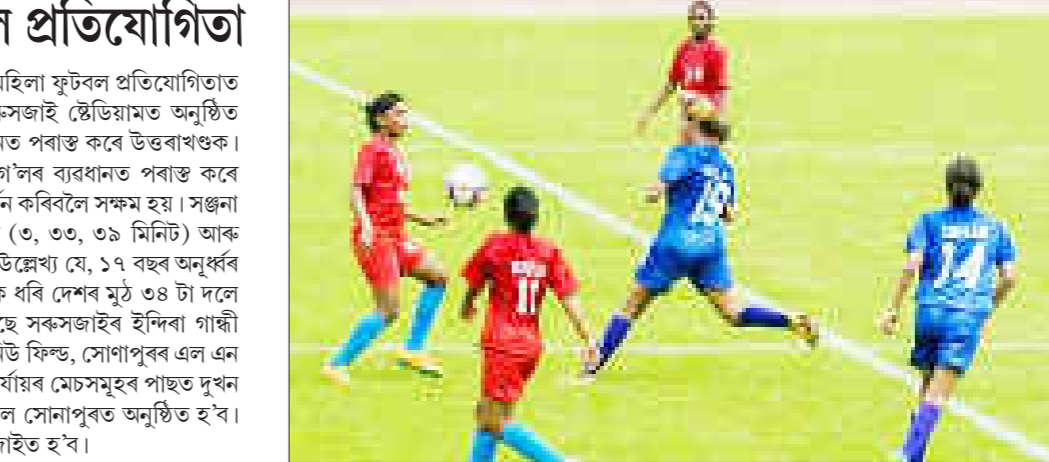
গুৱাহাটী, ২২ জুন ৪ অসম ফুটবল সন্থাই আয়োজন কৰা জুনিয়ৰ ৰাষ্ট্ৰীয় মহিলা ফুটবল প্ৰতিযোগিতাত আজি অভিযান আৰম্ভ কৰে চাৰিটাকৈ দলে।

গুৱাহাটী, ২২ জুন ৪ চলিত ১৭ বছৰ অনূৰ্ব্ব জুনিয়ৰ ৰাষ্ট্ৰীয় মহিলা ফুটবল প্ৰতিযোগিতাত আজি অভিযান আৰম্ভ কৰে চাৰিটাকৈ দলে।