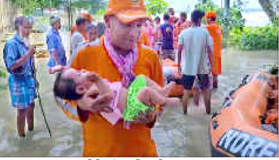
বানাক্ৰান্ত অঞ্চলৰ পৰা কৰ্মমনি শিশুক উদ্ধাৰ কৰিছে এনটিআৰএফৰ জোৱানে, মঙলদৈত বুধবাৰে।

এইবাৰ প্ৰাকৃতিক দুৰ্যোগত জৰ্জৰিত তালিবানপীড়িত আফগানিস্তান কম্পন অনুভূত পাকিস্তানতো কন্মলেৰে মেৰিয়াই থ'লে শ শ মৃতদেহৰ শাৰী মাটিৰ স্তূপত পৰিণত গৃহ বিধ্বংসী ভূমিকম্পত সহস্ৰাধিকৰ মৃত্যু