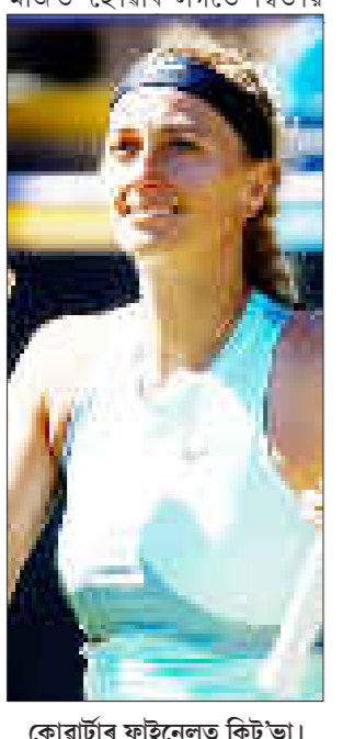
কোৰ্ভাৰ্টাৰ ফাইনেলত কিট'ভা।